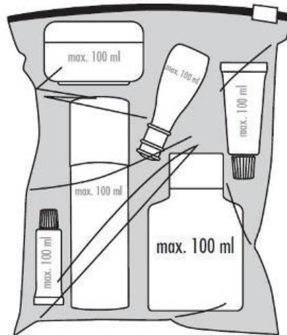
Slika 4. Višekratna prozirna plastična vrećica zapremine do jedne litre