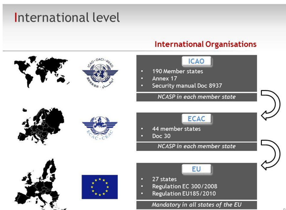
Slika 5. Međunarodna razina država članica u vezi zaštite civilnog zračnog prometa

Kako bi zaštita civilnog zračnog prometa bila sve sigurnija i unaprijeđenija, vrlo je bitna međunarodna suradnja država članica radi boljeg razumijevanja i provođenja zaštitnih mjera. Na globalnoj razini, ICAO Dodatak 17, koji je obvezujući za sve države ugovornice već postoji od sedamdesetih godina. Na temelju ove odredbe Dokument 30. Europske konferencije za civilno zrakoplovstvo (European Civil Aviation Conference – ECAC) je objavljen na europskoj razini. Kao posljedica napada 11. rujna i terorističkih napada u Londonu i Madridu, doneseni su daljnji propisi koji su detaljnije opisani, među njima i Uredba (EU) 2320/2002 78 i njemački Zakon o zrakoplovnoj sigurnosti. Svi propisi služe za zaštitu civilnog zrakoplovstva od djela nezakonitog ometanja. Na slici 5. se vidi koliko članica država svaki propis broji. 79