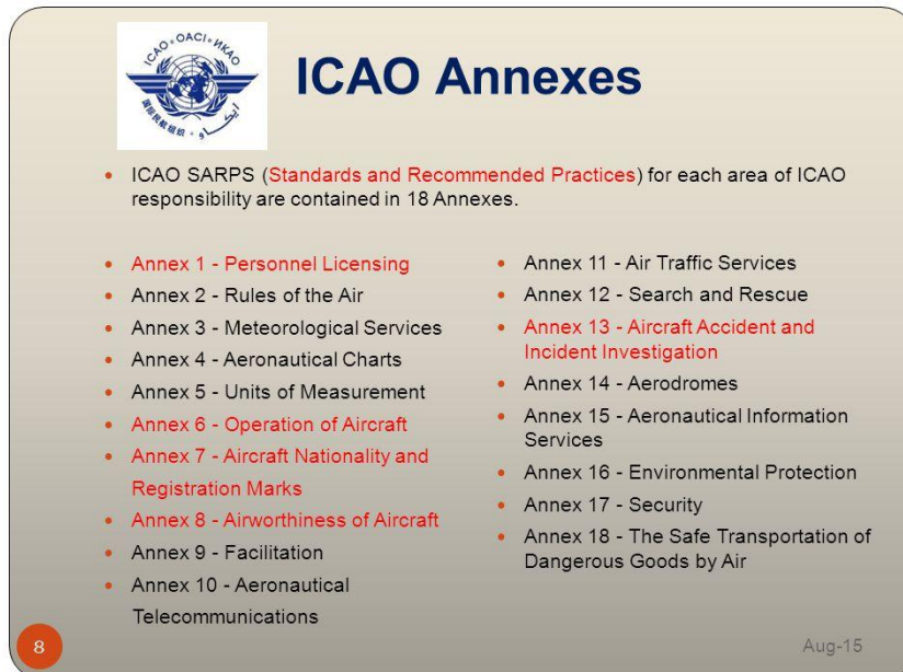
Slika 3. Ostali Dodatci ICAO-a

„ Napomena - određeni predmeti i tvari su klasificirane kao opasne robe Dodatkom 18 Konvenciji o međunarodnom civilnom zrakoplovstvu i povezanim Tehničkim uputama za siguran transport opasnih roba (Doc 9284 )i moraju se transportirati u skladu s tim uputama. Nadalje, Priručnik o zaštiti zrakoplovstva (Doc 8973 – ograničene naravi) pruža popis zabranjenih predmeta koji se nikako ne smiju prevoziti u kabini zrakoplova.“