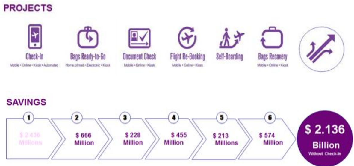
Slika 1. Šest projekata IATA programa Fast Travel