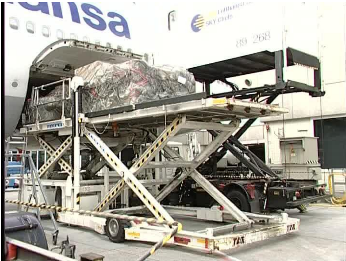
Slika 2: Ukrcajno-iskrcajna platforma

Manipulativna sredstva za prihvat i otpremu ovise o karakteru pošiljke (kategorija tereta, vrsta pakiranja, dimenzije i težina tereta koji se prevozi) i variraju od jednostavnih sredstava manipulacije poput ručnog viličara do složenih manipulativnih sredstava čiji je primjer ukrcajno-iskrcajna platforma koja je prikazana na slici 2.