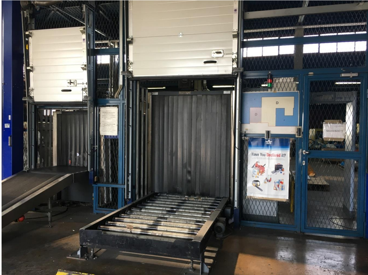
Slika 5: rendgen za sve kategorije robe na MZLZ

Izvor: izradio i prilagodio autor, 22. kolovoza.2017