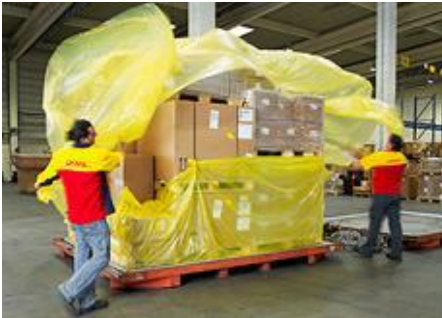
Slika 1: Pakiranje tereta

Predmet prijevoza u tehnološkom procesu je nepromjenjiv element koji djelovanjem postupaka obrade postaje pošiljka. Predmet prijevoza se može promatrati kao unutarnja kategorija pošiljke, no novi predmet obrade u tehnološkom procesu je pošiljka. Pošiljka je rezultat obrade predmeta prijevoza putem primarnog i sekundarnog pakiranja predmeta prijevoza, označavanja, okrupnjavanja s jednim ili više istovrsnih ili različitih predmeta prijevoza što je prikazano na slici 1.