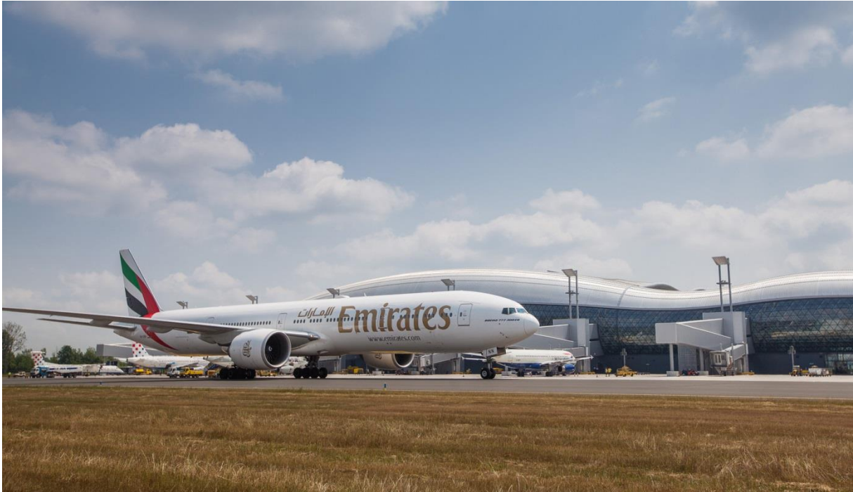
Slika 4: Emirates Boeing 777-300ER

Uvođenjem Emirates Boeing-a 777 u rute Međunarodne zračne luke Zagreb iznimno se povećala količina tereta i robe u odlasku i dolasku. Boeingov 777 zrakoplov u mogućnosti je prevesti čak do 12 tona tereta što je omogućilo prijevoz težih i većih vrsta robe na MZLZ.