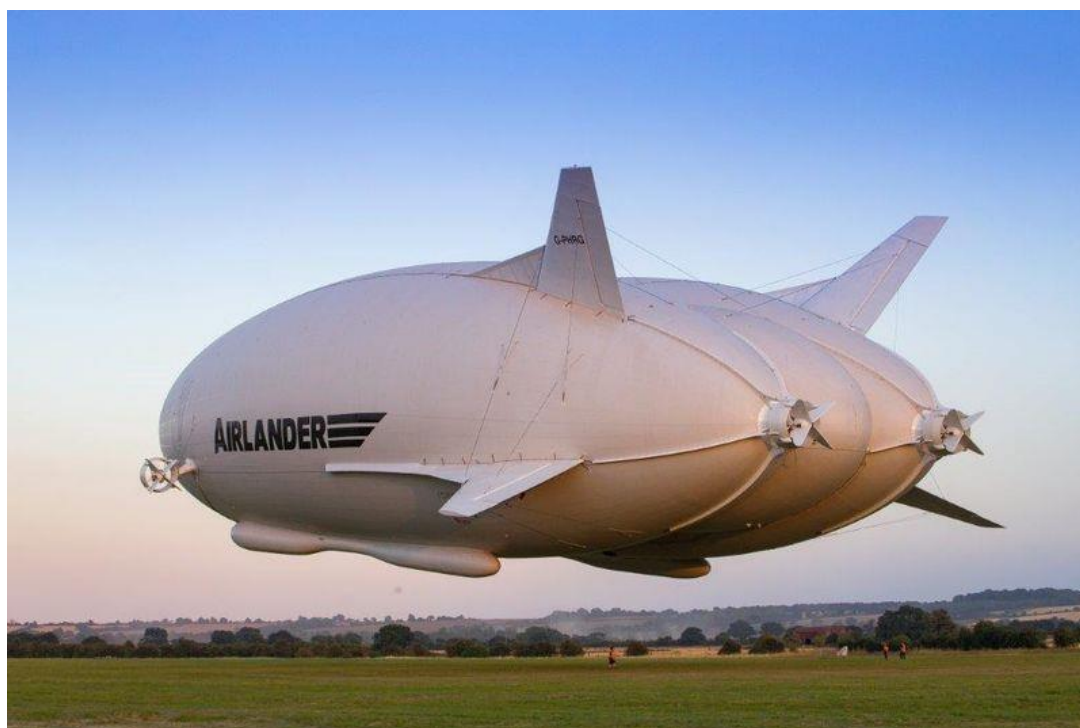
Slika 12. Airlander 10