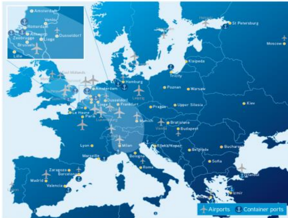
Slika 2. Zona „Blue Banana“ i najrazvijeniji robno transportni centri