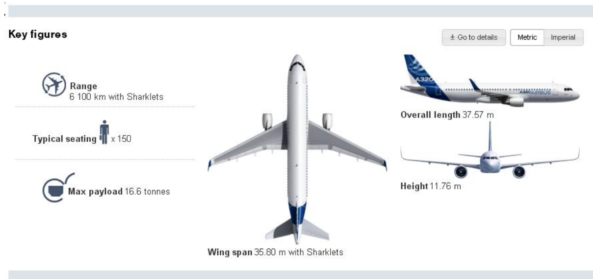
Slika 5. Karakteristike Airbusa A320-200

Na slici 5 predstavljene su osnovne tehničke značajke modela A320-200.