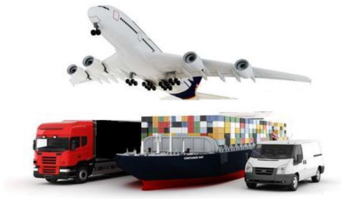
Slika 1. Intermodalni transport

Terminologija intermodalnog transporta nije ujednačena i uklađena. Često se zamjenjuje u praksi. Također, različiti subjekti intermodalnog prijevoza koriste različita nazivlja i definicije. Europska konferencija ministara transporta (ECMT), Europska unija (EU) i Europska komisija (EC) donijeli su 2001. godine dokument Terminologija kombiniranog transporta . Razlog donošenja tih definicija bila je različitost shvaćanja pojedinih termina kao i standardiziranje nazivlja za političare, tehničko osoblje i operatore te za sve sudionike kombiniranog/intermodalnog prijevoza. Prema toj definiciji, intermodalni prijevoz je kretanje tereta u jednoj te istoj teretnoj jedinici ili cestovnom vozilu koje koristi dva ili više prijevoznih modova bez diranja tereta prilikom prekrcaja s jednog prijevoznog sredstva na drugo. 1