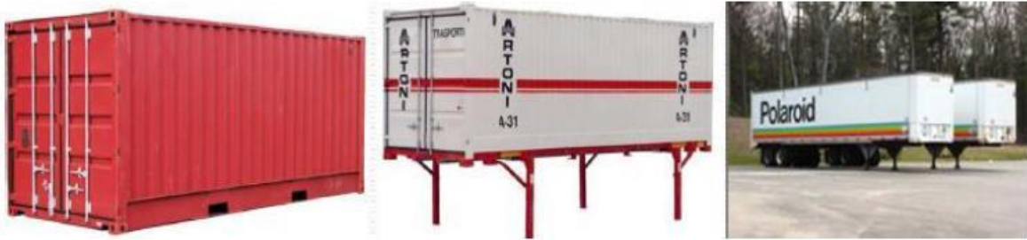
Slika 2. Osnovne intermodalne transportne jedinice