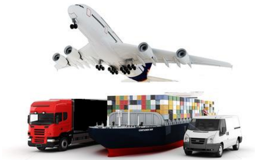
Slika 2. Intermodalni prijevoz tereta

Hrvatsko prometno pravo, u domaćem prijevozu, pojam intermodalnosti regulira odgovarajućim zakonskim odredbama u željezničkom, cestovnom i zračnom prijevozu. Zajedničko za sve tri navedene grane prometa i prometnog prava jest korištenje termina mješoviti prijevoz u zakonima koji reguliraju navedene grane. 13