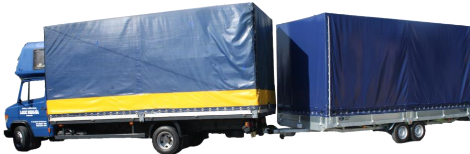
Slika 3. Odvojivi sanduk s ceradom na prikolici

Transportni uređaji obuhvaćaju različite vrste naprava čija je glavna zadaća prihvat – smještaj roba pri procesima manipulacije, premještaja ili prijevoza. Glavne vrste transportnih uređaja su izmjenjive transportne posude, kontejneri, palete, te čitavi niz transportnih posuda sa jednakom zadaćom, kao i sanduci, bačve, gajbe, košare i paketi. Izmjenjive transportne posude su odvojive nadgradnje cestovnih teretnih vozila. Radi se o sanduku cestovnog teretnog vozila, prikolice ili poluprikolice (slika 3.) koji se, može odvojiti od podvozja.