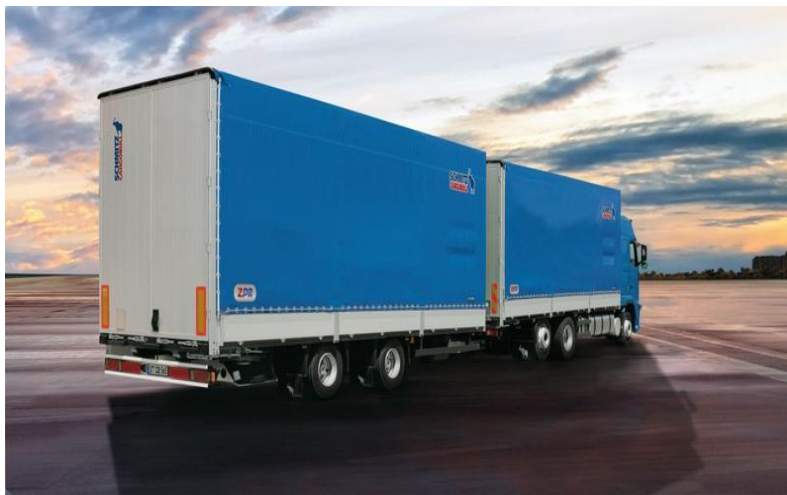
Slika 4. Kamion s prikolicom

Kod kombiniranih zrakoplova prednji prostor služi za smještaj putnika, a stražnji za prijevoz tereta, i nose oznaku C (Combi). Teretni zrakoplovi nose oznake F – Freighter, te njihov cjelokupni prostor služi za smještaj tereta. Prostor ovih zrakoplova je podijeljen na dvije palube, veću – gornju i manju – donju palubu. Najveći teretni zrakoplov je Boeing 747 F koji može primiti 110 tona tereta. Ovaj zrakoplov može ukrcati i kontejner najvećih kapaciteta. Prilikom prijevoza kontejneriziranog tereta zračni prijevoznici, osim klasičnih kontejnera pravokutnog oblika, koriste i specijalne, tzv. iglo-kontejnere, čiji je oblik prilagođen obliku trupa zrakoplova odnosno prostora za smještaj tereta. 41