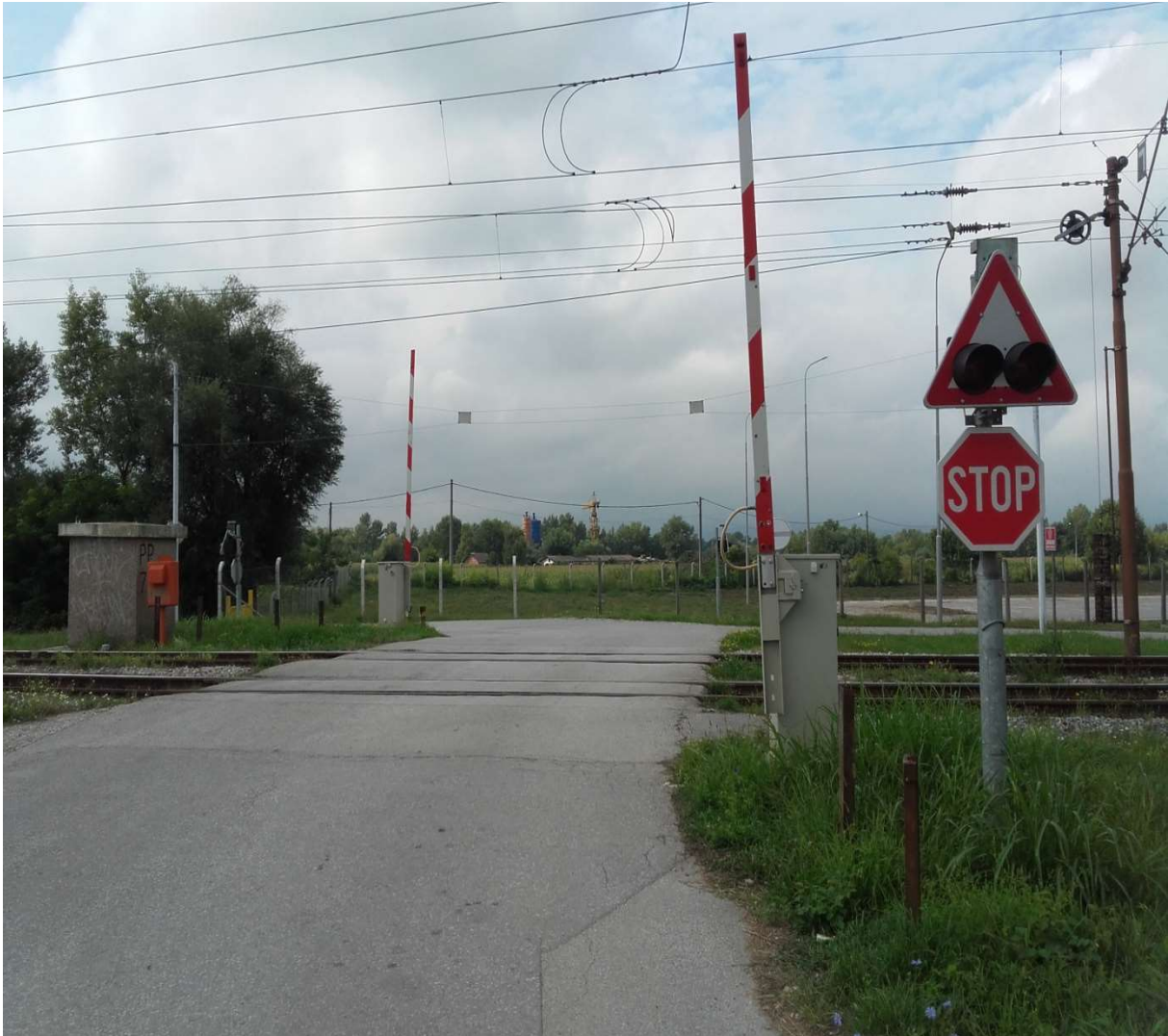
Slika 9. Željezničko – cestovni prijelaz broj 76

S obzirom da se prijelaz nalazi na dvokolosiječnoj pruzi aktivnost uključnih kontakata ne ovisi o smjeru. Prema tome na dvokolosiječnoj pruzi uvijek su aktivna oba uključna kontakata za vožnju po pravilnom i vožnju po nepravilnom kolosijeku.