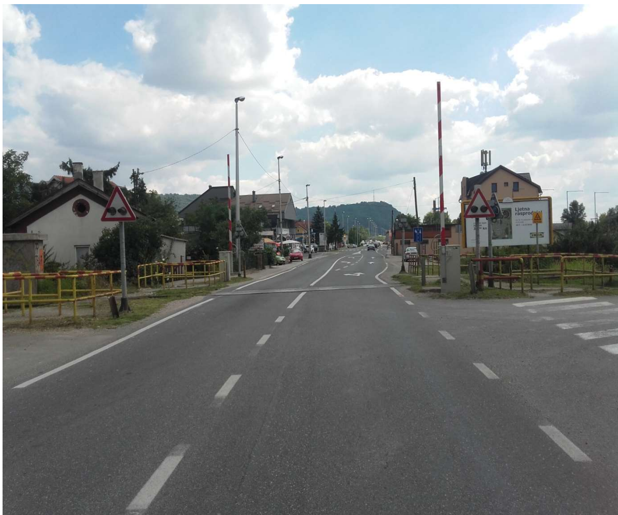
Slika 10. Željezničko – cestovni prijelaz broj 76 A