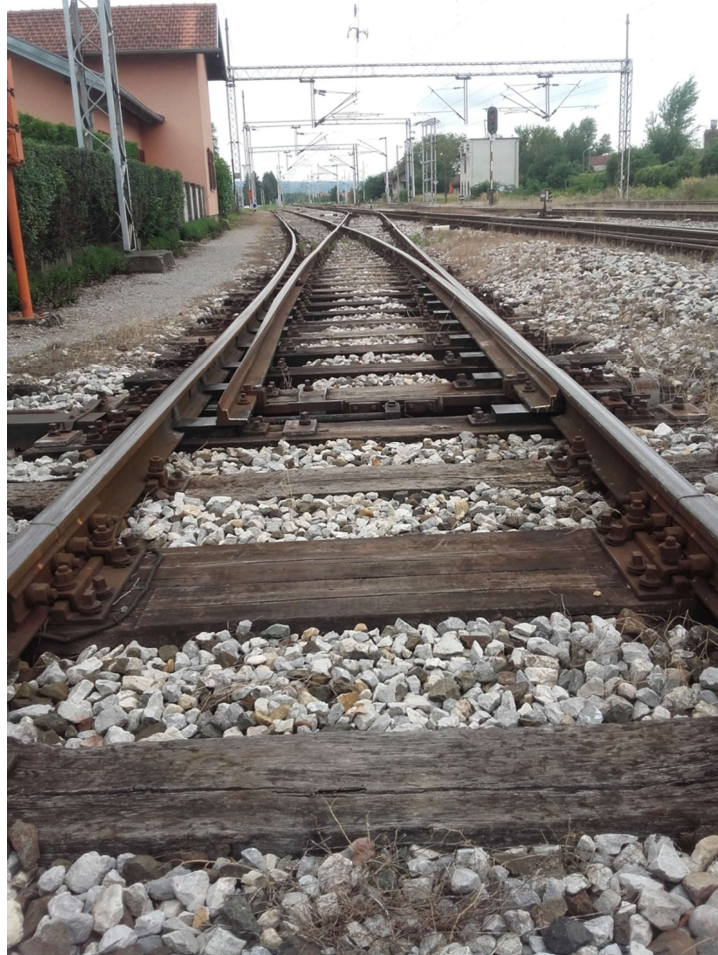
Slika 5. Skretnica broj 18 u kolodvoru Zaprešić

informaciju na komandni stol. U slučaju kvara postavne sprave moguće je ručno postavljanje skretnice pomoću pomoćne ručice koja je plombirana u prometnom uredu. Postavljanje skretnice traje oko 4 sekunde.