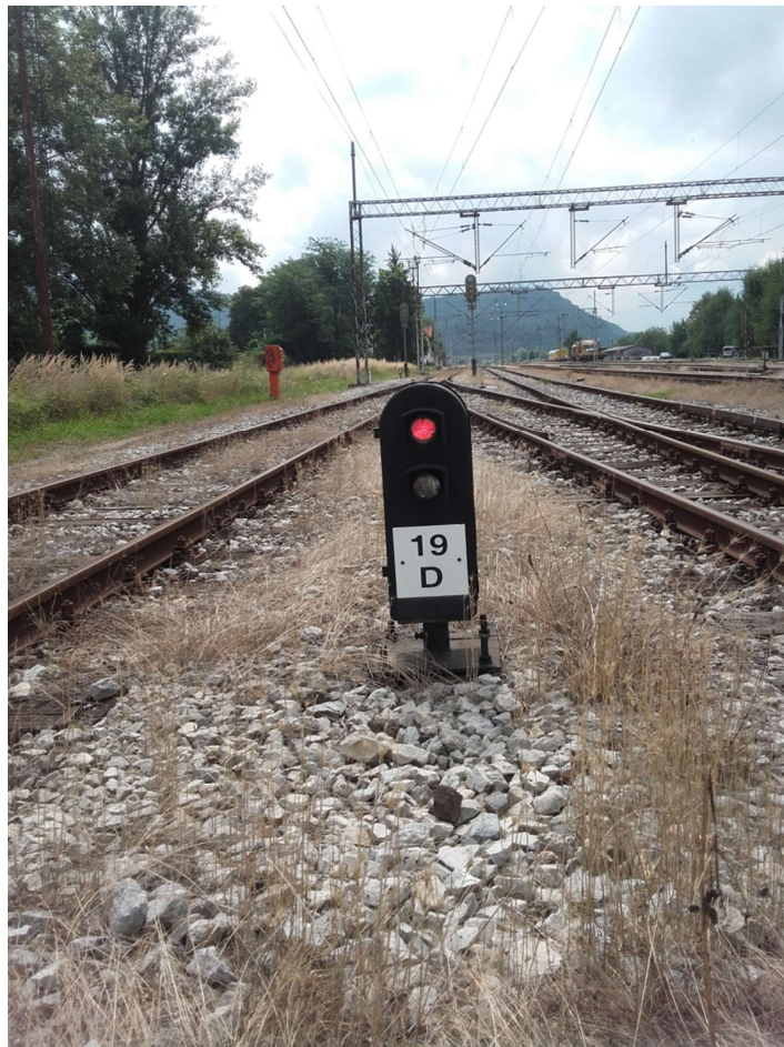
Slika 4. Manevarski signal u kolodvoru Zaprešić

Signal granice manevriranja prema kolodvoru Podsused Tvornica ugrađen je u km 438+680 uz desni kolosijek. Signal granice manevriranja prema kolodvoru S. Marof ugrađen je u km 439+975 uz lijevi kolosijek. Signal granice manevriranja prema kolodvoru N. Dvori ugrađen je u km 0+710 uz desnu stranu kolosijeka 8 .