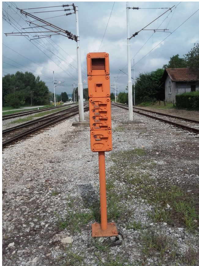
Slika 13. Interfon u kolodvoru Zaprešić

Zvučnici Z-1 i Z-2 pokrivaju lijevu stranu kolodvora, Z-3 desnu stranu. Razglasnim uređajem rukuje prometnik vlakova putem TK pulta. Na isti pult priključeno je i putničko ozvučenje koje služi za obavješćivanjeputnika. Zvučnici se nalaze u čekaonici te na vanjskom zidu kolodvorske zgrade.