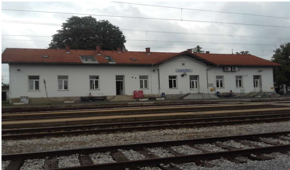
Slika 1. Kolodvorska zgrada u kolodvoru Zaprešić

Gledajući sa peronske strane u pročelju zgrade nalazi se prometni ured, čekaonica, ured putničke blagajne te ured šefa kolodvora. U zadnjem dijelu zgrade nalazi se relejna prostorija, telefonska centrala i akumulatorska prostorija. Kolodvoru Zaprešić podređena su službena mjesta Podsused stajalište i Zaprešić Savska. Kolodvor Zaprešić otvoren je za prijem i otpremu putnika, vagnskih pošiljaka i živih životinja.