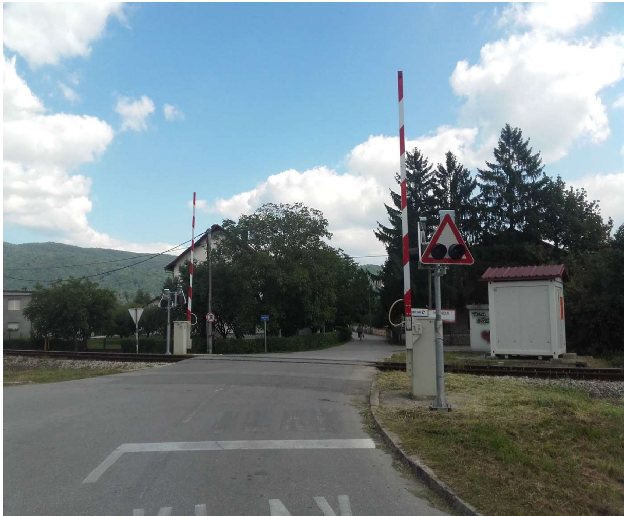
Slika 11. Željezničko – cestovni prijelaz broj 76 A1