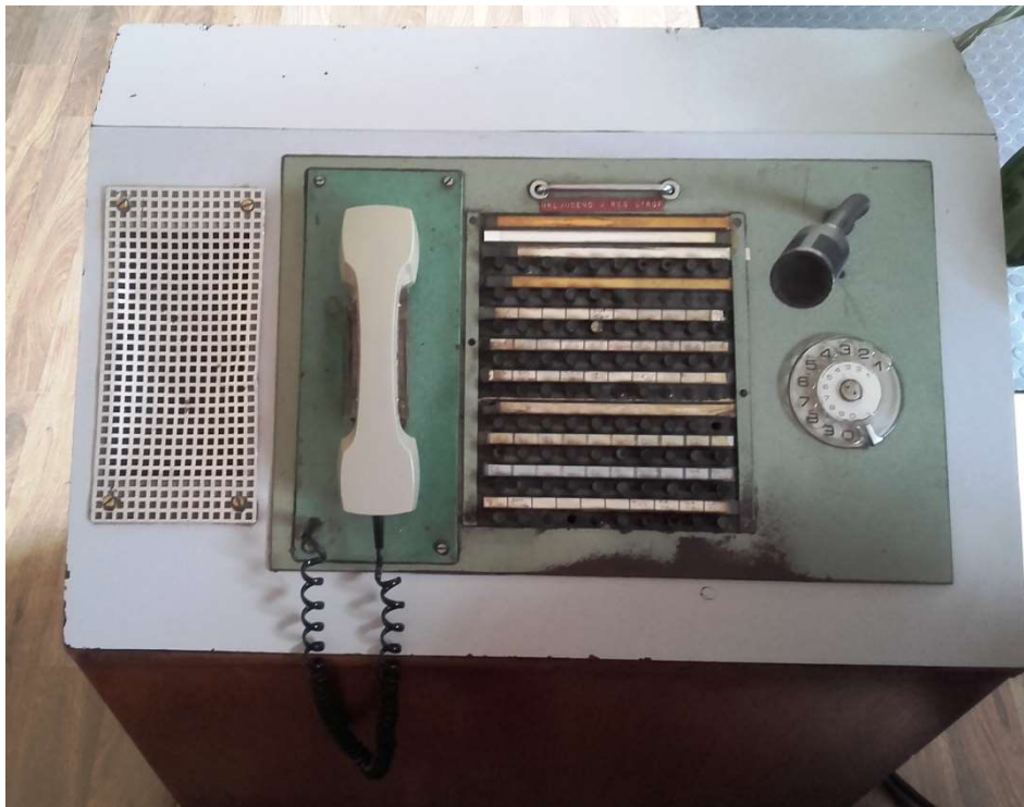
Slika 12. Telekomunikacijski pult u prometnom uredu kolodvora Zaprešić

Od radio uređaja kol Zaprešić posjeduje tri mobilna UKV uređaja tipa Motorola CP-140 te jedan stabilni Motorola GM 350 koji nisu uključeni u registrofon. Dva mobilna te jedan stabilni uređaj nalaze se u prometnom uredu, a još jedan mobilni koji služi kao rezerva, nalazi se u uredu šefa kolodvora.