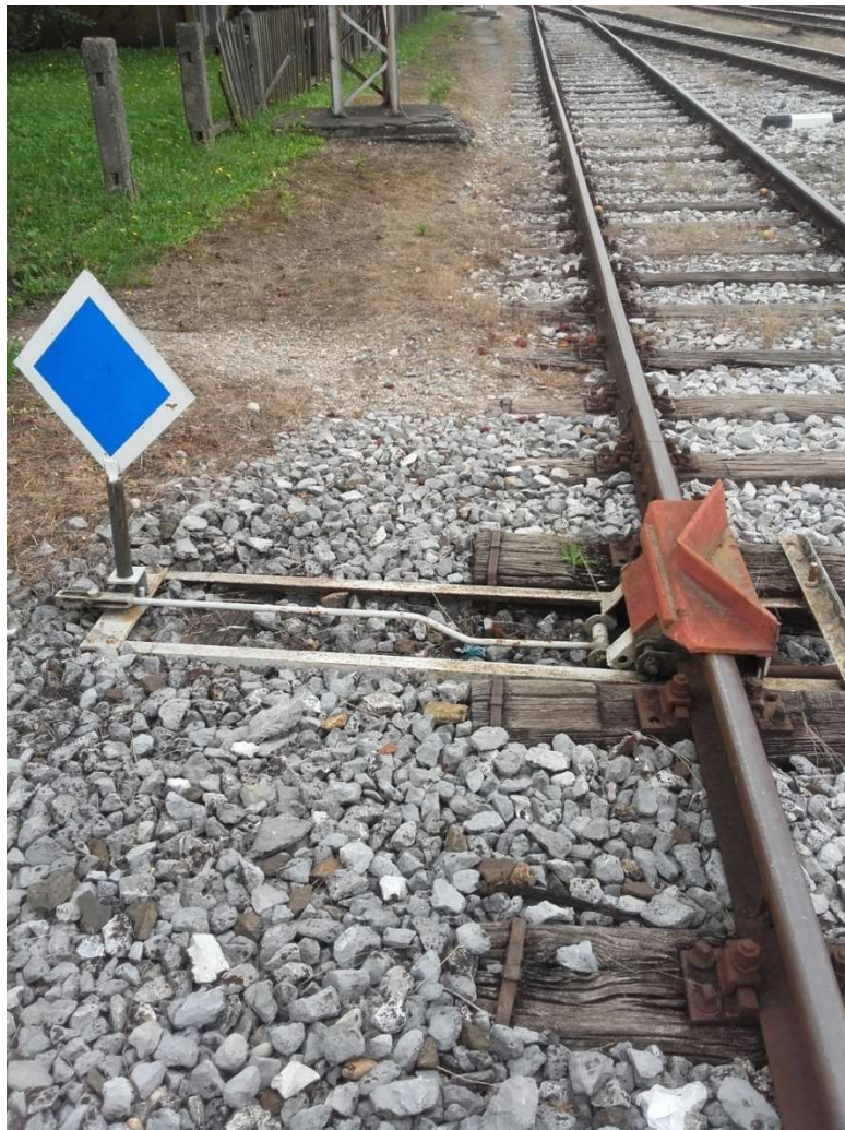
Slika 6. Iskliznica broj 5 u kolodvoru Zaprešić

U kolodvorskom području nalazi se 6 iskliznica. Postavljene su na kolosijecima gdje se mogu pojaviti slučajna pomicanja vagona i lokomotiva koji bi mogli ugroziti puteve vožnje.