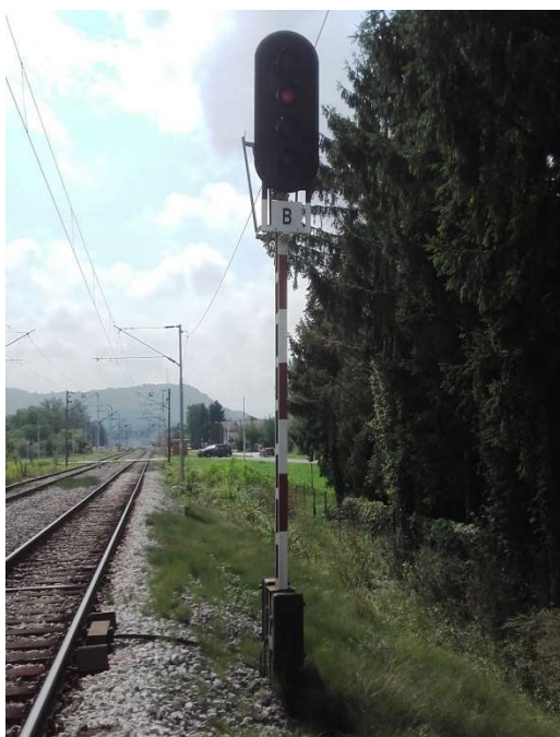
Slika 3. Ulazni signal „B“ u kolodvoru Zaprešić

Od strane Podsused Tvornica ulazni signal „A“ nalazi se u km 438+538, udaljen je od krajnje skretnice br. 7 za 449 m. Predsignal ulaznog signala „A“ nalazi se u km 437+514, udaljen od ulaznog signala „A“ 1024 m. Predsignal ujedno vrši funkciju prostornog signala 042. Između predsignala i ulaznog signala „A“ u km 438+186 ugrađen je ponavljač predsignaliziranja zbog smanjene vidljivosti ulaznog signala.