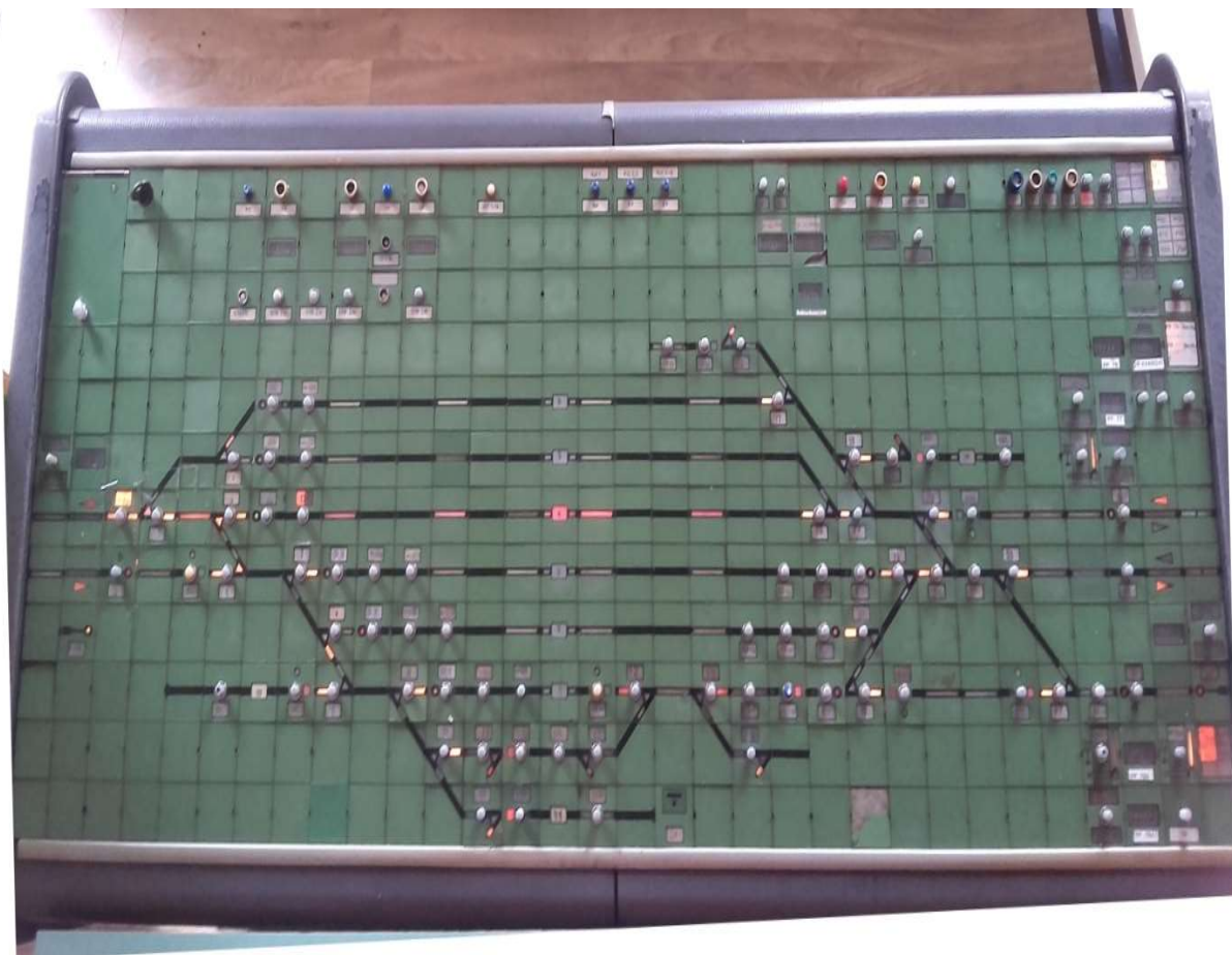
Slika 7. Postavni stol elektro-relejnog uređaja „SpDr Lorenz 30“ u prometnom uredu kolodvora Zaprešić