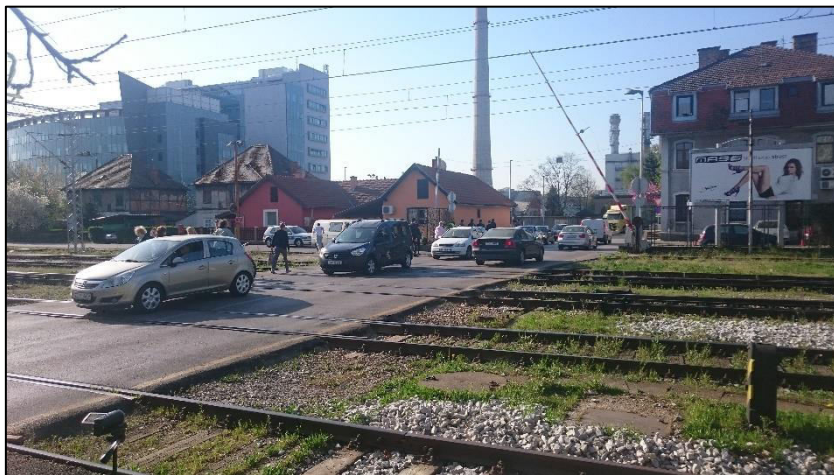
Slika 7. Željezničko-cestovni prijelaz osiguran punim branicima, Vodovodna ulica, Zagreb

Branik mora biti dobro obilježen. Stariji način obilježavanja je da se branik naizmjenično oboji naizmjenično crvenom i žutom bojom i označi s tri crvena reflektirajuća stakla, ravnomjerno raspoređena po cijeloj duljini branika. Noviji način obilježavanja je da se branik presvuče reflektirajućim slojem po cijeloj duljini na sredini ima trepćuću signalnu svjetiljku.