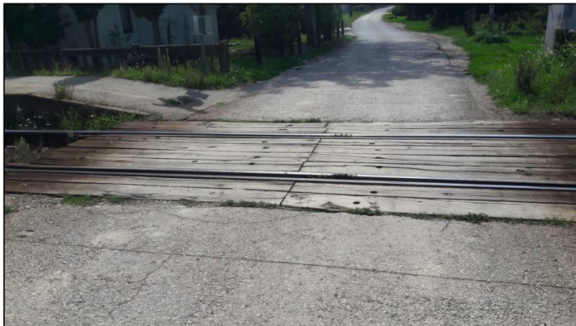
Slika 24. Prikaz podloge na željezničko-cestovnom prijelazu „Širinec“

Podloga na željezničko-cestovnom prijelazu izrađena je od jednodjelnih drvenih pragova (Slika 24.).