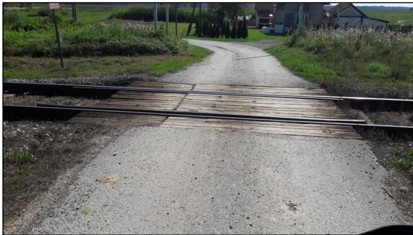
Slika 18. Prikaz stanja pragova na željezničko-cestovnom prijelazu „Deanovec 1“

Karakterizira ga dobra preglednost sa svih strana, zbog toga što se prometnica i željeznička pruga križaju pod pravim kutem. Ovo je prijelaz preko dva kolosijeka od kojih na jednom ne prometuju željeznička vozila i vlakovi. Kolnik koji se tamo nalazi je preuzak i trebalo bi ga proširiti na duljinu jednaku podlozi na prijelazu. Prometnica prema prijelazu je s obje strane u usponu, pa je radi toga otežano kretanje sporih poljoprivrednih vozila koja onuda prometuju. Ovaj željezničko-cestovni prijelazi koji se nalazi na nekadašnjem X paneuropskom koridoru ima i stupove za kontrolu visine vozila zbog postojanja kontaktne mreže. Sa željezničko-cestovnim prijelazom se rukuje sa postavnom upravom iz prometnog ureda u kolodvoru Deanovec koji ima sustav osiguranja INTEGRA DOMINO. Sa postavnom upravom se rukuje na isti način kao u kolodvoru Ivanić-Grad.