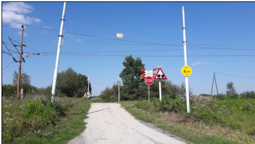
Slika 16. Željezničko-cestovni prijelaz „Deanovec I“ iz smjera juga

Na ovom prijelazu prometnica prelazi preko dva kolosijeka, od kojih jedan, prema postojećem stanju, već dugo nije bio u upotrebi (Slika 17.). Obje podloge kolosijeka na željezničko-cestovnom prijelazu izrađene su od dvodjelnih drvenih pragova (Slika 17. i 18.).