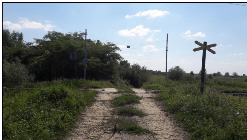
Slika 19. Željezničko-cestovni prijelaz „Deanovec“ iz smjera sjevera

Željezničko-cestovni prijelaz „Deanovec“ nalazi se na 60+580 kilometru, na nerazvrstanoj cesti u selu Deanovec i osiguran je prometnim znakom „Andrijinim križem“ iz smjera sjevera, a iz smjera juga prometnim znakom „Andrijin križ“ i znakom „Stop“ (Slika 19. i 20.).