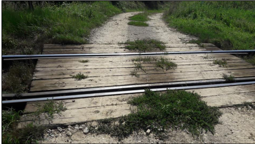
Slika 21. Prikaz podloge na željezničko-cestovnom prijelazu "Deanovec"

Na ovom prijelazu prometnica i željeznička pruga se križaju pod pravim kutem, stoga je preglednost vrlo dobra. Prometnica prema prijelazu je s obje strane je u usponu, pa je radi toga otežano kretanje sporih poljoprivrednih vozila koji su najčešći korisnici ovog prijelaza. N tom željezničko-cestovnom prijelazu koji se nalazi na nekadašnjem X paneuropskom koridoru postavljeni su i stupovi za kontrolu visine vozila zbog postojanja kontaktne mreže.