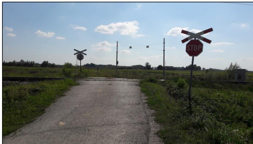
Slika 12. Željezničko-cestovni prijelaz „Caginec“ iz smjera sjevera

Željezničko-cestovni prijelaz „Caginec“ nalazi se na 63+939 kilometru, na nerazvrstanoj cesti u selu Caginec i osiguran je prometnim znakom „Stop“ i „Andrijinim križem“ (Slika 12. i 13.).