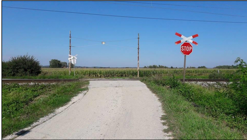
Slika 13. Željezničko-cestovni prijelaz „Caginec“ iz smjera juga

Podloga na željezničko-cestovnom prijelazu izrađena je od dvodjelnih drvenih pragova (Slika 14.).