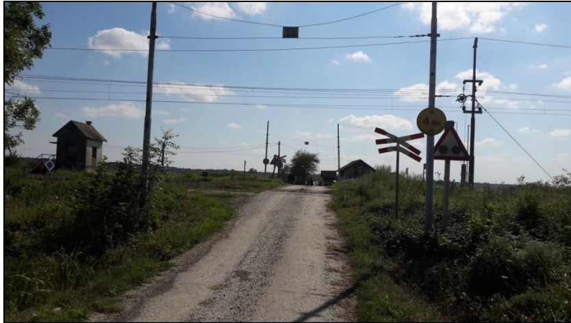
Slika 15. Željezničko-cestovni prijelaz „Deanovec I“ iz smjera sjevera