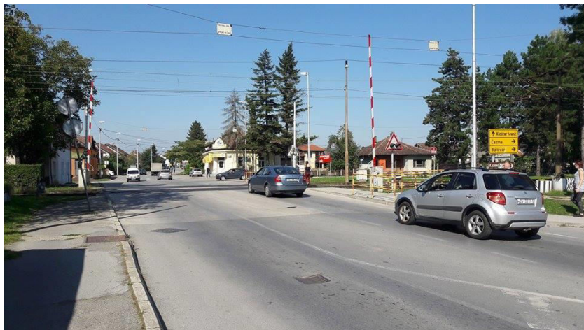
Slika 10. Željezničko-cestovni prijelaz „Vulinčeva ulica“ iz smjera juga

Podloga na željezničko-cestovnom prijelazu izrađena je od gumiranih ploča (Slika 11.).