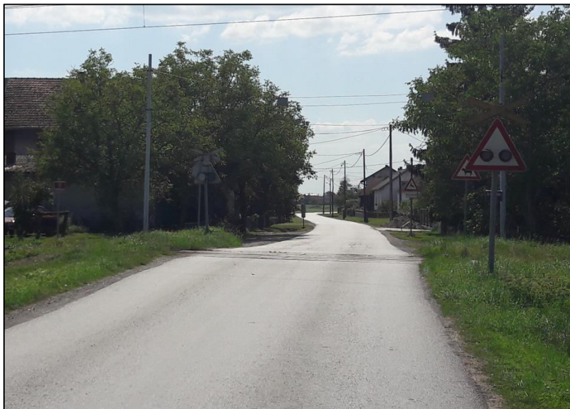
Slika 5. Željezničko-cestovni prijelaz osiguran sa svjetlosno-zvučnom signalizacijom i "Andrijinim križem", Okešinac