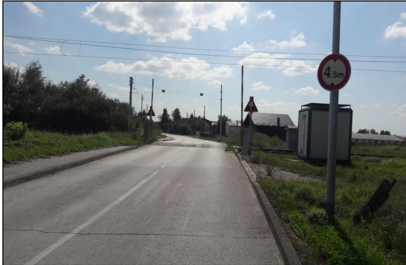
Slika 6. Željezničko-cestovni prijelaz osiguran sa svjetlosno-zvučnom signalizacijom i polubranicama , Križ