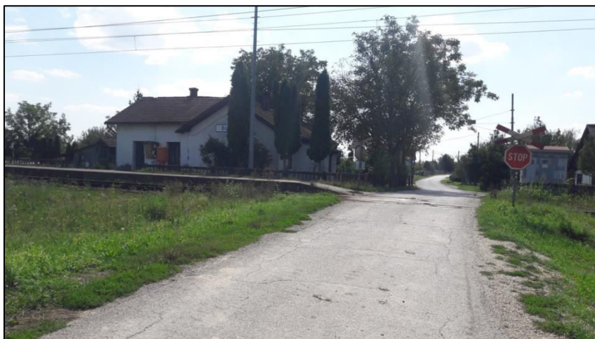
Slika 22. Željezničko-cestovni prijelaz „Širinec“ iz smjera sjevera

Željezničko-cestovni prijelaz „Širinec“ nalazi se 58+287 kilometru, na nerazvrstanoj cesti u selu Širinec i osiguran je prometnim znakom „Stop“ i „Andrijinim križem“ (Slika 22.i 23.).