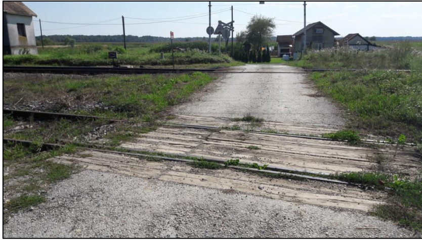
Slika 17. Prikaz stanja pragova na željezničko-cestovnom prijelazu „Deanovec 1“