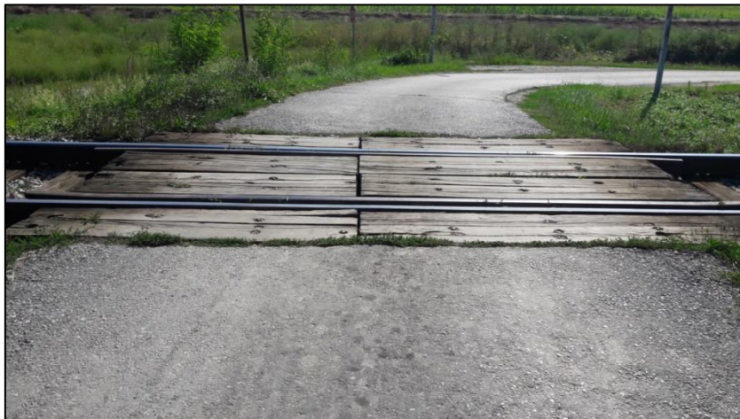
Slika 14. Prikaz stanja pragova na željezničko-cestovnom prijelazu „Caginec“

Podloga na željezničko-cestovnom prijelazu izrađena je od dvodjelnih drvenih pragova (Slika 14.).