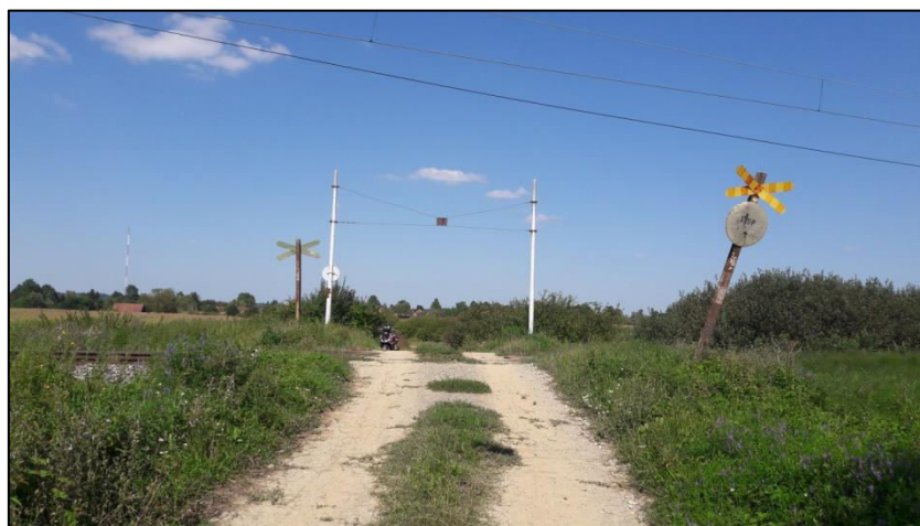
Slika 20. Željezničko cestovni prijelaz „Deanovec“ iz smjera juga

Karakterizira ga dobra preglednost. Podloga na željezničko-cestovnom prijelazu izrađena je od jednodjelnih drvenih pragova (Slika 21.).