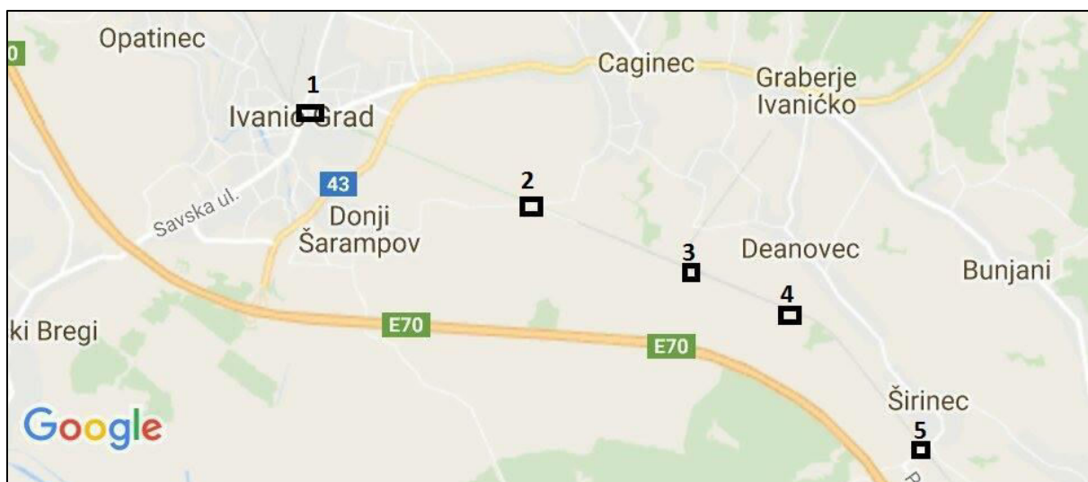
Slika 8. Položaj željezničko-cestovnih prijelaza od Ivanić-Grada do Širinca

Na zadanoj dionici od Ivanić-Grada do Širinca nalazi se pet željezničko-cestovnih prijelaza koji su prikazani na Slici 8.