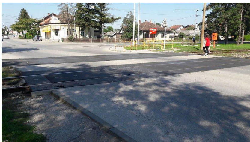
Slika 11. Prikaz stanja gumiranih ploča na željezničko-cestovnom prijelazu „Vulinčeva ulica“

Podloga na željezničko-cestovnom prijelazu izrađena je od gumiranih ploča (Slika 11.).