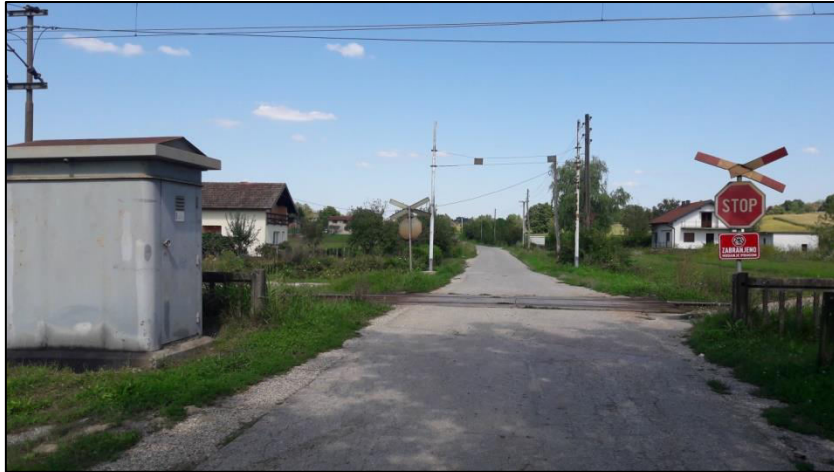
Slika 23. Željezničko-cestovni prijelaz „Širinec“ iz smjera juga

Podloga na željezničko-cestovnom prijelazu izrađena je od jednodjelnih drvenih pragova (Slika 24.).