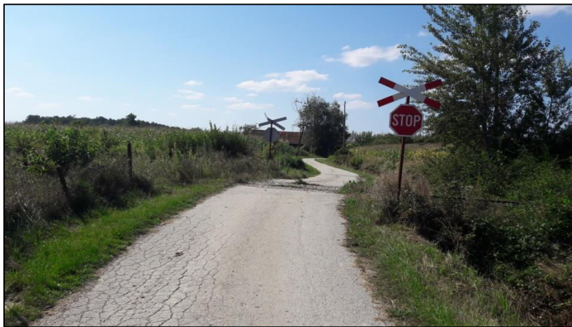
Slika 1. Pasivno osiguran željezničko-cestovni prijelaz, Derežani

Svi željezničko-cestovni prijelazi i pješački prijelazi preko pruge u Republici Hrvatskoj obilježeni su primjerenim tehničkim osiguranjem, a najnižom razinom osiguranja smatra se pasivno osiguranje, što u Republici Hrvatskoj predstavlja upotreba prometnih znakova „Andrijin križ“ i „Stop“ uz upotrebu propisanog trokuta preglednosti. Kod pasivnog osiguranja nema promjene stanja sustava osiguranja. Kod tako osiguranih prijelaza vozač cestovnog vozila je sam odgovoran za promatranje željezničke pruge i procjenu nailaska vlaka [5]. Slika 1. prikazuje primjer pasivno osiguranog željezničko-cestovnog prijelaza u Derežanima.