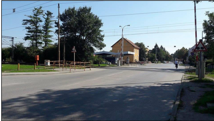
Slika 9. Željezničko-cestovni prijelaz „Vulinčeva ulica“ iz smjera sjevera