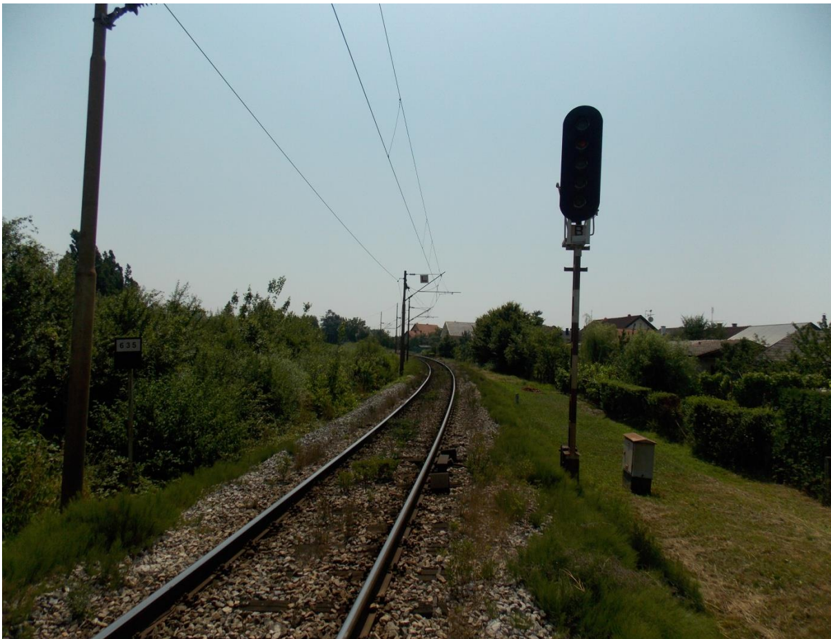
Slika 5. Ulazni signal „B“ iz smjera Zagreba

Kolodvor Ivanić Grad osiguran je ulaznim signalom „A“ iz smjera Novska i ulaznim signalom „B“ iz smjera Zagreba. Prvi prostorni signal broja 382 ispred ulaznog signala „A“ i prvi prostorni signal broja 391 ispred ulaznog signala „B“ imaju funkciju predsignala za taj ulazni signal.