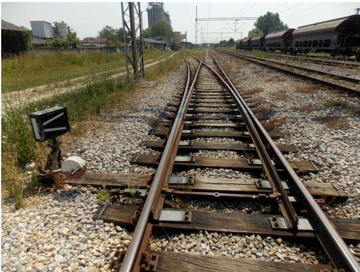
Slika 4. Skretnica pod rednim brojem 1S osigurana skretničkom bravom

Skretnica pod brojem 1S osigurana je skretničkom bravom u položaj u pravac i u ovisnosti je sa iskliznicom I1 na industrijskom kolosijeku „Agroprerada“. Ključ iskliznice I1 čuva prometnik vlakova.