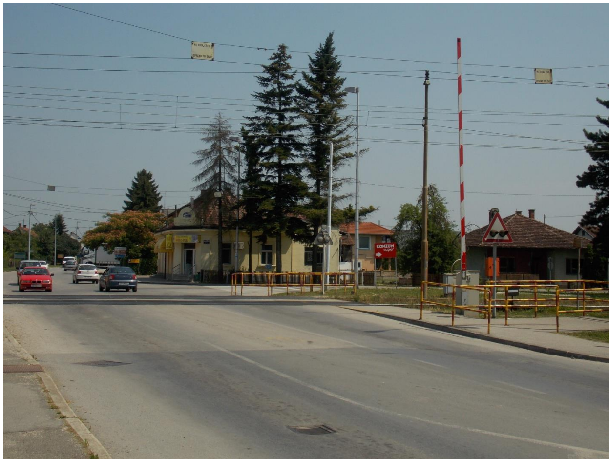
Slika 3. Željezničko – cestovni prijelaz u kolodvoru Ivanić Grad

Na pruzi između kolodvora Ivanić Grad – Prečec nalaze se četiri cestovna prijelaza. Prvi i treći imaju rang ceste – „poljski put“, prvi se nalazi u km 68+768, a treći u km 72+835. Drugi i četvrti imaju rang ceste – „seoska cesta“, drugi se nalazi u km 71+602, a četvrti u km 73+849. Prvi, drugi i treći prijelaz osigurani su prometnim znakovima cestovnog prometa, a četvrti prijelaz opremljen je automatskim SS uređajem za osiguranje željezničko – cestovnog prijelaza.