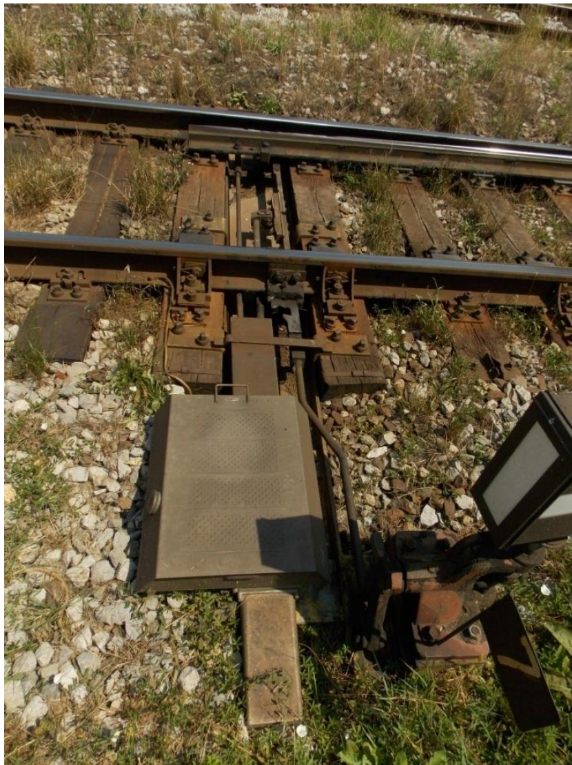
Slika 6. Skretnica pod rednim brojem 7 osigurana elektro – hidrauličnom postavnom spravom tipa L 650H

ključem za elektro – mehaničke sprave tipa Ei 700, a pomoćne ručice i ključevi moraju biti plombirani u prometnom uredu kolodvora. 19