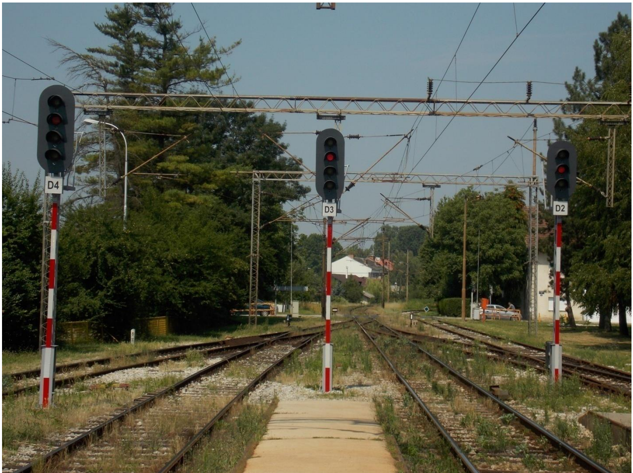
Slika 7. Izlazni signali D2, D3 i D4 u smjeru prema kolodvoru Prečec

Za postavljanja izlaznog voznog puta prema Deanovcu potrebno je pritisnuti tipku I od strane Deanovca i tipku kolosijeka sa kojega se postavlja izlazni vozni put. Prilikom postavljanja izlaznog voznog puta prema Prečecu potrebno je uključiti uređaj željezničko – cestovnog prijelaza i također pritisnuti tipku „I“, ali sa strane Prečeca i tipku kolosijeka sa kojeg se postavlja izlazni vozni put.