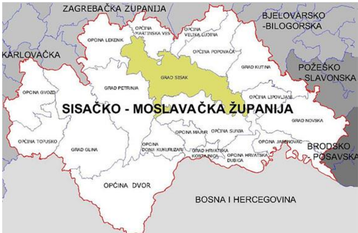
Slika 1. Položaj Sisačko-moslavačke županije, [5]

Na slici 1 prikazan je položaj Sisačko-moslavačke županije zajedno sa gradovima i općinama koje ju čine.