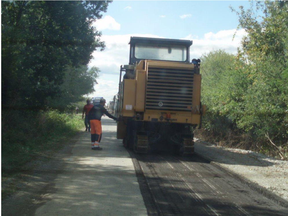
Slika 4. Obnova kolničkog zastora

Ovisno o svojim značajkama, radovi održavanja razvrstavaju se u sljedeće osnovne skupine [17]: