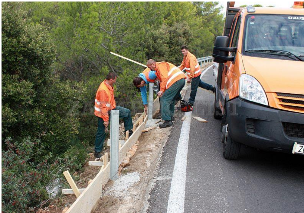
Slika 3. Prikaz popravka oštećene zaštitne ograde, [22]

Oštećene ograde (zaštitne, žičane, pješačke i dr.), treba popraviti najkasnije u roku od deset dana po uočenom oštećenju (slika 3). Uništene ograde i smjerokazne stupiće treba zamijeniti odmah. Ograde i smjerokazne stupiće treba čistiti i ispravljati stalno, a osobito poslije zimskog razdoblja. Zaštitne i druge ograde treba ličiti prema potrebi [17].