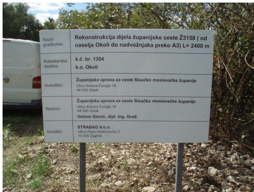
Slika 6. Rekonstrukcija županijske ceste Ž3158, proširenje kolnika