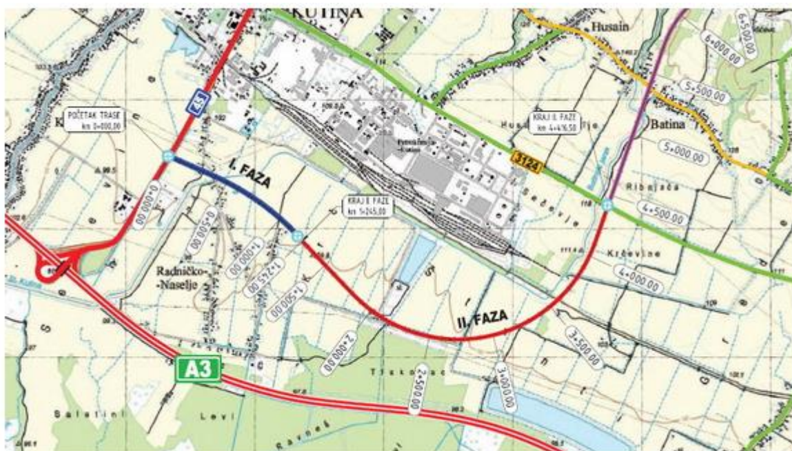
Slika 5. Južna obilaznica oko grada Kutine, [24]

Kako bi se poboljšala mreža državnih cesta potrebno je napraviti prekategoriizaciju županijske ceste 3124 u državnu cestu. Prekategoriizacijom te ceste oslobodio bi se određeni dio novca namijenjen za održavanje županijskih cesta te bi se taj novac uložio u održavanje županijskih i lokalnih cesta. Boljem protoku vozila te smanjenju gustoće prometa u gradu pridonijela bi izgradnja južne obilaznice oko grada Kutine koja bi sav tranzitni promet usmjerila izvan grada (slika 5).