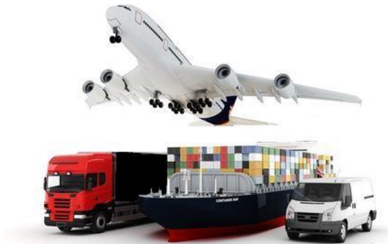
Slika 1. Intermodalni prijevoz