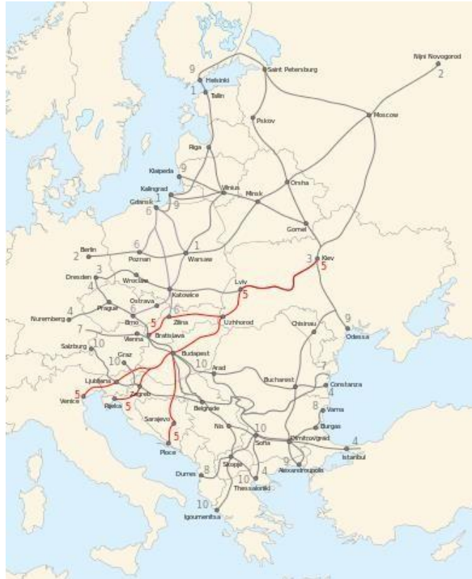
Slika 4. V. koridor - označen crvenom bojom I