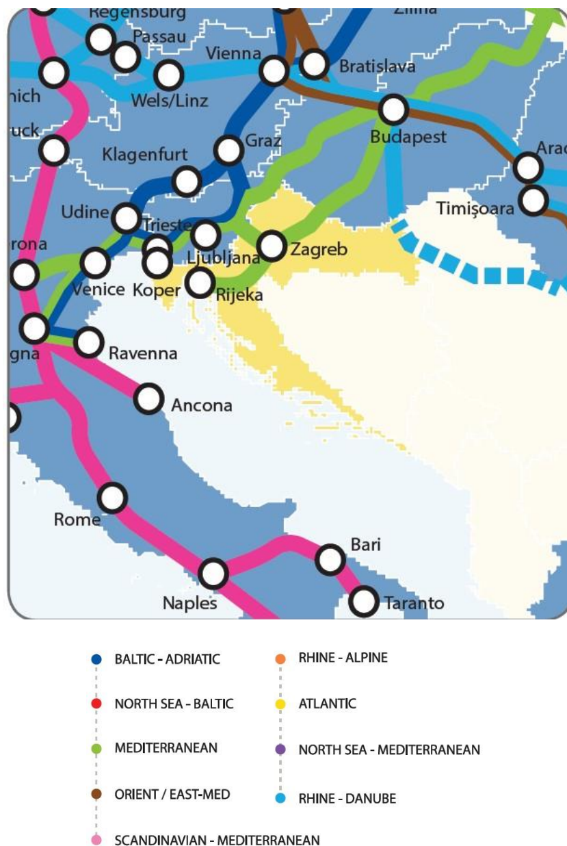
Slika 6. 2 koridora središnje mreže koji prolaze kroz Hrvatsku