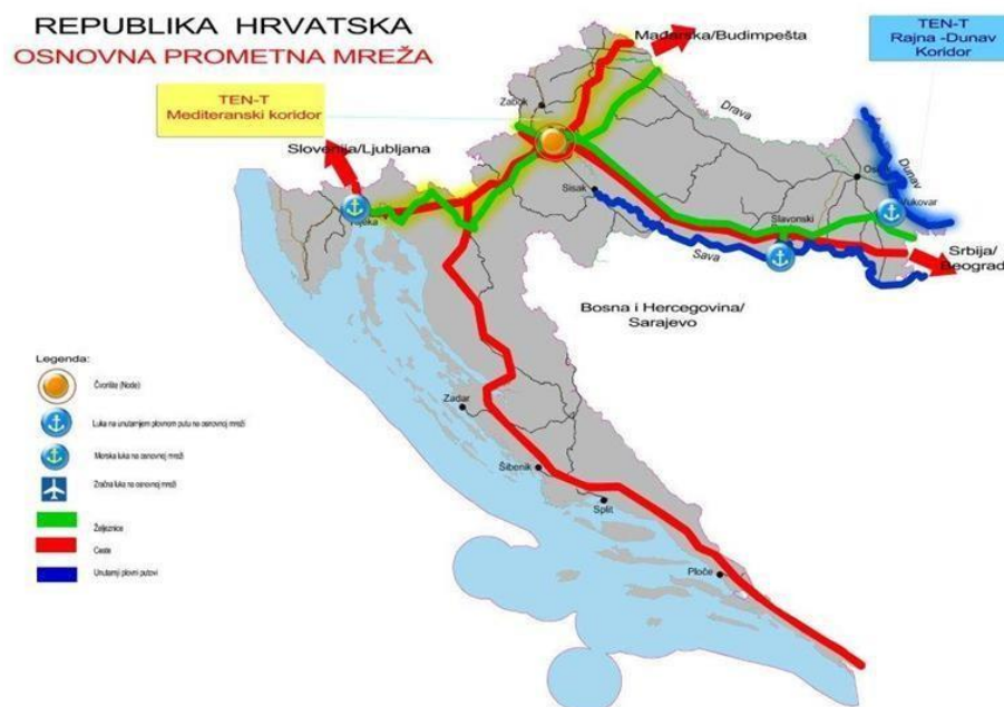
Slika 2. Osnovna prometna mreža RH