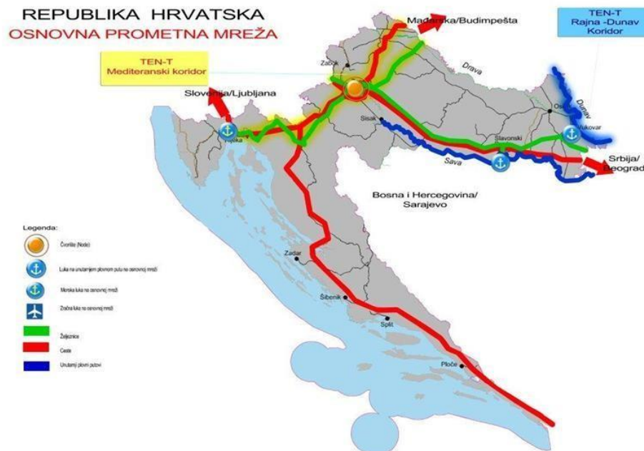
Slika 2. Osnovna prometna mreža RH