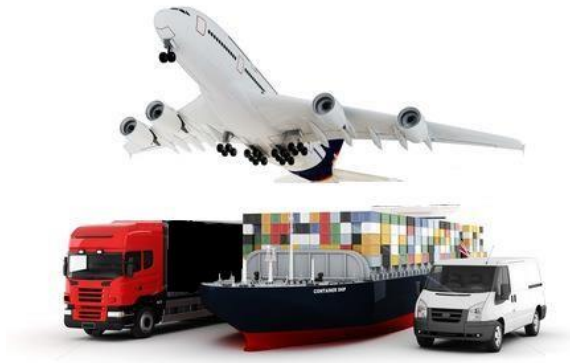
Slika 1. Intermodalni prijevoz