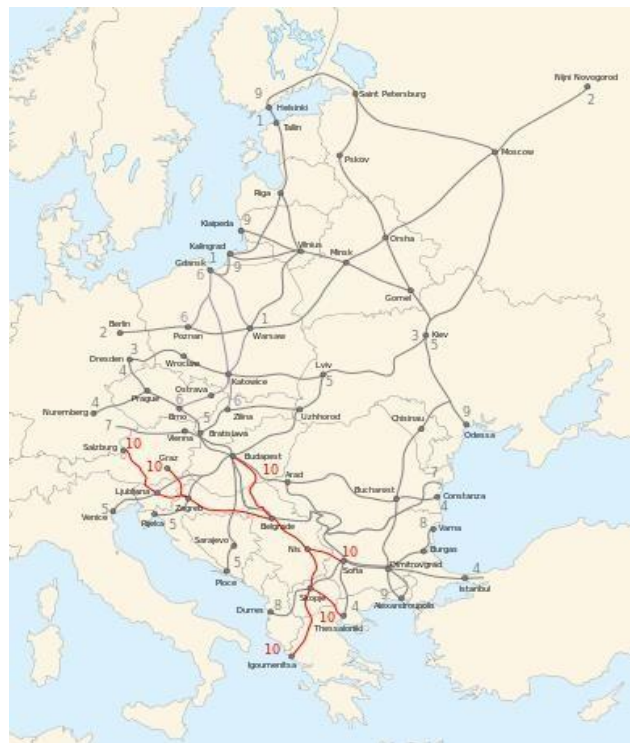
Slika 5. X. koridor - označen crvenom bojom