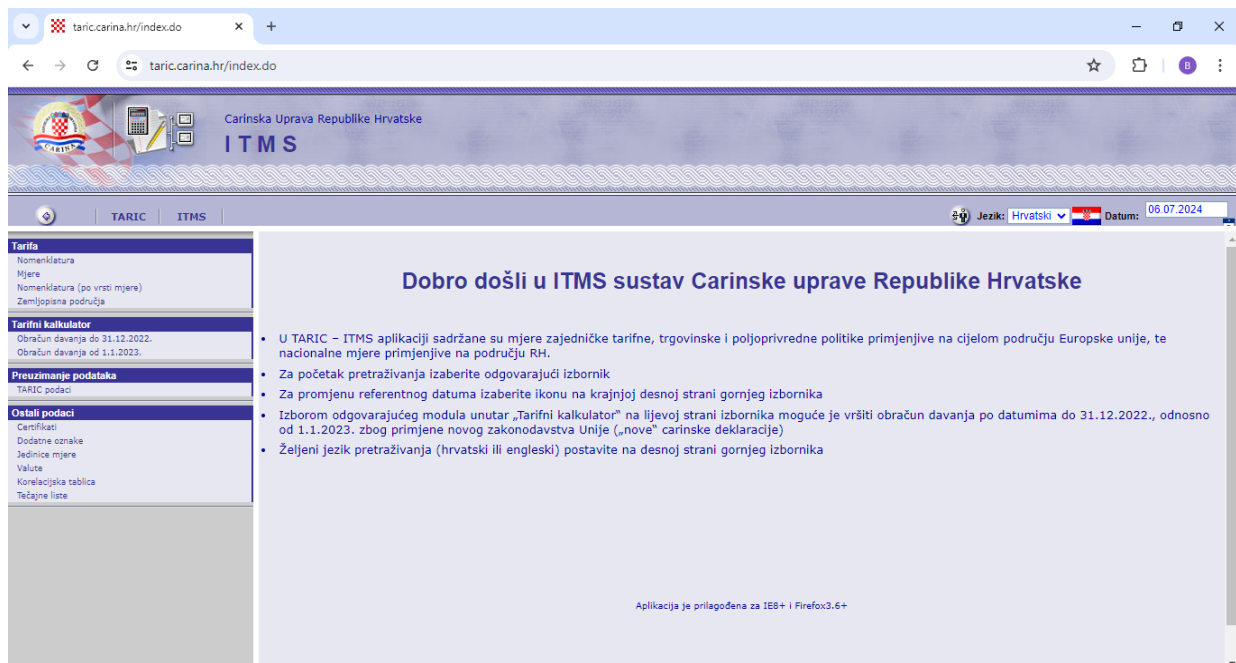
Slika 1. Prikaz nacionalnog TARIC ITMS-a

TARIC integrirani sustav upravljanja tarifama ili akronimom nazvan TARIC ITMS je aplikacija ili informacijski sustav koji integrira podatke iz TARIC-a, te sadrži sve mjere zajedničke tarifne, trgovinske i poljoprivredne politike. Svaka država članica Europske unije ima svoju nacionalnu verziju TARIC-a koja uz navedene osnovne podatke iz zajedničkog TARIC-a, također ima i dodatne nacionalne propise dotične države članice Europske unije. Izgled nacionalne TARIC ITMS aplikacije je prikazan na slici 1, a za primjer je uzeta Republika Hrvatska, koja je članica Europske unije od 2013. godine [9].