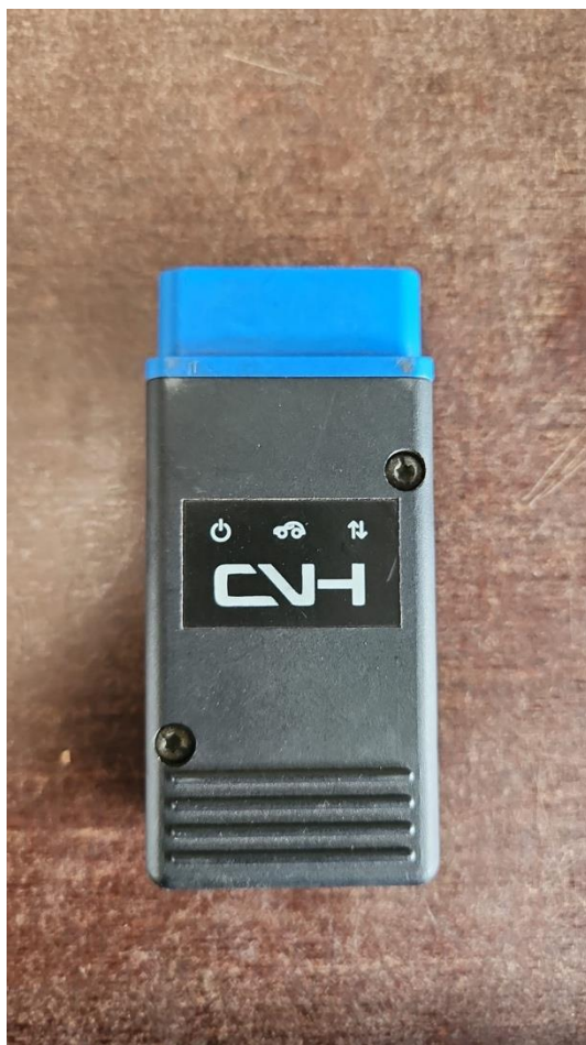
Slika 3. PEMS (Prijenosni sustav za mjerenje emisija)

Uređaj na slici 3 je dio prijenosnog sustava za mjerenje emisija (PEMS). PEMS se koristi za mjerenje emisija vozila u stvarnim uvjetima vožnje. Ovaj specifični uređaj montira se na vozilo i prikuplja podatke o emisijama tijekom različitih vozačkih režima, uključujući vožnju po gradskim, prigradskim i autocestovnim cestama. PEMS je ključan alat za precizno mjerenje stvarnih emisija, omogućujući usporedbu s laboratorijskim testovima i osiguravajući da vozila zadovoljavaju ekološke standarde.