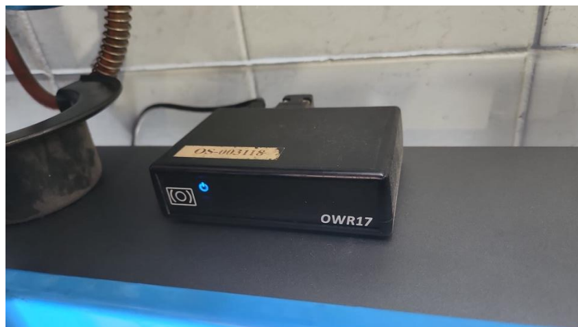
Slika 2. OBD-II skener

[39]. Ova tehnologija ima potencijal da dodatno smanji vrijeme potrebno za popravak i održavanje vozila te poveća sigurnost i učinkovitost vozila na cestama. OBD sustav tako predstavlja korak naprijed u tehnologiji vozila, pružajući neprekidan nadzor i održavanje optimalne učinkovitosti te usklađenosti vozila s ekološkim standardima [39].