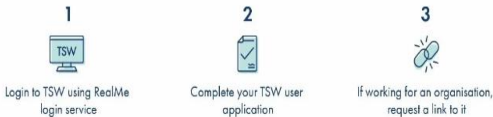
Slika 3. Tri osnovna koraka pri prijavi na TSW [45]

Kako bi postali korisnici TSW-a, subjekti moraju slijediti tri osnovna koraka (slika 3):