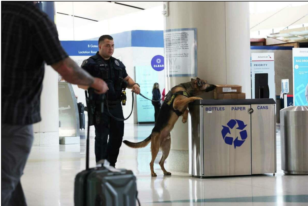
Slika 9. Tim za otkrivanje eksploziva