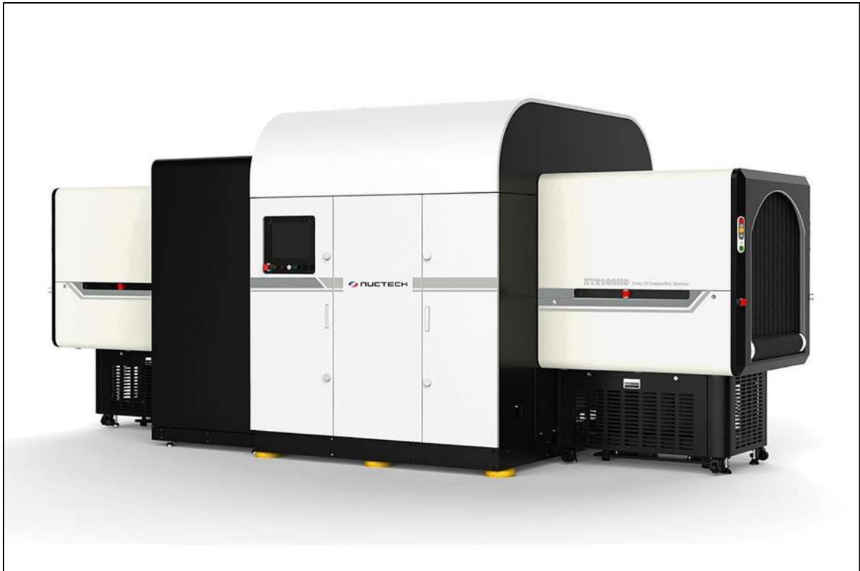
Slika 2. Primjer sustava za detekciju eksploziva