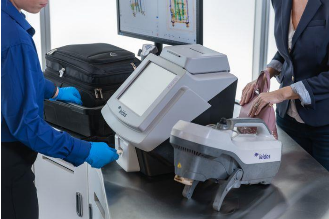
Slika 8. Primjer ETD sustava – EXPO B220-HT