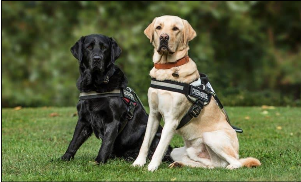
Slika 13. Labradori