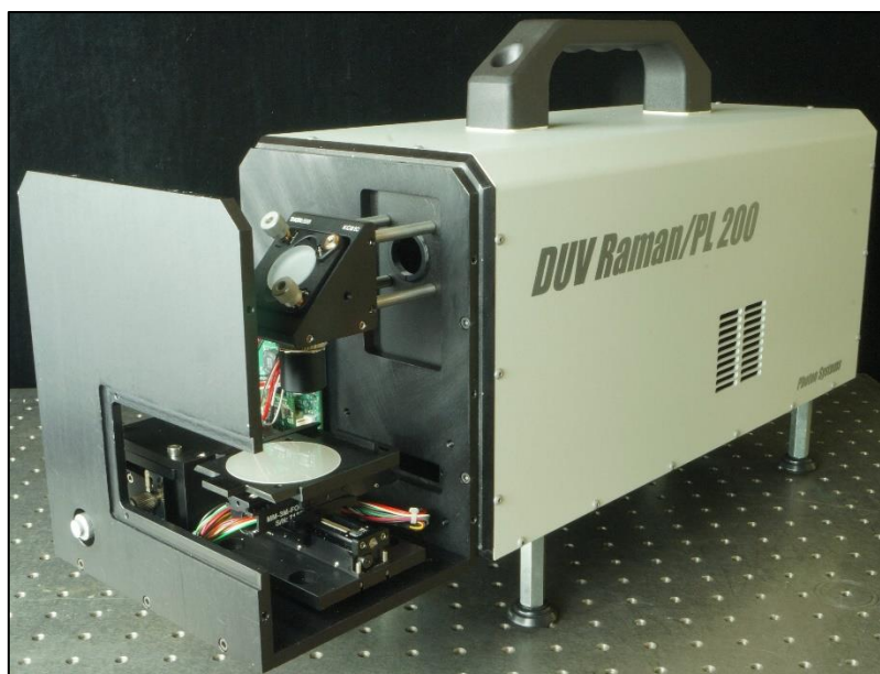
Slika 6. Primjer ETD sustava koji radi na principu Ramanove spektroskopije