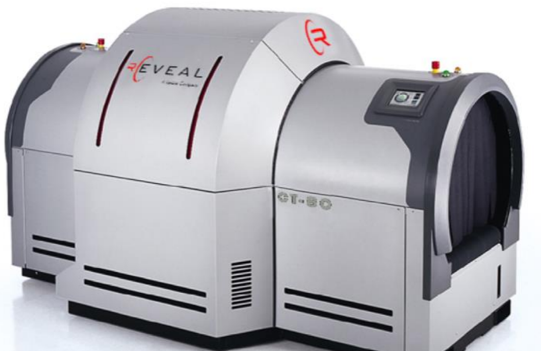
Slika 4. Primjer sustava za detekciju eksploziva – Reveal CT-80DR+