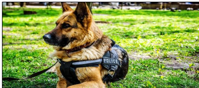
Slika 11. Njemački ovčar

Njemački ovčari (slika 11.) su energični, neustrašivi i lojalni, posebno se uzgajaju za vojne i policijske poslove. Njemački ovčar tradicionalno je bio pasmina izbora zbog svoje duge povijesti razvoja radne sposobnosti [25].