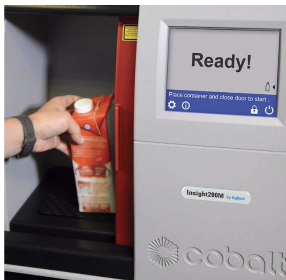
Slika 15. CobaltInsight200M