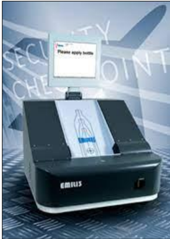
Slika 17. Emili 3