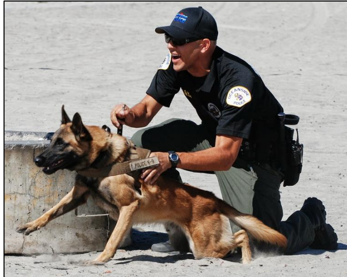
Slika 10. Belgijski ovčar