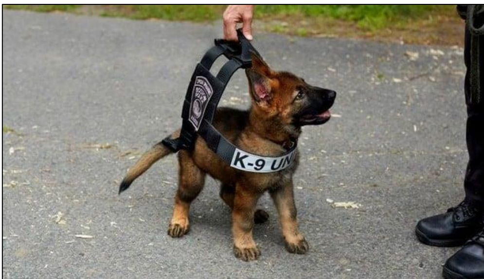
Slika 14. Primjer obuke mladog ovčara