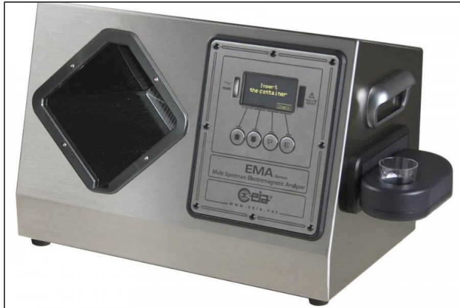
Slika 16. Ema-3