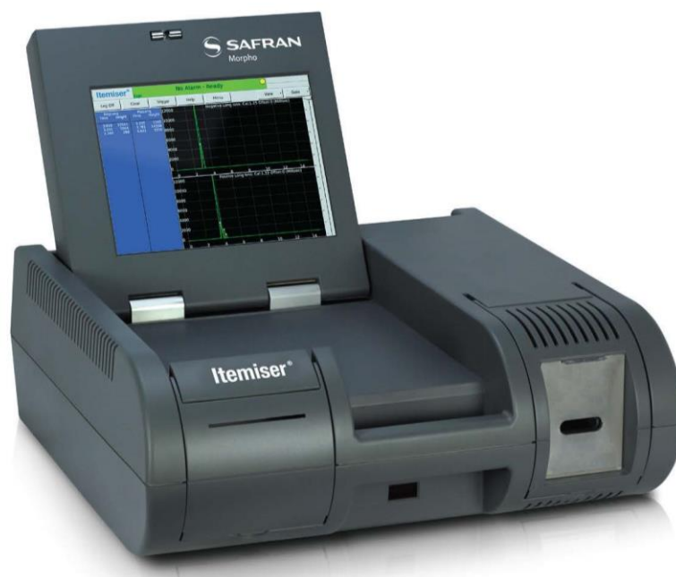
Slika 7. Primjer ETD sustava – TSA Itemiser® DX

Na slici 7. prikazan je primjer opreme za otkrivanje tragova eksploziva TSA Itemiser® DX, a na slici 8. prikazan je primjer opreme za otkrivanje tragova eksploziva EXPO B220-HT.