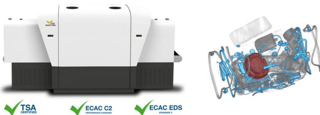
Slika 5. Primjer sustava za detekciju eksploziva – Hyper-Tech IDSS DETECT™ 1000