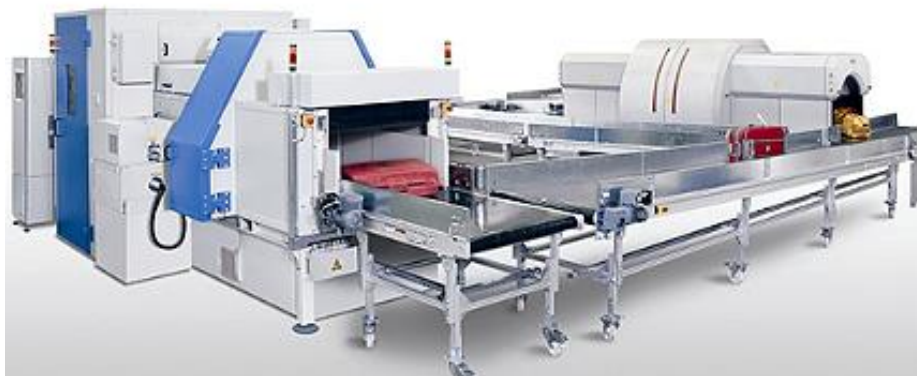
Slika 3. Primjer sustava za detekciju eksploziva – XRD 3500