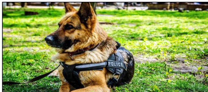
Slika 11. Njemački ovčar

Njemački ovčari (slika 11.) su energični, neustrašivi i lojalni, posebno se uzgajaju za vojne i policijske poslove. Njemački ovčar tradicionalno je bio pasmina izbora zbog svoje duge povijesti razvoja radne sposobnosti [25].