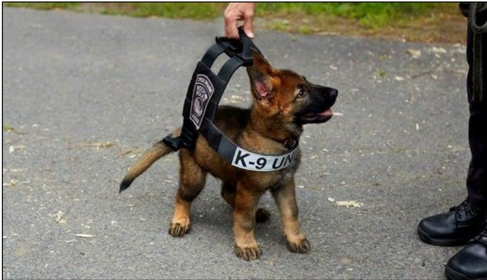
Slika 14. Primjer obuke mladog ovčara