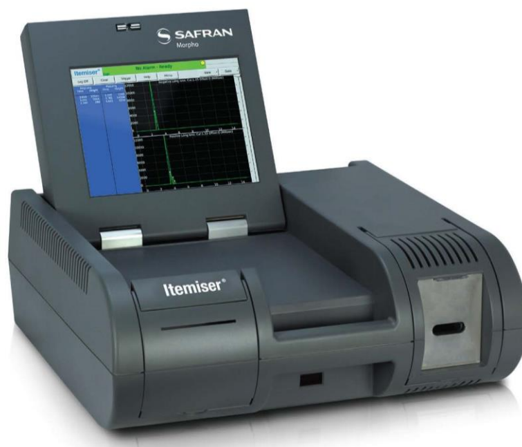
Slika 7. Primjer ETD sustava – TSA Itemiser® DX

Na slici 7. prikazan je primjer opreme za otkrivanje tragova eksploziva TSA Itemiser® DX, a na slici 8. prikazan je primjer opreme za otkrivanje tragova eksploziva EXPO B220-HT.