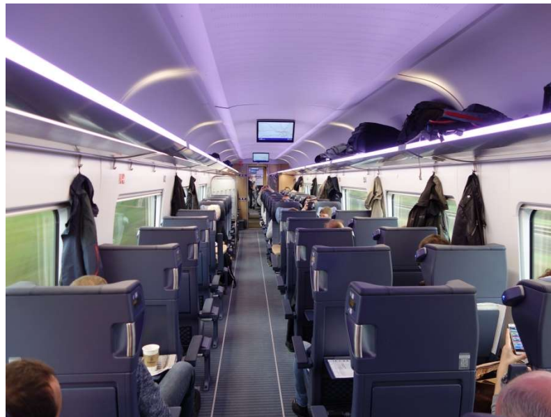
Slika 31. ICE 4 interijer, prva klasa[45]

Nova sjedala u ICE 4 vlakovima imaju naslone koji se pri podešavanju ne pomiču unatrag, već ulaze u okvir sjedala i tako ne smetaju osobi koja sjedi iza. ICE 4 nudi i veliki prostor za pohranu: široke police za prtljagu u svakom vagonu pružaju dovoljno prostora za pohranu i omogućuju spremanje velike i teške prtljage, čak i u razini poda. Osim toga, ICE 4 ima i četiri mjesta za invalidska kolica (Slika 32), dvije rampe za podizanje i sustav taktilnog navođenja čime se osigurava visok standard pristupačnosti. [46]