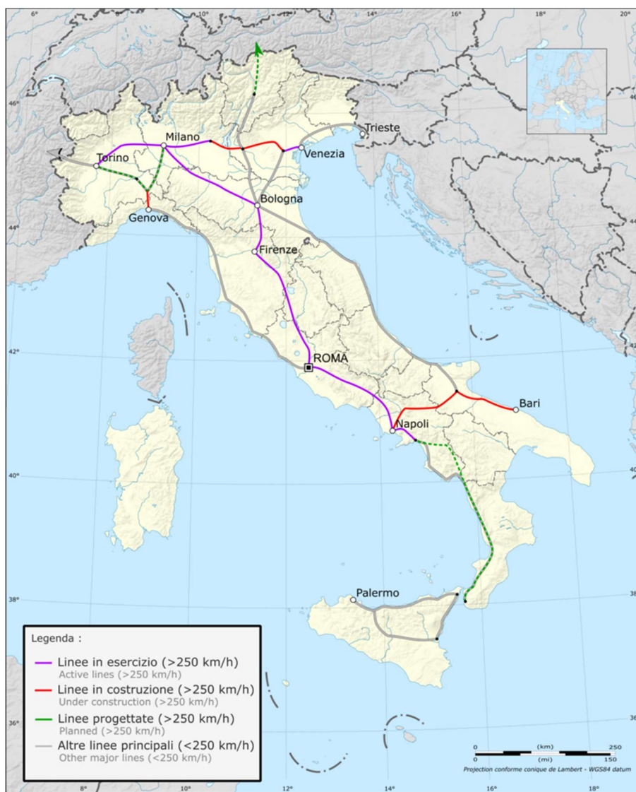
Slika 4. Prikaz mreže brzih vlakova u Italiji[9]

Talijanskim brzim željeznicama upravljaju dvije organizacije. Trenitalia koja je u vlasništvu Taljanskih državnih željeznica kojima upravlja vlada. Druga kompanija je Italo koja je privatna organizacija koja je u vlasništvu četvorice poduzetnika od kojih je jedan Luca Cordero di Montezemolo koji je bio CEO u Ferrariju, luksuznoj marki sportskih automobila [8].