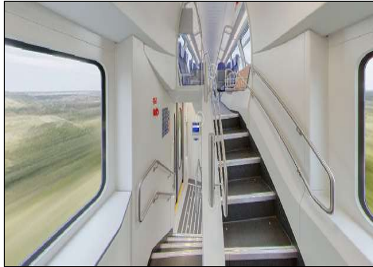
Slika 36. IC 2 raspodjela katova[54]

najmanjima, djeci. Osim toga, ovi vlakovi izrađeni su kako bi bili ekološki prihvatljiviji pa tako troše petinu manje struje od IC 1.