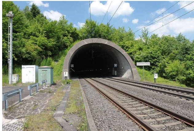
Slika 16. Tunel Landrücken[17]

Tunel Landrücken (Slika 16) stariji je od tunela Katzenberg i izgrađen je još 1988. godine. Nalazi se na brznoj željeznici koja povezuje njemačke gradove Hannover i Würzburg. Tunel se proteže na 10 779 metara i za sada je najduži tunel u Njemačkoj.