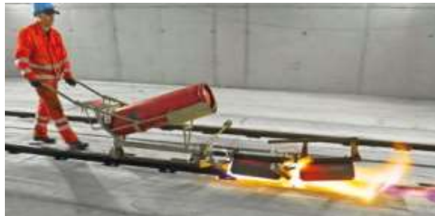
Slika 14. Instalacija modularnih i dugih zavarenih tračnica[16]