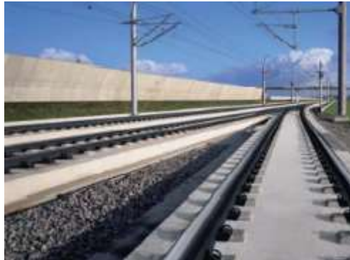
Slika 9. Kolosijek na čvrstoj podlozi[14]

Na prugama velikih brzina najčešće se izgrađuje kolosijek na čvrstoj podlozi (Slika 9) . Kolosijek na čvrstoj podlozi (njem. „Feste Fahrbahn“) ima određene prednosti. Takvi kolosijeci produžuju životni vijek pruge, smanjuju troškove održavanja i zahtijevaju manje održavanja, visoko su iskoristivi, imaju nižu konstruktivnu visinu i manju težinu konstrukcije, osiguravaju visoku horizontalnu i vertikalnu stabilnost kolosijeka te s njima nema problema s uzdizanjem zastornih čestica kod velikih brzina.[14]