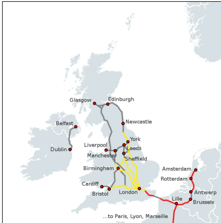
Slika 2. Prikaz brzih željeznica u Velikoj Britaniji [4]