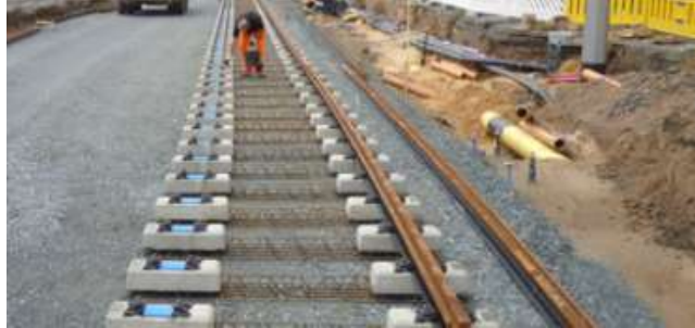
Slika 10. Izgradnja sustava „Rheda“ [15]