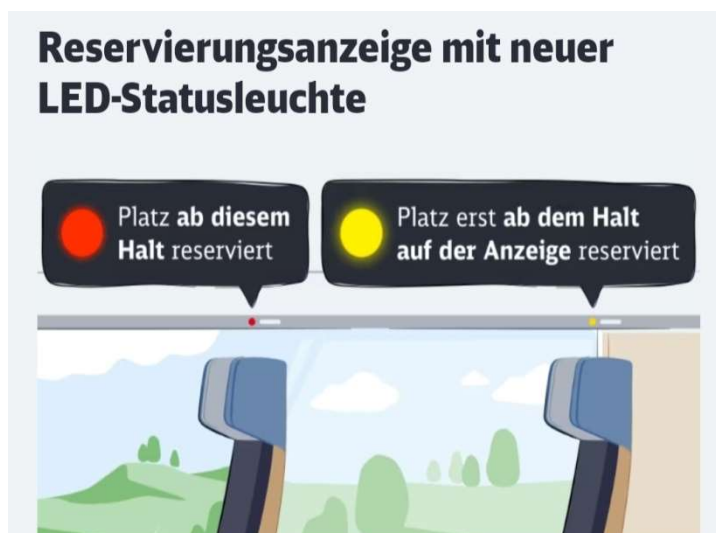
Slika 27. Način funkcioniranja LED svjetala[39]

Ovaj vlak opremljen je novim LED statusnim svjetlom, a rezervirana i slobodna mjesta označena su određenom bojom. Crvena LED dioda označava da postoji rezervacija koja je važeća za ukrcaj, žuta označava da postoji rezervacija tek kasnije na ruti, a slobodna mjesta nisu označena, odnosno nema teksta i LED ne svijetli (Slika 27).