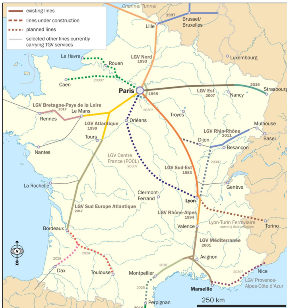
Slika 3. Mreža pruga velikih brzina u Francuskoj[7]