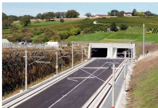
Slika 15. Tunel Katzenberg izvana[16]