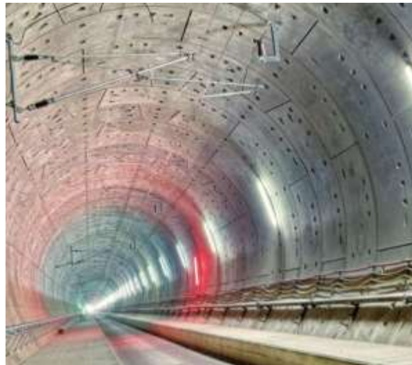
Slika 11. Tunel Katzenberg[16]

Tunel Katzenberg je željeznički tunel koji je izgrađen na brznoj željeznici koja povezuje gradove Karlsruhe u Njemačkoj i Basel u Švicarskoj. Otvoren je u prosincu 2012. godine, a izgrađen je kako bi promet koji se proteže dolinom Rajne bio rasterećeniji. Dug je gotovo 10 kilometara (Slika 11).