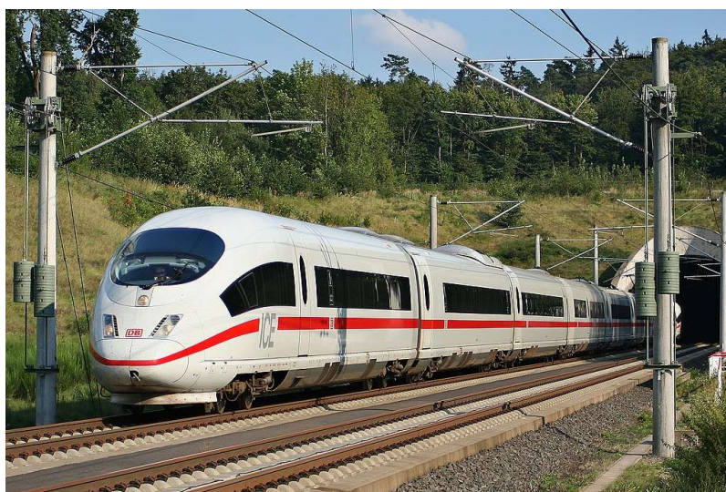
Slika 24. ICE 3[35]

ICE 3 pušten je u promet 2000. godine, a poznat je kao „onaj brzi“. Ovaj najbrži vlak koji prometuje u Njemačkoj i u inozemstvu postavio je nove tehničke standarde. ICE 3 postiže brzinu čak do 300 km/h. Za razliku od svojih prethodnika (ICE 1, ICE 2), ovaj vlak nema konvencionalnu pogonsku glavu, već se radi o vlaku s pogonskim vagonima. To znači da je pogon ravnomjerno raspoređen po cijeloj dužini vlaka (Slika 24).