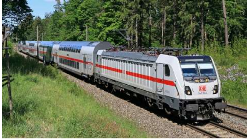
Slika 38. IC 2 147[55]

IC 2 4110 (Slika 32) vlakovi pušteni su u promet 2020. godine. Ima četiri vagona, 295 sjedećih mjesta, dug je „samo“ 100 metara (u odnosu na druge vlakove), teži 218 tona i postiže brzinu do 200 km/h. [55]