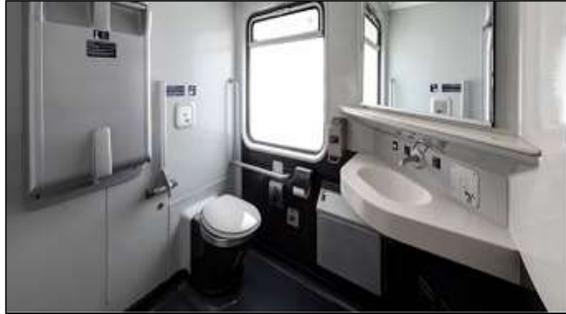
Slika 35. Moderniziran i uređen toalet u IC 1 vlaku[52]

IC 1 vlakovi koriste se na mnogobrojnim rutama unutar Njemačke, a voze i prema Nizozemskoj i Austriji. IC 1 povezuje urbane sredine, ali prometuje i do Allgäua, Berchtesgadena, Bodenskog jezera, Sjevernog i Baltičkog mora, do otoka Sylt i Rügen, kao i do Amsterdama, Salzburga, Graza i Klagenfurta. Ovi vlakovi također omogućavaju i prijenos bicikala.