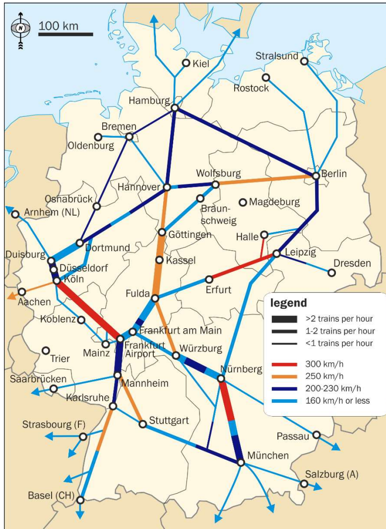
Slika 7. Prikaz ICE mreže u Njemačkoj[12]

ICE 1 vlakove izradila je tvrtka Siemens koji je bio zadužen za izradu većine željezničkih vozila. Zbog dobre perspektive ICE 1 vlakova DB-ovi inženjeri su planirali drugu generaciju ICE vlakova koja bi se koristila za povezivanje drugih tržišta i za međunarodni transport. 1993. godine u proizvodnju kreće druga generacija brzih vlakova zvana ICE 2. Oni pružaju bolju fleksibilnost, lakši su zahvaljujući aluminijskoj izgradnji u odnosu na ICE 1 vlakove. Treća generacija ICE vlakova poznata kao ICE 2/2. Unatoč imenu koje slični na ICE 2 vlakove, nisu imali skoro nikakve sličnosti s ICE 1 i ICE 2 vlakovima. Glavni inženjer DB-ovog odjela za tehnički dizajn Heinz Kurz 1997. godine razvija novu generaciju brzih vlakova ICE 3. DB