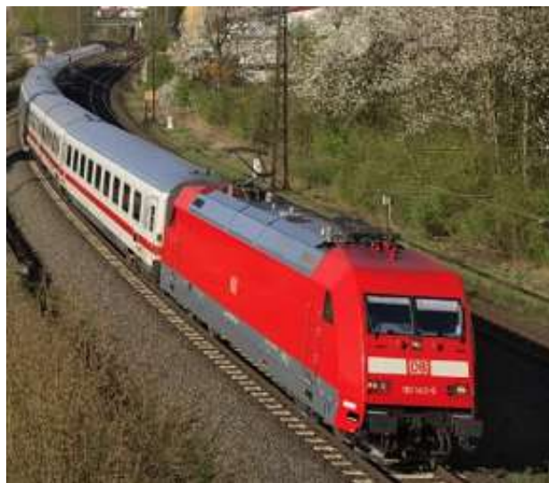
Slika 33. IC 1[49]

IC 1, poznat i kao klasični putnički vlak (der Reisezugklassiker), bio je glavno međugradsko prijevozno sredstvo njemačke željeznice otprilike dvadeset godina, prije pojave ICE vlakova (Slika 11). Ovaj klasični putnički vlak sastoji se od lokomotive i ima između 6 i 11 putničkih vagona, stoga je njegova dužina ovisna o broju vagona. Ako se broji svih jedanaest vagona, ukupna dužina IC 1 vlaka je 310 metara, a svaki vagon pojedinačno ima otprilike 26 metara. Za razliku od ICE vlakova, IC vlakovi sastavljaju se pojedinačno i ono ovisi o broju putnika (Slika 33).