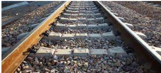
Slika 8. Kolosijek sa kolosiječnim zastorom[13]

Gornji ustroj kolosijeka za velike brzine sadrži sve elemente klasičnog kolosijeka. Kolosijeci se izvode standardne širine(1435mm), elektrificiraju se izmjeničnom strujom od 15kV i 16.7 Hz. Mogu biti izvedeni s kolosiječnim zastorom i bez kolosiječnog zastora. Kolosijeci s kolosiječnim zastorom sastoje se od tračnica veće mase (tip 60E1), prednapetih betonskih pragova širine 2.6m koji su postavljeni na razmaku od 0.5 m, koristi se elastičan kolosiječni pribor, kolosiječni zastor od tučenca, zaštitni sloj ravnika te imaju zaštitni sloj protiv smrzavanja(Slika 8).