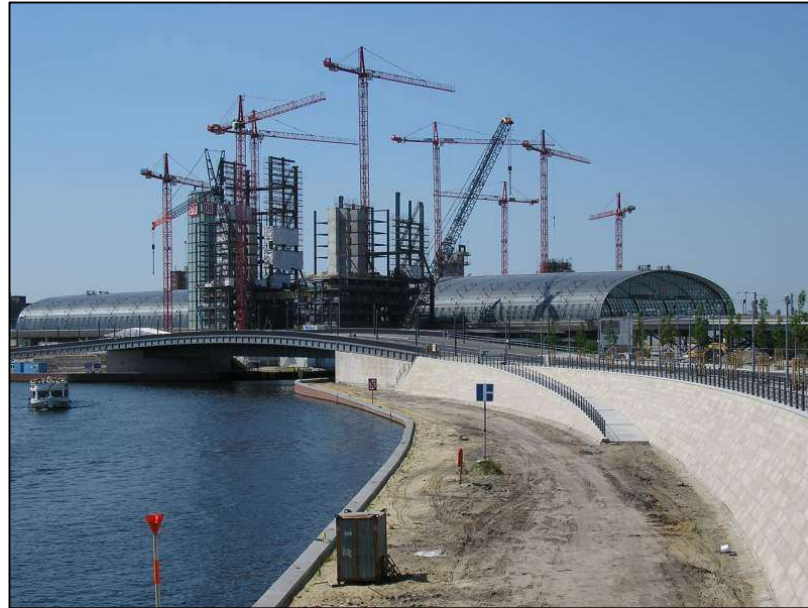
Slika 19. Izgradnja glavnog kolodvora u Berlinu, autor Albrecht Konz[24]

izgradnja mostova za novi smjer gradske željeznice. Radovi na izgradnji krova novog kolodvora krenuli su 2002. godine (Slika 19).