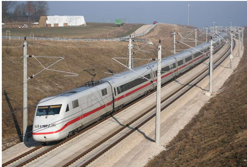
Slika 23. ICE 2[34]

Druga generacija brzih vlakova u Njemačkoj počela je prometovati 1996. godine. Za razliku od ICE 1, ICE 2 ima jednu pogonsku glavu i upravljački vagon (Slika 23). Njemačka željeznica realizirala je isti koncept i kod budućih ICE vlakova 4. ICE vlakovi druge generacije obično voze na liniji istok-zapad. Put počinje u Berlinu i prolazi kroz regiju Rhein Ruhr, tu prolaze obje glavne linije. Druga generacija ICE vlakova vozi od Hamma preko Dortmunda, Essena i Düsseldorfa kao i preko Hagena, Wuppertala i Kölna. [5]