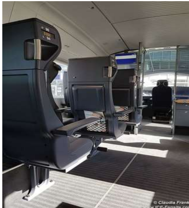
Slika 25. Stakleni zid između putnika i strojovođe, redizajn ICE 3 serije[37]

elegantno dizajniran restoran s 20 sjedećih mjesta. Program redizajna uključuje i nova sjedala i stolove, nove police za prtljagu i novi sustav informiranja putnika. Na početku i na kraju vlaka nalaze se posebni odjeljci prvoga razreda koji su staklenim zidom odvojeni od strojovođe (Slika 25). [36]