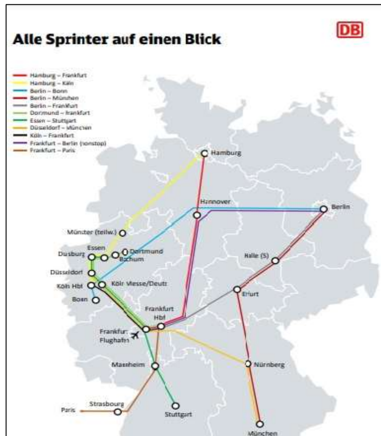
Slika 29. Prikaz svih ICE Sprinter linija[43]

ICE Sprinter je njemačka najbrža izravna veza bez zaustavljanja između velikih njemačkih gradova. Ovu liniju najčešće koriste poslovni ljudi kojima je u cilju najbrže stići do određenog odredišta. Ovakvom vožnjom za otprilike 3 i pol sata može se stići od Frankfurta ili Mainza do Berlina ili u suprotnome smjeru, isto kao i od Hamburga do Frankfurta (Slika 29).