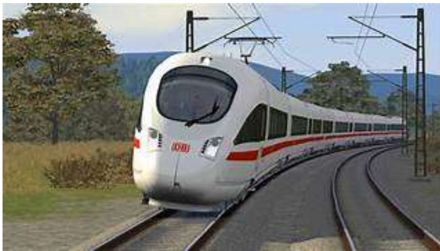
Slika 28. ICE T u nagibu[41]

ICE T, poznat i kao „specijalist za nagibe“, prometuje od 1999. godine. Ovaj vlak ima posebnu tehniku naginjanja, drugim riječima radi se o nagibnome vlaku velikih brzina koji se može nagnuti u zavoju do 8° (Slika 28). ICE T je do 30% brži na zavojitim dionicama nego drugi, konvencionalni vlakovi. Na to ukazuje i slovo „T“ u nazivu vlaka kao engleska kratica za „tilt-technology“. ICE T dostupan je u dvije serije: kao vlak s 5 i sa 7 vagona. Te dvije serije vlakova mogu se spojiti i voziti kao dvostruki vlak.