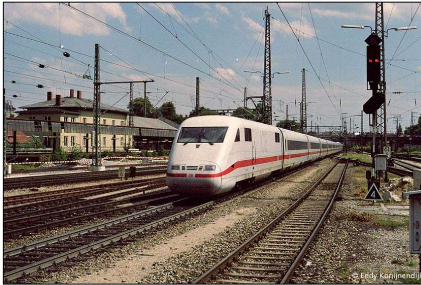
Slika 6. Prikaz DB-ova vlaka velikih brzina

Tek 1991. godine je odobren putnički promet na liniji između Mannheima i Stuttgarta. DB pušta u promet ICE 91 (Slika 6), na kojem su vlakovi prometovali brzinom od 250 km/h dok im je dano dopuštenje za povećanje brzine na 280 km/h kako bi nadoknadili izgubljeno vrijeme zbog mogućih zakašnjenja.