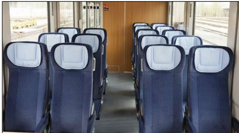
Slika 34. Unutrašnjost jednog od vagona IC 1[51]

Lokomotiva klase 101 pokreće se na električni pogon. Za neke relacije, na primjer do mjesta Allgäu ili Sylt, koriste se dizel lokomotive. Dizel lokomotive koriste se uglavnom za relativno kratke dionice bez elektrifikacije. [50] Lokomotiva je lako zamjenjiva, zato se može omogućiti nesmetana vožnja bez presjedanja. Putnički vagoni IC 1 vlakova kupljeni su između 1970. i 1980. godine, a do danas su u nekoliko navrata modernizirani i dorađeni. Prva detaljna modernizacija unutrašnjosti vagona provedena je devedesetih godina prošloga stoljeća, a početkom novoga tisućljeća većina vagona opremljena je elektroničkim sustavom za informiranje putnika te je osposobljena elektronička rezervacija sjedala. Između 2012. i 2014. godine vagoni su opremljeni novim sjedalima, tepisima i stolovima (Slika 34).