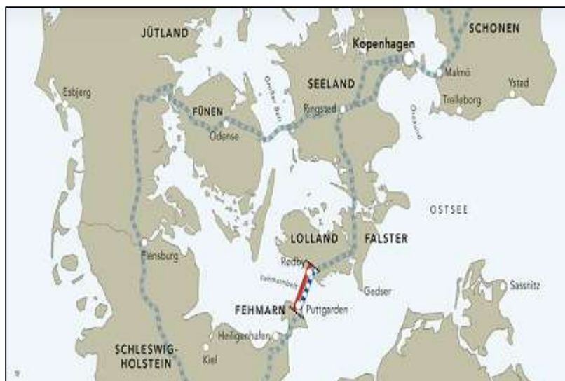
Slika 18. Povezanost tunela Fehmarn Belt Fixed Link[21]

Lolloland je inače povezan s Fehmarnom od 1963. godine s kojim dijeli trajektnu liniju. Od tada se razmišlja i razgovara o boljem i trajnijem rješenju povezanosti. Prvo je planirana izgradnja mosta koja je trebala biti gotova do 2018. godine. Iako je prvotna ideja bila da se izgradi most, danska tvrtka Femern A/S 2010. godine predlaže izgradnju tunela kao bolje rješenje za povezanost Njemačke i Danske. Godinu dana poslije projekt je prihvaćen, godine 2022. započela je izgradnja, a kraj projekta predviđa se za 2029. godinu. [22]