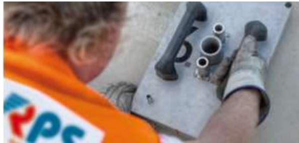
Slika 12. Primjer jedne od šablona za bušenje[16]

Sustav nadzemnih kontaktnih vodova ovog tunela morao je biti prilagođen velikoj brzini putovanja, stoga je bilo potrebno provođenje snažnog sustava za prenošenje električne energije. RPS (Rail Power System) je tako uspio razviti modificiranu kontaktnu mrežu velike brzine za jednokolosiječne tunele. Provođenje sustava napajanja električnom energijom trajalo je od 2009. do 2011. godine. Osim kontaktne mreže, RPS je uspio razviti i njezin način pričvršćivanja. Zato konzolne komponente nisu pričvršćene na već ugrađene sidrene tračnice, već su pričvršćene za tunelske prstenove pomoću sidra. Prilikom izgradnje moralo se paziti na razmak od 48 metara između potpornih točaka, a vanjski kamen nije se smio bušiti. Kako bi se bušile ostale komponente izgradnje sustava tunela Katzenberg, osmišljeno je ukupno devet šablona za bušenje (Slika 12) s ciljem izbjegavanja skupljanja prašine.