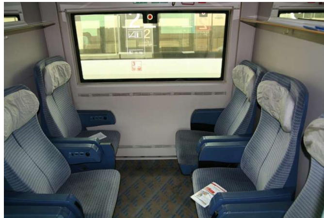
Slika 22. Kupe sa šest sjedala u ICE 1[33]

ICE 1 vlakovi opremljeni su visokim tehnologijama kao što su klima uređaji i podno grijanje. ICE 1 (klasa 401) ima dvije pogonske glave, dvanaest vagona i dug je 358 metara. Njegova najveća dozvoljena brzina je 280 km/h, a postiže ju električnim pogonom sa snagom od otprilike 9600kW. Osim dvanaest vagona, vlak ima vagon-restoran i bistro-vagon s povišenim krovom (Slika 22). [32]