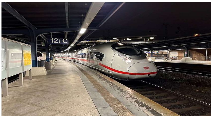
Slika 26. ICE 3neo (Velaro MS)[38]

Ovaj vlak opremljen je novim LED statusnim svjetlom, a rezervirana i slobodna mjesta označena su određenom bojom. Crvena LED dioda označava da postoji rezervacija koja je važeća za ukrcaj, žuta označava da postoji rezervacija tek kasnije na ruti, a slobodna mjesta nisu označena, odnosno nema teksta i LED ne svijetli (Slika 27).