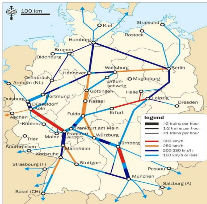
Slika 21. ICE mreža povezana s Berlinom[26]