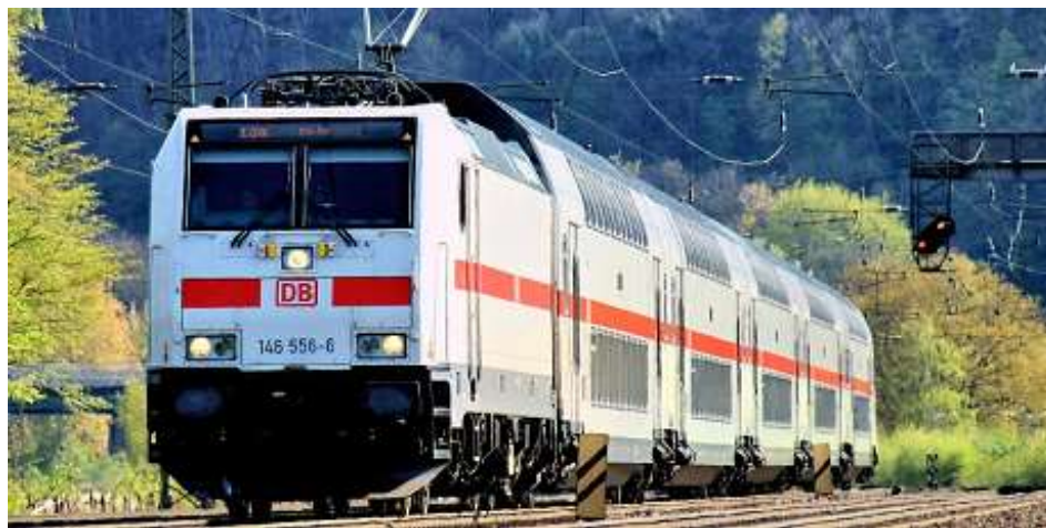
Slika 37. IC 2 146[55]

IC 2 broji tri serije vlakova: 146/147, 4110 (4-Teiler) i 4010 (6-Teiler). Vlak 146/147 prometuje od 2015. godine, a ima četiri putnička vagona i jedan kontrolni vagon (Slika 37, 38). Broji 461 sjedeće mjesto, dug je 135 metara i težak 270 tona. Postiže brzinu do 160 km/h.