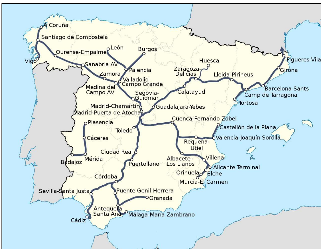
Slika 5. Prikaz mreže brzih željeznica u Španjolskoj[11]

Prva linija je imala duljinu od 471 km, dok danas ima duljinu od 3100 km što ju čini najduljom prugom za brze vlakove u Europi (slika 5). Zbog pametnog zaobilaznja planina izgradnja željezničke infrastrukture je završena u relativno kratkom roku od četiri i pol godine. Brzine na kojima prometuju vlakovi se kreću između 250 km/h i 320 km/h [10].