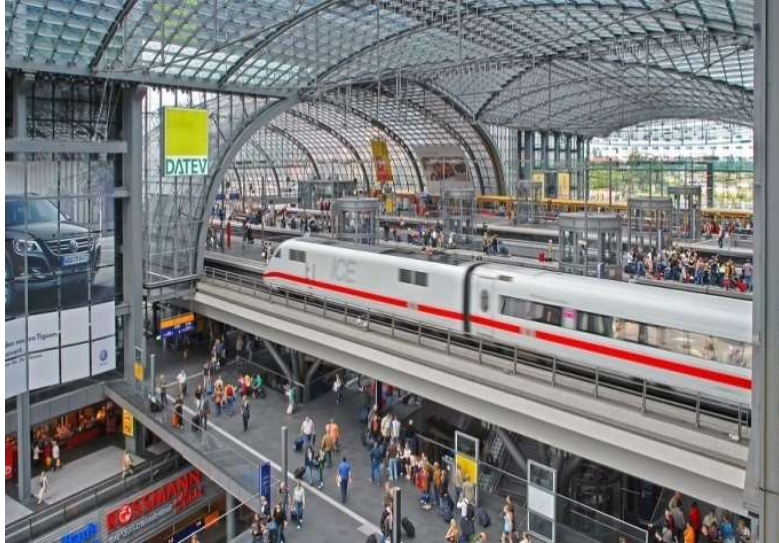
Slika 20. Berlinski glavni kolodvor[25]

Berlinski glavni kolodvor je čvorište ICE, IC i EC željezničkih linija. ICE linije spajaju Berlin s Kielom, Hamburgom, Leipzgom, Nürnbergom, Münchenom, Trierom, Hannoverom, Kölnom, Bonnom, Baselom, Meinhammom, Frankfurtom na Majni, Innsbruckom i Stuttgartom. IC linije povezuju Berlin s Westerlandom, Hamburgom, Pragom u Češkoj, Bečom u Austriji, Budimpeštom u Mađarskoj i Bratislavom u Slovačkoj. Berlin je tako povezan s gradovima kao što su Stralsund, Erfurt, Düsseldorf i Magdeburg. EuroCity linije povezuju Berlin s Varšavom, Krakovom, Hamburgom i Cottbusom (Slika 21).