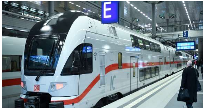
Slika 39. IC 2 4110[55]

IC 2 4110 (Slika 32) vlakovi pušteni su u promet 2020. godine. Ima četiri vagona, 295 sjedećih mjesta, dug je „samo“ 100 metara (u odnosu na druge vlakove), teži 218 tona i postiže brzinu do 200 km/h. [55]