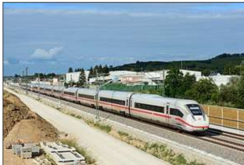
Slika 30. ICE 4, 2021.[44]

Novi ICE 4 prošao je probni rok s dva vlaka u listopadu 2016. godine, a službeno je pušten u promet 2017. godine. Ovaj vlak je moderan i prilagođen različitim tehničkim nadogradnjama kako bi mogao parirati u brzom njemačkom prometu (Slika 30). Nova pogonska tehnologija štedi resurse i korišten je aerodinamični dizajn, čime je do izražaja došla ekološka osviještenost.