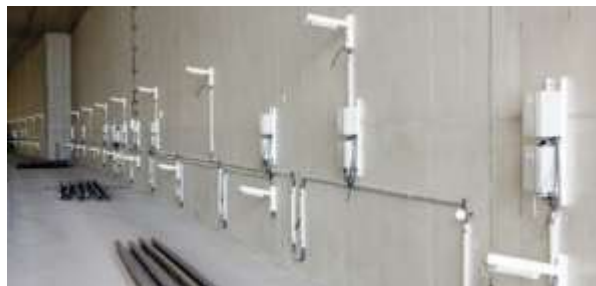
Slika 13. Sigurnosna svjetla[16]

Prilikom izgradnje ovoga tunela, tvrtka RPS bila je odgovorna i za provođenje signalizacije. Tako su ugradili najnoviju generaciju sigurnosnih svjetala (Slika 13) i instalirali su inovativne višestruke utičnice unutar tunela. Instalirano je njih čak 150 samo u ovome tunelu kako ne bi uopće došlo do prekida električne energije.