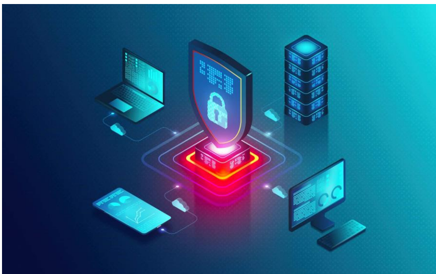
Slika 2. Kibernetička sigurnost 17

Snažna strategija kibernetičke sigurnosti može pružiti dobru sigurnosnu poziciju protiv zlonamjernih napada osmišljenih za pristup, izmjenu, brisanje, uništavanje ili iznuđivanje sustava i osjetljivih podataka organizacije ili korisnika. Također, kibernetička sigurnost je ključna u sprječavanju napada koji imaju za cilj onemogućiti ili poremetiti rad sustava ili uređaja [11].