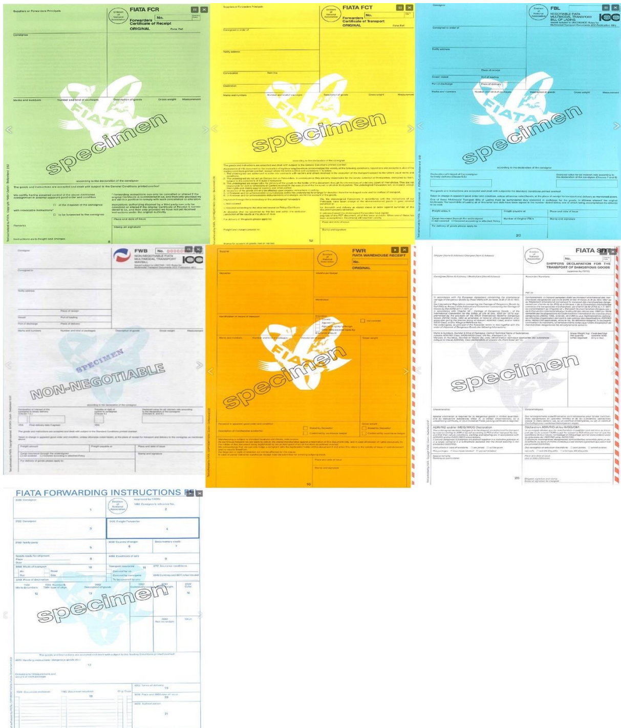
Slika 1. FIATA-ina dokumenti