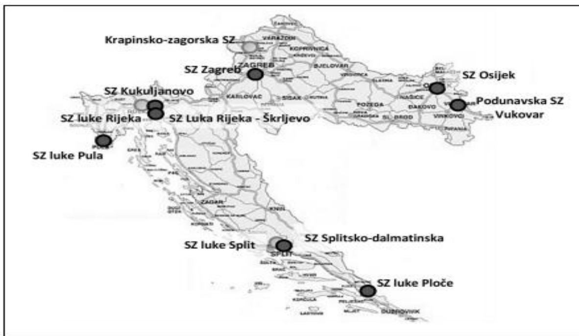
Slika 3. Karta slobodnih zona u Republici Hrvatskoj u 2021. godini