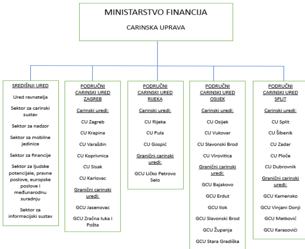
Slika 2. Ustroj Carinske uprave Republike Hrvatske

Ustroj Carinske uprave Republike Hrvatske vidljiv je na slici 2.