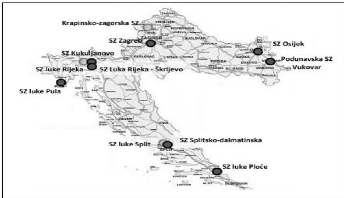
Slika 3. Karta slobodnih zona u Republici Hrvatskoj u 2021. godini