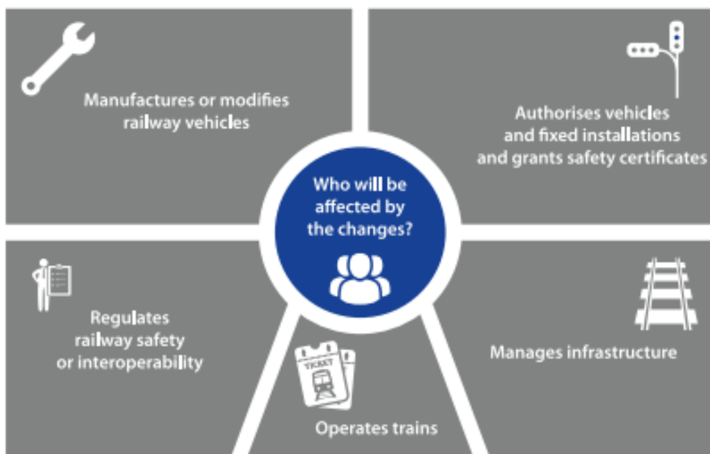
Slika 1: Utjecaj provedbe četvrtog željezničkog paketa

kreću iz istog polazišta. Kao najjednostavniji primjer možemo uzeti starost željezničkih vozila te razinu sigurnosti pojedinih signalno-sigurnosnih uređaja.