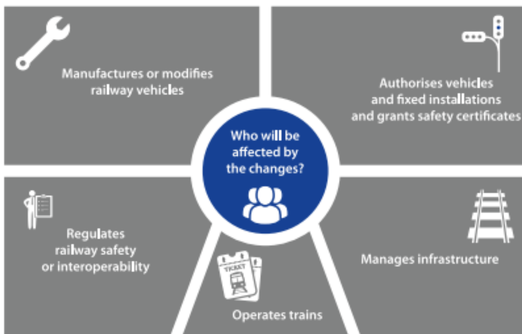
Slika 1: Utjecaj provedbe četvrtog željezničkog paketa

kreću iz istog polazišta. Kao najjednostavniji primjer možemo uzeti starost željezničkih vozila te razinu sigurnosti pojedinih signalno-sigurnosnih uređaja.