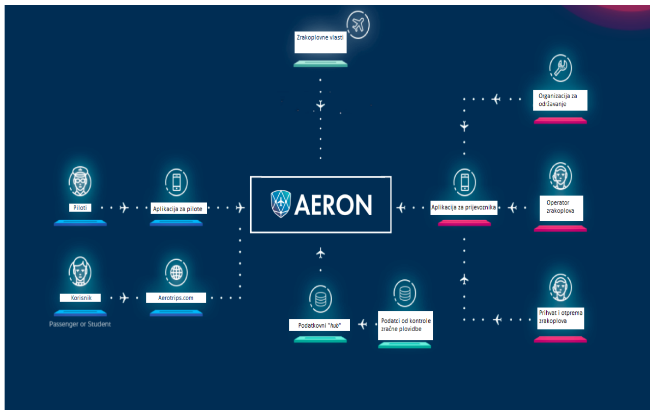
Slika 4: Način rada Aeron blockchain baze podataka

Korisnik Aeron-a ostvaruje pristup provjerenoj globalnoj blockchain bazi podataka putem aerotrips.com stranice. Na slici je prikazano kako su svi članovi povezani u Aeron [24].