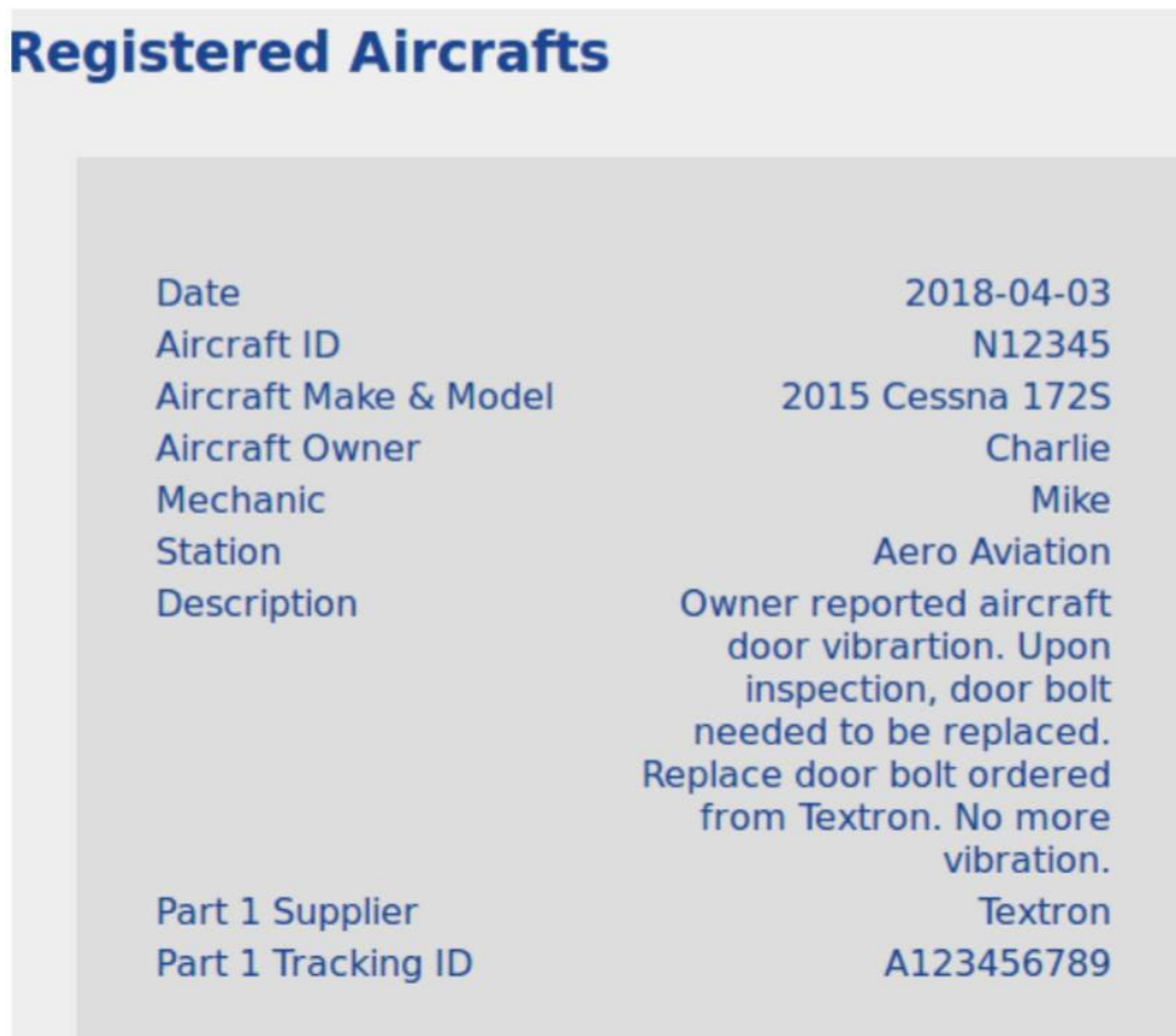
Slika 3: Podaci o održavanju zrakoplova