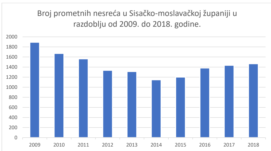
Graf 1. Prometne nesreće u Sisačko-moslavačkoj županiji 2009.- 2018.

2018. godine ukupan broj prometnih nesreća se ponovno povećava. Od 2014., kada je kao što je ranije istaknuto, zabilježen ukupno najmanji broj prometnih nesreća, ukupan broj prometnih nesreća se u samo četiri godine ponovno povećao za 318. Nadalje, u navedenom se podrazdoblju primjećuje konstantno povećavanje, odnosno rast ukupnog broja nesreća iz godine u godinu. Osim toga, u navedenom se podrazdoblju također povećao broj teško ozlijeđenih, dok je broj poginulih relativno stalan. U Sisačko – moslavačkoj županiji 2018. godine su zabilježene ukupno 433 prometne nesreće s nastradalim osobama, odnosno 4,0 % od ukupnog broja prometnih nesreća s nastradalim osobama u Republici Hrvatskoj [10]. Graf 1. prikazuje broj prometnih nesreća u razdoblju 2009. – 2018.