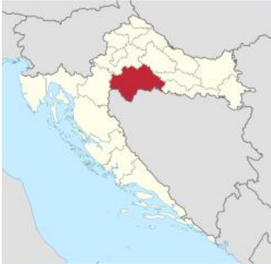
Slika 2. Položaj Sisačko-moslavačke županije