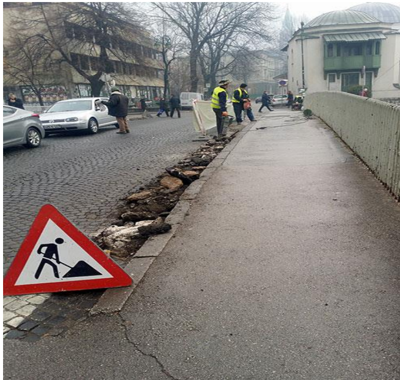
Slika 7. Radovi na sanaciji betonskih rigola

Na slici 7. prikazani su radovi na sanaciji betonskih rigola.