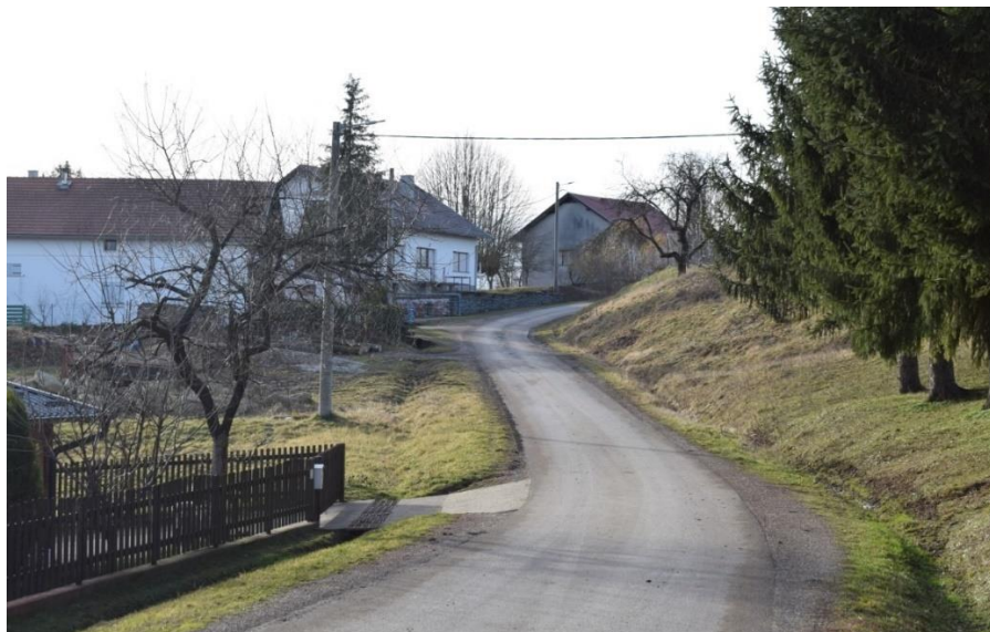
Slika 10. Prometnica u mjestu Strašnik

Sisačko-moslavačka županija preko Županijske uprave za ceste u 2021. godini uložila je gotovo 7 milijuna kuna u županijske i lokalne ceste na području grada Petrinje. Na području od Ž3240 do naselja Jošavica, u suradnji s Gradom Petrinja, izvedena je sanacija kolničkog zastora asfaltiranjem kolnika u vrijednosti preko 574.797,25 kuna (s PDV-om), zatim u mjestu Strašnik izvedeni su radovi sanacije zbog posljedica potresa, vrijednosti 1.121.081,79 kuna (s PDV-om) te sanacija u mjestu Sibić vrijednosti radova 684.524,75 kuna (s PDV-om) [9]. Na slici 10. prikazana je prometnica u mjestu Strašnik nakon sanacije.