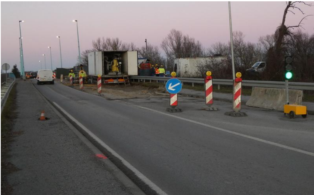
Slika 11. Zamjena kolnika na mostu Brest

Na mostu Brest radi se zamjena kolnika, antikorozivna zaštita, pješačke staze se mijenjaju, prilazne naprave se mijenjaju, ležajevi, hidroizolacije se mijenjaju i vraća se sve nazad u prvobitno stanje. Radove izvodi tvrtka Spegra. Ugovorena ukupna cijena radova iznosi 10 milijuna kuna, a radovi bi trebali trajati 8 mjeseci [15]. Na slici 11. prikazana je zamjena kolnika na mostu Brest.