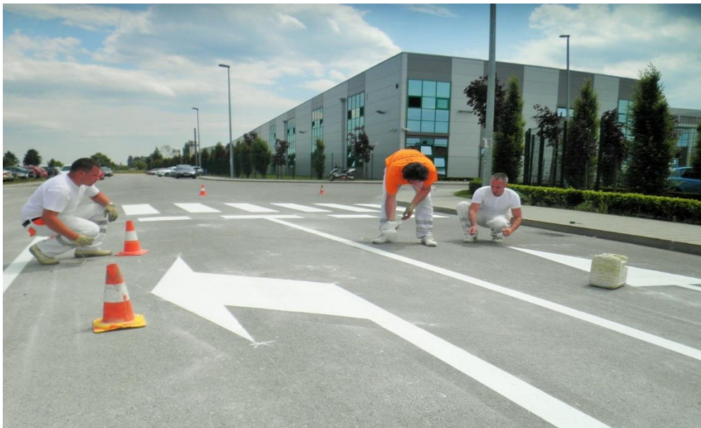
Slika 8. Radovi na uređenju horizontalne signalizacije

Pod održavanje cestovne opreme spadaju: čišćenje i manji popravci prometnih znakova, semafora, odbojnih ograda, oznaka na kolniku, smjerokaznih stupića, reflektirajućih oznaka, zaštitnih ograda i drugih uređaja. Oznake na cestama, prometni znakovi i reflektirajuće oznake moraju biti sigurni, jasno vidljivi i čisti. Odbojne ograde, zaštitne ograde i drugi uređaji moraju djelovati u skladu s projektiranim i planiranim performansama [14]. Na slici 8. prikazano je održavanje horizontalne signalizacije.