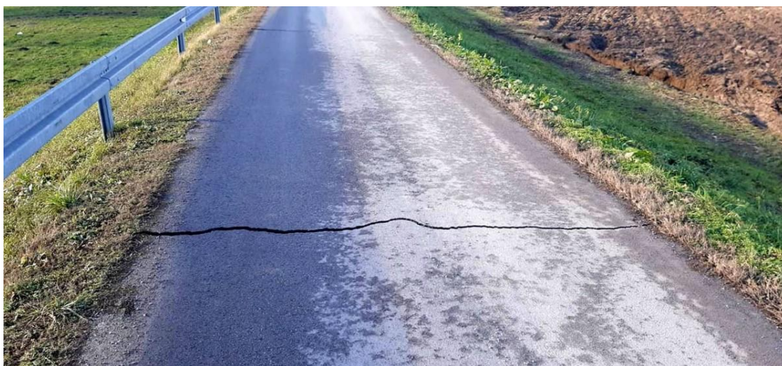
Slika 4. Oštećenje kolnika u mjestu Tišina Erdedska

Dodatno pogoršanje stanja cestovne mreže Sisačko-moslavačke županije imao je razoran potres magnitude 6,4 MW s epicentrom 3 kilometra jugozapadno od grada Petrinje koji se desio 29.12.2020. godine. Osim državnih cesta, oštećenja su pretrpjela i županijske odnosno lokalne i nerazvrstane ceste. Na slici 4. prikazano je oštećenje kolnika u mjestu Tišina Erdedska uzrokovano posljedicama potresa.