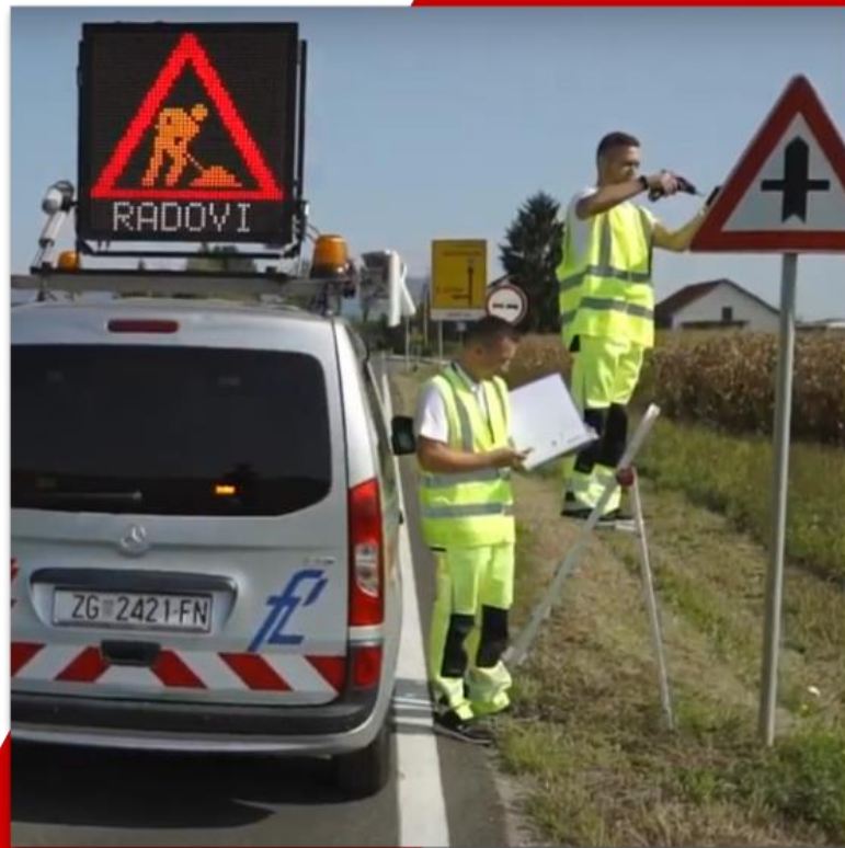
Slika 13. Očitavanje znakova RFID čitačem

za prometnu signalizaciju pri Fakultetu prometnih znanosti Sveučilišta u Zagrebu i tvrtkom SMART – View d.o.o. iz Hrvatske provelo je projekt u dvije faze s ciljem stvaranja potpune baze prometnih znakova. Prva faza bila je izrada baze podataka, odnosno prikupljanje podataka. Druga faza projekta, koja je započela 2017. godine s Finskim partnerima, Sveučilištem primijenjenih znanosti Jamk i tvrtkom Aksulit, sastoji se od instalacije pasivnih RFID oznaka na svakom znaku iz baze podataka. Glavni cilj oznaka RFID-a je omogućiti učinkovitu i brzu provjeru i ažuriranje baze podataka. U tu svrhu, vozilo koje se koristi za standardnu kontrolu cestovnog prometa je opremljeno RFID čitačem, antenama i prijenosnim PC-jem. Tijekom normalnog pogona, RFID oznake se čitaju i baza podataka automatski se ažurira. Kako bi se odredio maksimalan raspon čitanja, optimalan položaj oznake RFID-a na znaku, kut antene i tip polarizacije, brzina vozila i tip oznake RFID-a, provedena su dva pilot projekta. Ukupno je zabilježeno i uspješno testirano 700 prometnih znakova u 2018. godini pasivnim oznakama RFID-a. Očitavanje znakova RFID čitačem prikazano je slikom 13.