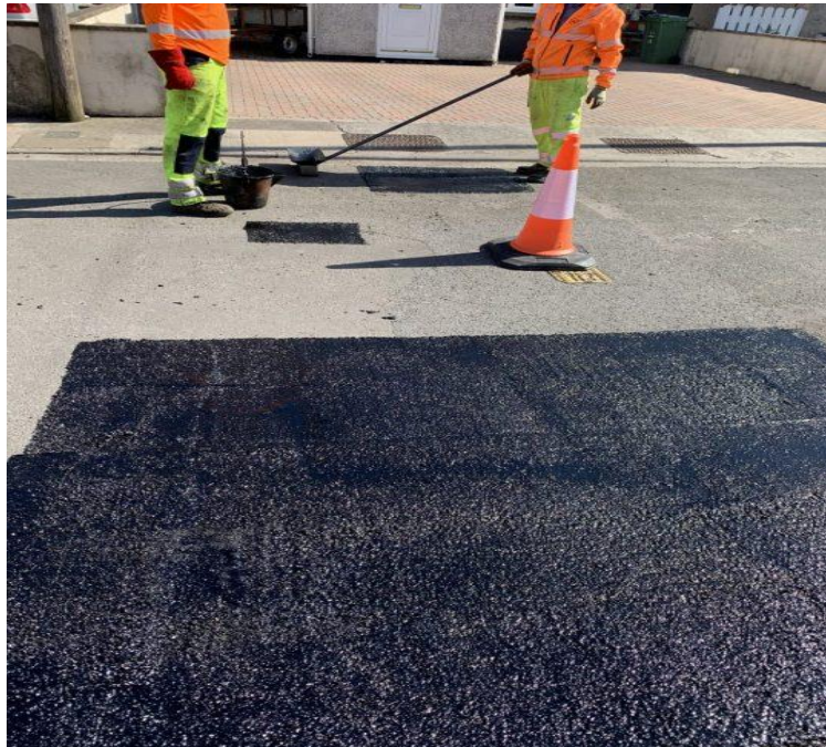
Slika 5. Krpanje rupa na kolniku

Na slici 5. prikazano je krpanje rupa pomoću nove smjese bazirane na recikliranim materijalima. Sastoji se od 65 posto recikliranog asfalta te recikliranih guma i još nekih tajnih sastojaka, a Britanska tvrtka Roadmender Asphalt koja ga proizvodi nazvala ga je Elasotmac.