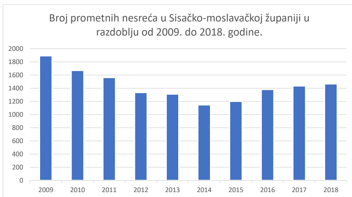
Graf 1. Prometne nesreće u Sisačko-moslavačkoj županiji 2009.- 2018.

2018. godine ukupan broj prometnih nesreća se ponovno povećava. Od 2014., kada je kao što je ranije istaknuto, zabilježen ukupno najmanji broj prometnih nesreća, ukupan broj prometnih nesreća se u samo četiri godine ponovno povećao za 318. Nadalje, u navedenom se podrazdoblju primjećuje konstantno povećavanje, odnosno rast ukupnog broja nesreća iz godine u godinu. Osim toga, u navedenom se podrazdoblju također povećao broj teško ozlijeđenih, dok je broj poginulih relativno stalan. U Sisačko – moslavačkoj županiji 2018. godine su zabilježene ukupno 433 prometne nesreće s nastradalim osobama, odnosno 4,0 % od ukupnog broja prometnih nesreća s nastradalim osobama u Republici Hrvatskoj [10]. Graf 1. prikazuje broj prometnih nesreća u razdoblju 2009. – 2018.