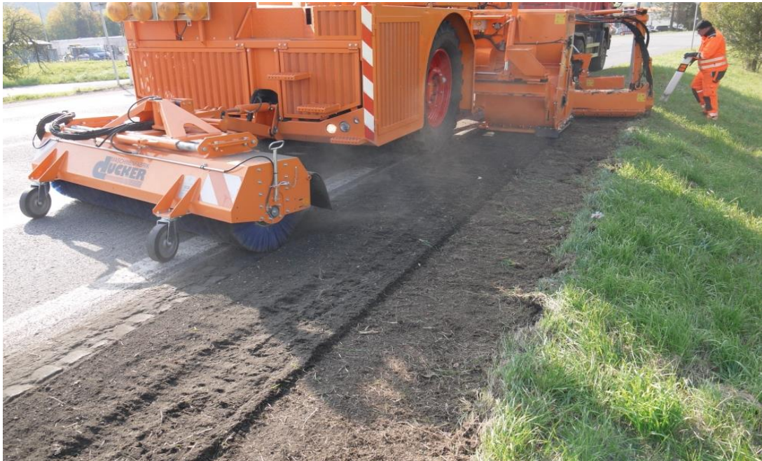
Slika 6. Strojno uređenje bankina

mreža i drugih građevina za osiguranje osnovnoga cestovnog tijela [13]. Na slici 6. prikazano je strojno uređenje bankina.