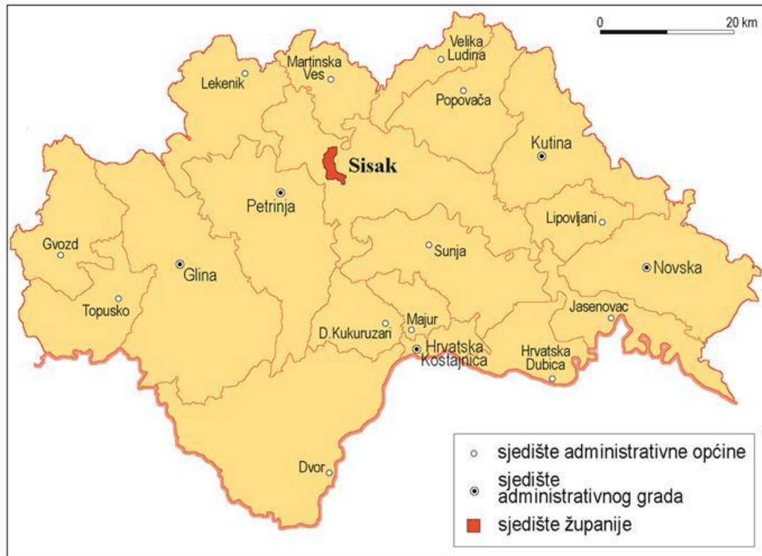
Slika 1. Prikaz Sisačko - moslavačke županije

Ukupan broj registriranih vozila u županiji iznosi 68 413, od toga broj osobnih i kombiniranih automobila iznosi 50 504, teretnih vozila 3826, autobusa 83, te ostalih vozila 14000 [1]. Izgled Sisačko-moslavačke županije prikazan je na slici 1.