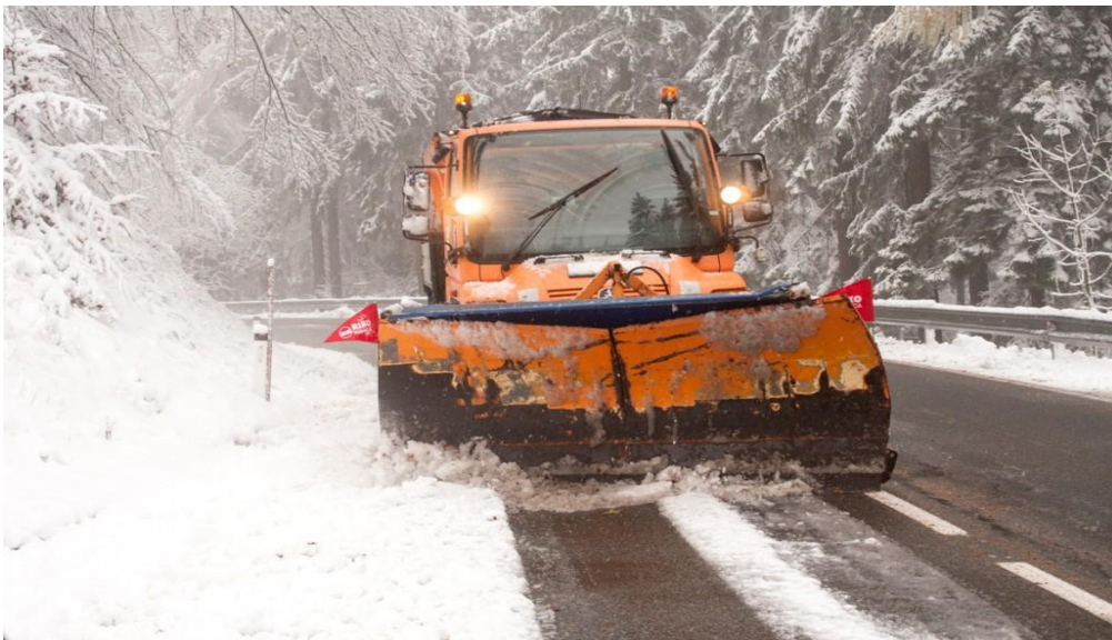
Slika 9. Rad zimske službe

Zimska služba je pojam i uobičajeni izraz za cijeli niz radnji, mjera, postupaka i aktivnosti u zimskom razdoblju, koje imaju zadaću osigurati mogućnost odvijanja prometa cestama uz najveću moguću sigurnost sudionika u prometu i prihvatljive troškove. U zimskom razdoblju koje, u pravilu, traje od 15. studenog tekuće do 15. travnja sljedeće godine, ceste se održavaju u skladu s izvedbenim programom zimske službe. Izvedbeni program zimske službe donosi upravitelj ceste, na prijedlog izvođača radova redovnog održavanja ceste, koji ga je dužan podnijeti na prihvaćanje upravitelju ceste najkasnije do 15. listopada tekuće godine [12]. Rad zimske službe prikazan je slikom 9.