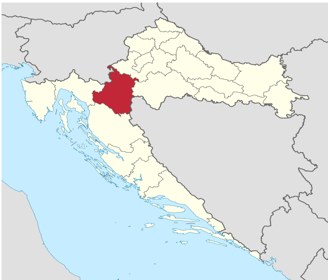
Slika 1 Prostorni prikaz položaja Karlovačke županije