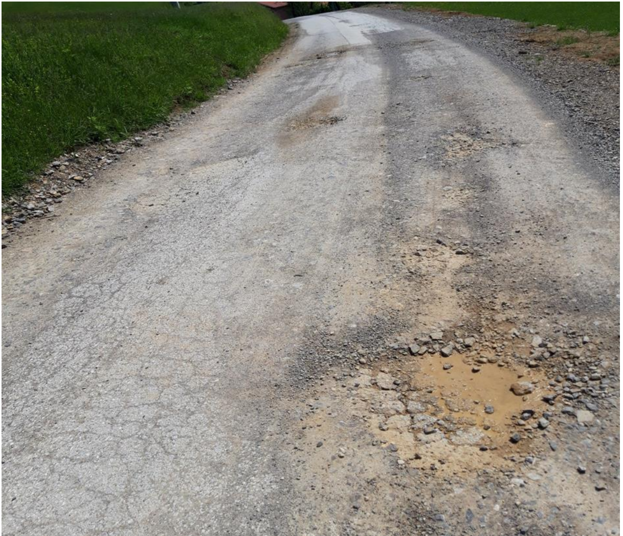
Slika 8 Prikaz neobnovljene ŽC Slunj-Bogovolja-Cetingrad

za rekonstrukciju odavno napravljen i odobren, na početak radova čeka se već dvije godine.