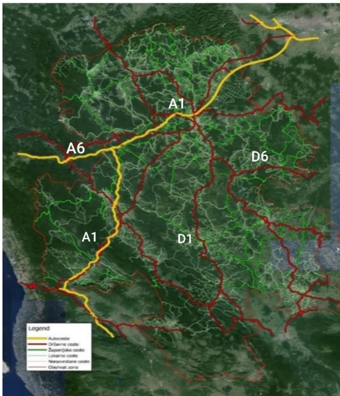
Slika 2 Cestovna prometna mreža Karlovačke županije