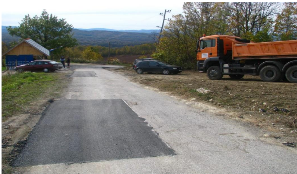
Slika 9 Obnavljanje LC Cetinski Varoš-Bilo

U travnju ove godine, obnovljena je LC 34028 na dionici Jaškovo-Sv.Hrašće u duljini od 1000 m. Zbog smanjenja sigurnosti prometa na spomenutoj dionici izvedeno je proširenje kolnika na dva prometna traka ukupne širine 5,5m. U svibnju ove godine započela je i rekonstrukcija lokalne ceste 34147 (Slika 9) koja povezuje dva naseljena mjesta Cetinski Varoš i Bilo.