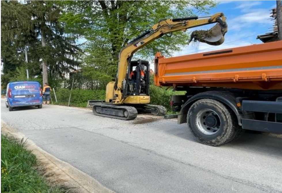
Slika 7 Radovi održavanja ŽC Ozalj-Gornje Pokupje