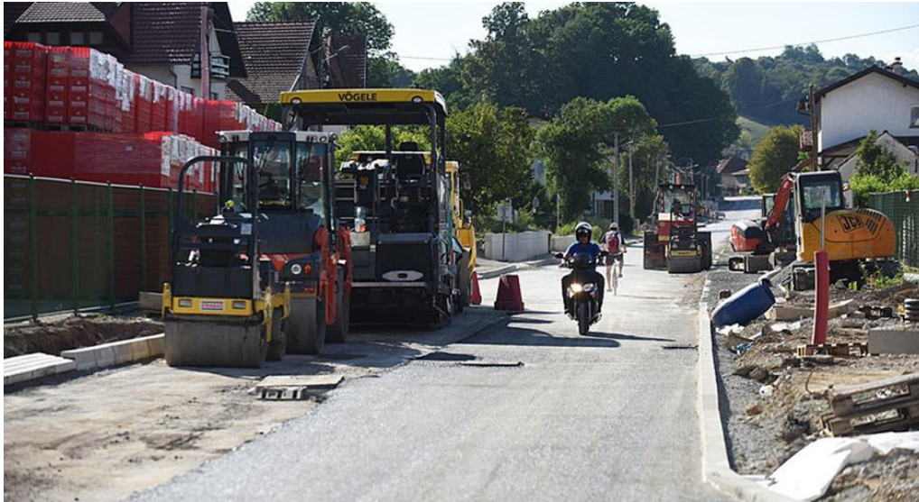
Slika 6 Sanacija kolnika Žumberačke ulice

Izvor : http://www.zuc-karlovac.hr (3.9.2021.)