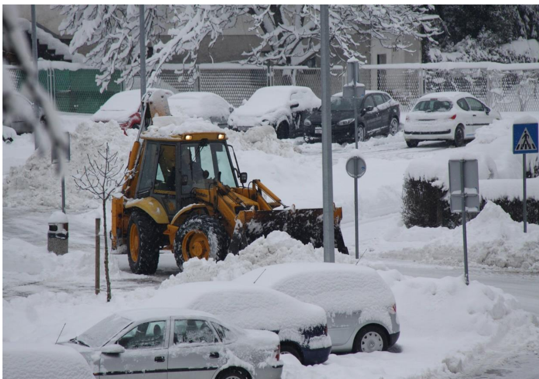
Slika 5 Kolnik prilikom snježnih oborina