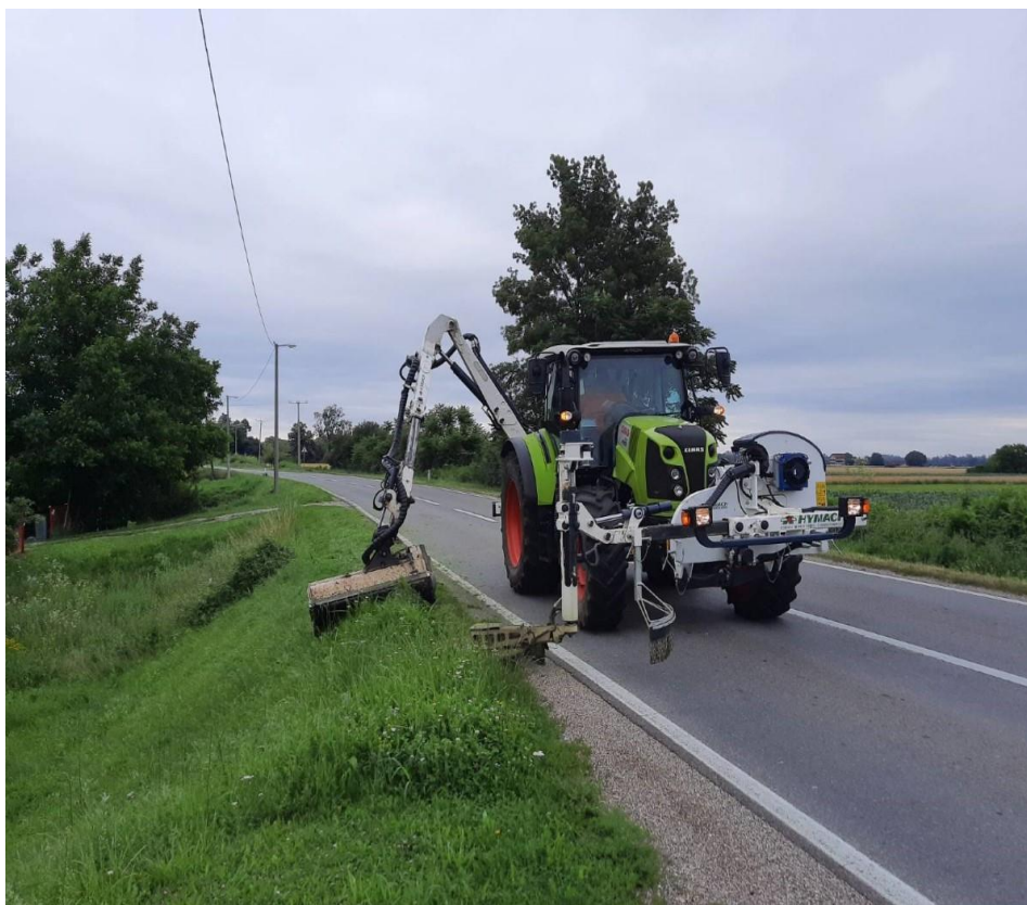
Slika 4 Prikaz održavanja vegetacije