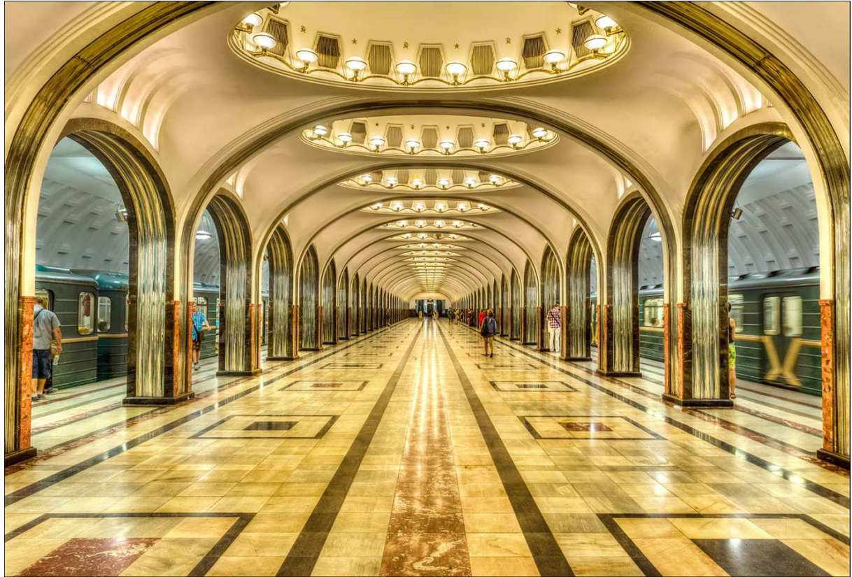
Slika 8. Metro sustav u Moskvi