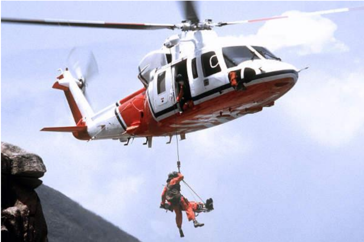
Slika 7. S-76D Helikopter, [13]