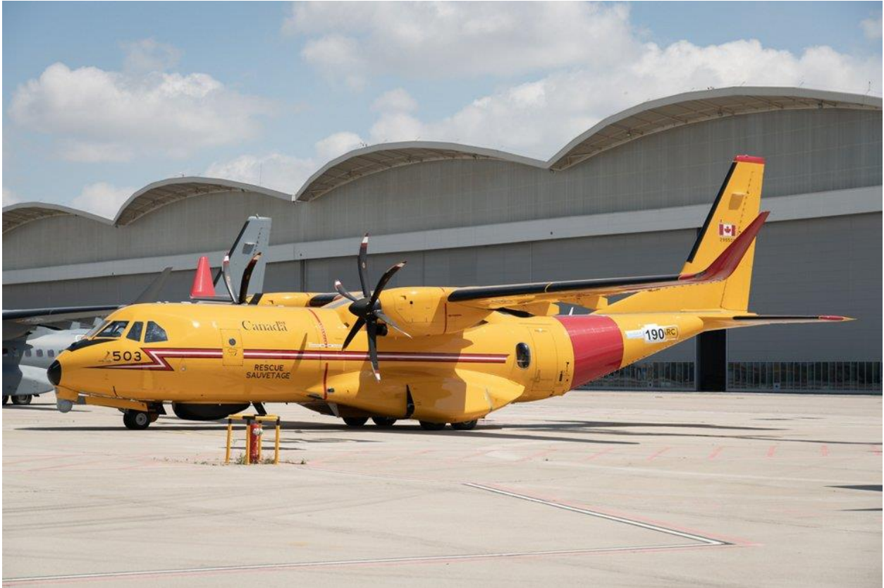
Slika 4. C295W zrakoplov, [9]

Kanadska vlada nabavila je novu flotu od 16 C295W zrakoplova s fiksnim krilima konfiguriranih za misije traganja i spašavanja. C295W zrakoplov prikazan je na slici 4, a koristi se za obavljanje bitnih SAR misija u sjevernoatlantskoj i arktičkoj regiji, te u planinama.