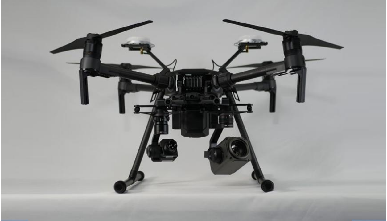
Slika 11. Matrice 210, [19]