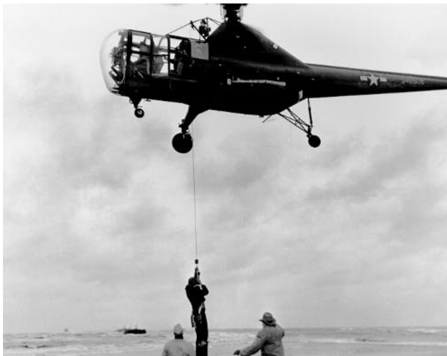
Slika 1. Prva operacija potrage i spašavanja Sikorsky R-5 helikopterom, [1]

Točno pedeset godina od tada utvrđeno je da je spašeno više od milijun života uz pomoć helikoptera. Helikopterom se spašavalo ljude s brodova koji tonu, nakon posljedica potresa, nesreća koje su se događale na autocestama, s klizišta, od vulkanskih erupcija, prilikom požara u zgradama i naravno tijekom ratova koji se nažalost još uvijek odvijaju.