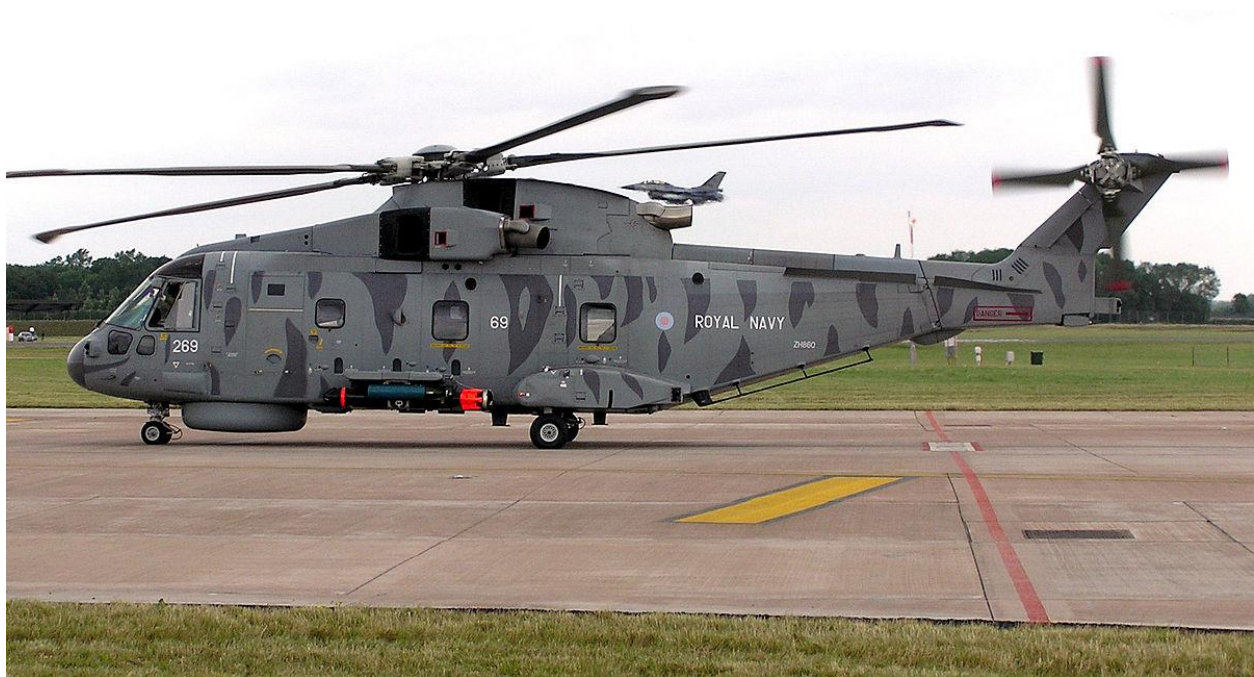
Slika 6. AgustaWestland AW101, [12]

AgustaWestland AW101 helikopter je prikazan na slici 6. Sadrži integriran radar za potrage i promjenu meteoroloških uvjeta, elektro-optički sustav, veliku zadnju rampu i klizna vrata, električne dizalice za spašavanje preživjelih, kontroler za lebdjenje u zraku, pribor za brzo spuštanje užetom, svjetlo za potragu i glasan zvučnik, teretno uže, podvozje predviđeno za slijetanje na vodu u hitnim slučajevima i dvije splavi za spašavanje koji imaju mogućnost smještaja 14 putnika.