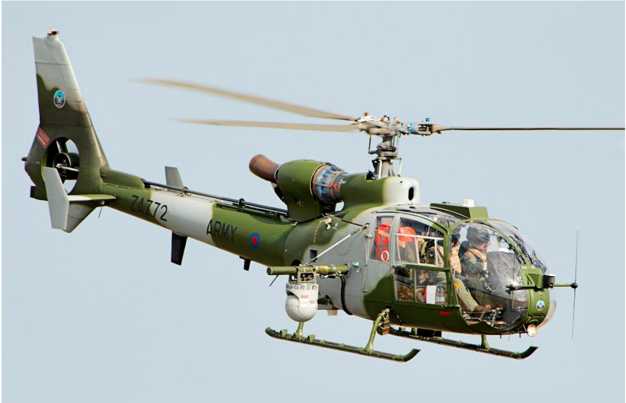
Slika 2. "Aerospatiale SA 342 Gazelle", [7]