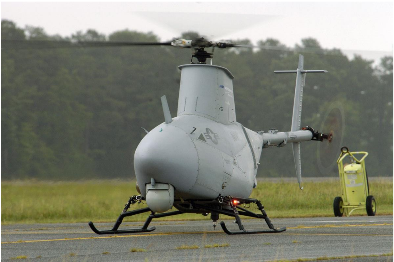
Slika 10. Fire Scout bespilotna letjelica, [19]

Fire Scout MQ-8C predstavlja novu generaciju bespilotnih letjelica dizajniranu od strane Northrop Grumman tvrtke, koja podržava zemaljske vojne operacije i vojne operacije iznad vodenih površina. Fire Scout MQ-8C bespilotni helikopter je dizajniran kako bi nakon polijetanja sa zemaljske platforme ili platforme na vodenoj površini obavljao operacije koje uključuju obavještajni rad, nadzor i izviđanje, opskrbu zalihama i komunikaciju putem releja. Ova bespilotna letjelica je ustvari poboljšana verzija MQ-8B Fire Scout bespilotne letjelice, sa duljim vremenom koji može provesti u letu bez punjenja goriva i većim kapacitetom plaćenog tereta. Ima i veću konstrukciju koja se bazira na modificiranom Bell 407 laganom komercijalnom helikopteru [18].