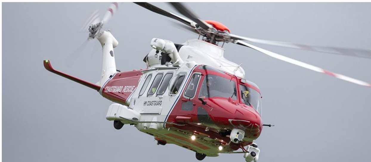
Slika 8. AgustaWestland AW189, [14]

Još neki od helikoptera koji su korisni u različitim aspektima operacija traganja i spašavanja su Eurocopter EC225 Super Puma koji je od strane Airbus helikoptera konfiguriran kao SAR helikopter visokog kapaciteta i mogućnosti rada u svim meteorološkim uvjetima, zatim AgustaWestland AW139 SAR helikopter koji sa visokim brzinama krstarenja i visokim kapacitetom plaćenog tereta osigurava uspješnost SAR misija čak i u najtežim uvjetima, te Eurocopter EC725 helikopter koji je višenamjenski helikopter prikladan za operacije borbene potrage i spašavanja.