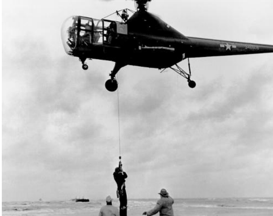
Slika 1. Prva operacija potrage i spašavanja Sikorsky R-5 helikopterom, [1]

Točno pedeset godina od tada utvrđeno je da je spašeno više od milijun života uz pomoć helikoptera. Helikopterom se spašavalo ljude s brodova koji tonu, nakon posljedica potresa, nesreća koje su se događale na autocestama, s klizišta, od vulkanskih erupcija, prilikom požara u zgradama i naravno tijekom ratova koji se nažalost još uvijek odvijaju.