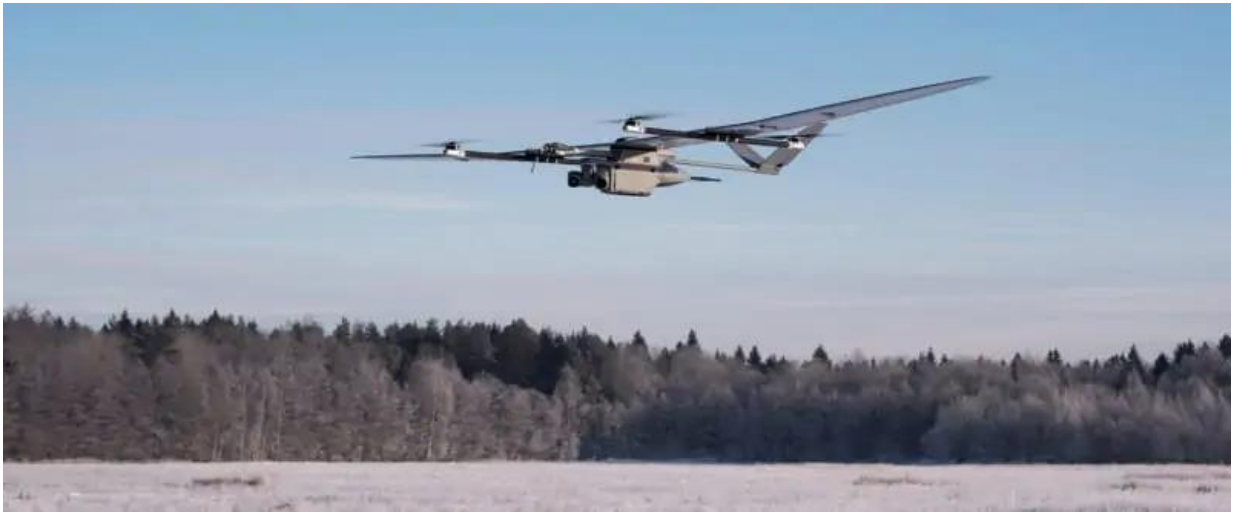
Slika 9. SAR Hibridna bespilotna letjelica s fiksnim krilom, [15]

prikazuje hibridnu bespilotnu letjelicu s fiksnim krilom koja se koristi u operacijama potrage i spašavanja.