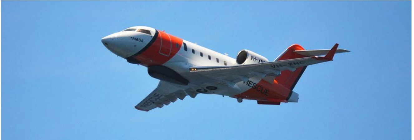
Slika 3. „Bombardier Challenger CL-604“, [8]

i spašavanju od kraja 2016. godine na razdoblje od 12 godine. Cobham je nabavio, preinačio, dao u pogon, upravljao i održavao četiri mlazna zrakoplova Bombardier Challenger CL-604 kako bi pružio sposobnost pretraživanja i spašavanja na kopnu i moru.