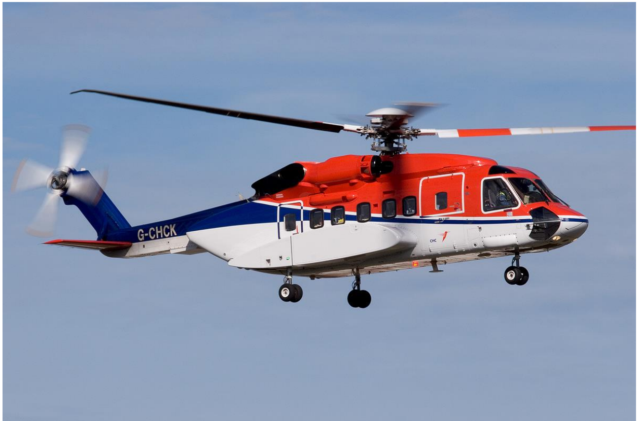
Slika 5. Sikorsky S-92 helikopter, [11]

U kabinu S-92 helikoptera se lagano može ući otvarajući klizna vrata sa desne strane ili uz pomoć stražnje rampe širine 2,13 metara. S-92 helikopter može spasiti dvoje preživjelih na doletu 380 kilometara i deset preživjelih na 334 kilometara leteći standardnom količinom goriva [10].