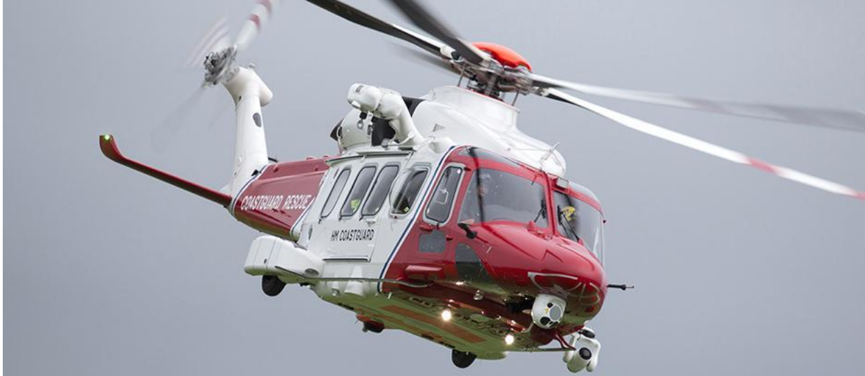
Slika 8. AgustaWestland AW189, [14]

Još neki od helikoptera koji su korisni u različitim aspektima operacija traganja i spašavanja su Eurocopter EC225 Super Puma koji je od strane Airbus helikoptera konfiguriran kao SAR helikopter visokog kapaciteta i mogućnosti rada u svim meteorološkim uvjetima, zatim AgustaWestland AW139 SAR helikopter koji sa visokim brzinama krstarenja i visokim kapacitetom plaćenog tereta osigurava uspješnost SAR misija čak i u najtežim uvjetima, te Eurocopter EC725 helikopter koji je višenamjenski helikopter prikladan za operacije borbene potrage i spašavanja.