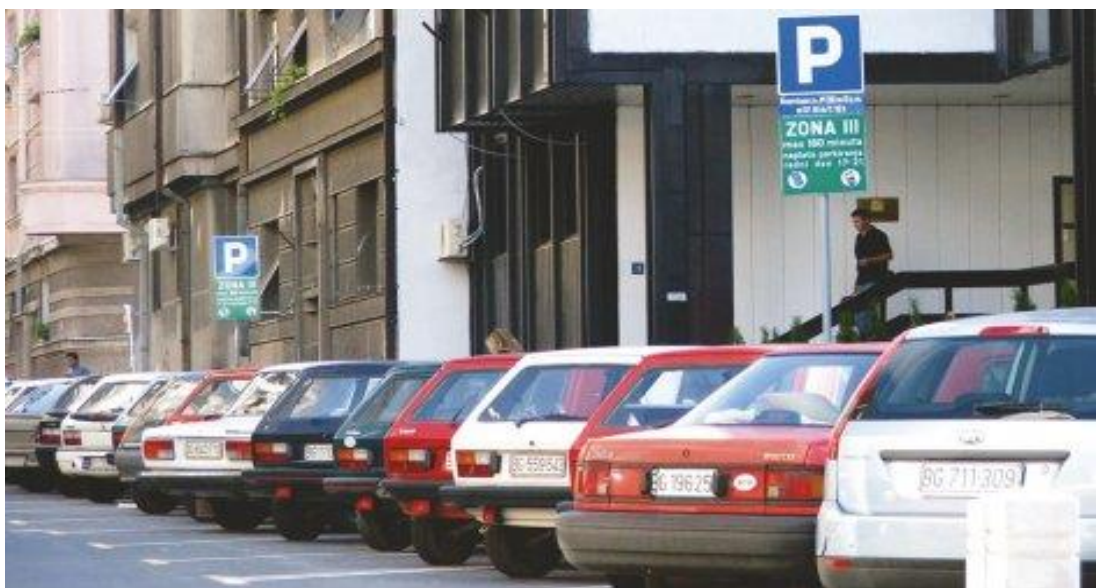
Slika 2. Ulično parkiranje [8]