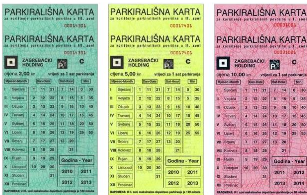
Slika 13. Parkirališna karta za jednokratnu uporabu[16]