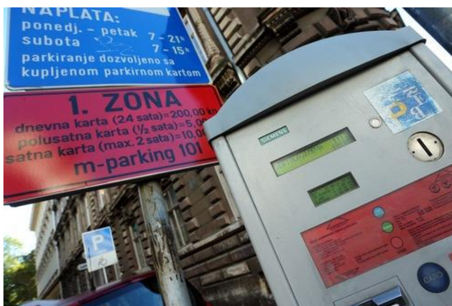
Slika 12. parkirališni aparat [16]