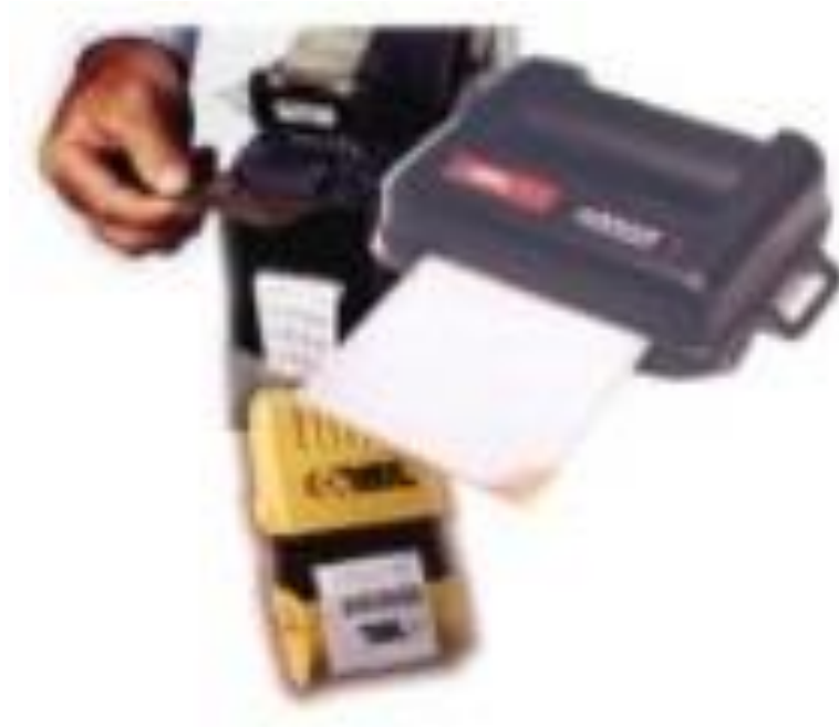
Slika 7. Programska podrška za upravljanjem sustavom [7]