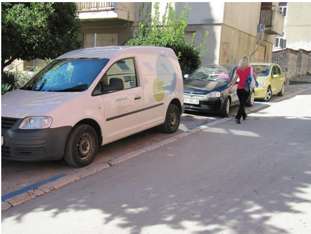
Slika 1. Parkiranje na nogostupe, onemogućuje slobodno kretanje pješaka