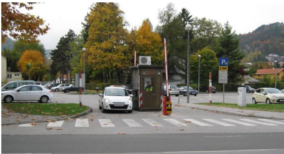
Slika 3. Javno izvanulično parkiranje [8]