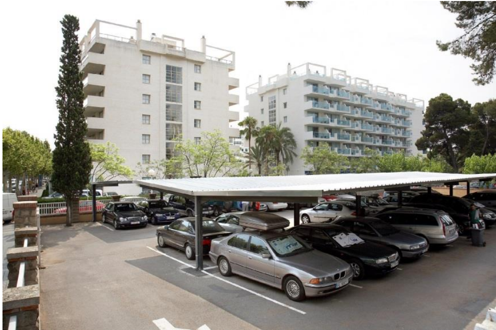
Slika 4. Privatno izvanulično parkiranje [8]

d. Privatno izvanulično parkiranje stanovnika koriste samo stanari određenog objekta. Takva parkirališna mjesta nemaju naplatu, ni vremensko ograničenje, već dolaze kao dodatna cijena stana ili kuće. U današnje vrijeme većina novijih stanova sadrži i dodatno parkirno mjesto za stanodavce.