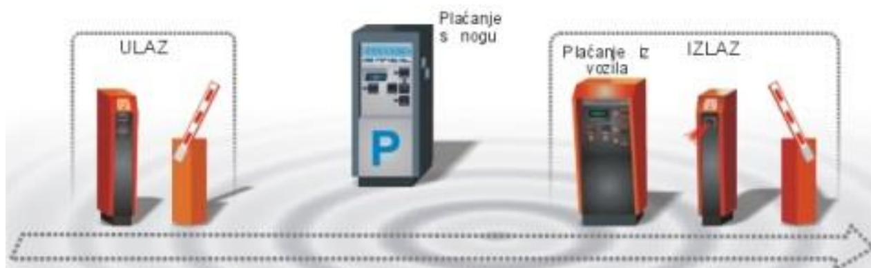
Slika 8. Sustav za upravljanje zatvorenih parkirališta i garaža [6]

Komponente sustava su: rampe, ulazni automat-terminal pristup za kontrolu ulaza i registraciju korisnika, uređaj za plaćanje parkirne pristojbe (iz vozila), upravljanje sustavom i kontrolu izlaza, izlazni automat-terminal za kontrolu izlaza, prepaid.kartice, te programska podrška za upravljanjem sustavom. [6]