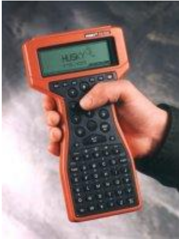
Slika 6. Handheld.terminal [7]