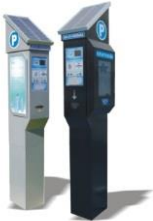
Slika 5. Parkirni automati S2 i Info-transakcijski terminal ITT-1 [7]

To je sustav za potpunu automatizaciju naplate i kontrole naplate parkiranja. Komponente sustava su: solarni parkirni aparat, ručna računala – terminala za kontrolu naplate parkirne pristojbe i programska podrška za upravljanjem sustavom. [7]