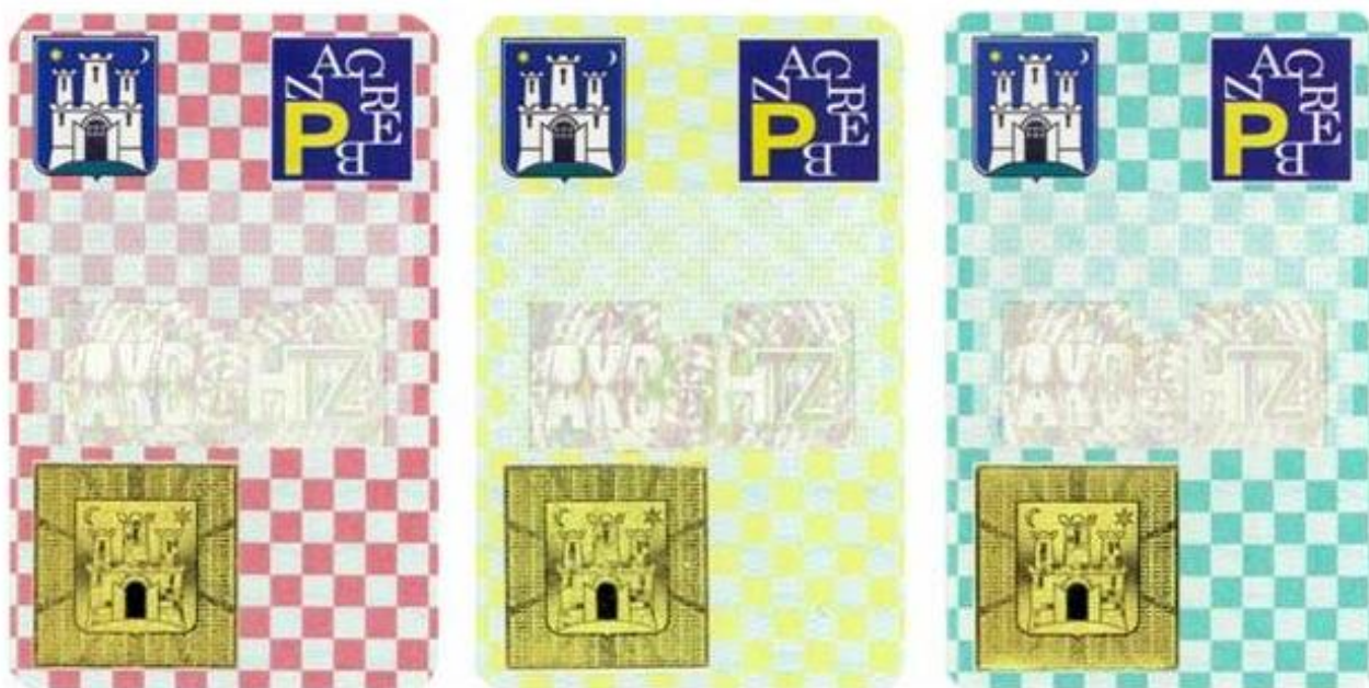
Slika 11. Povlaštene parkirane karte [18]

Ona se najduže izdaje 12 mjeseci. Može se izdati u dva oblika: materijaliziranom ili ne materijaliziranom. Materijalizirana je na papiru ili kao naljepnica, dok ne materijalizirana se izdaje kao potvrda u elektroničkom obliku.[16]