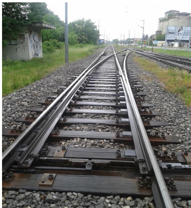
Slika 3. Skretnica na manipulativnom kolosijeku u kolodvoru Podsused Tvornica

Sve skretnice u kolodvoru od 1-16 i iskliznice I-1, I-2 i I-3 uključene su u signalno-sigurnosni uređaj i postavljaju se i zabravljaju iz središnjeg mjesta (prometnog ureda), a u takvoj su tehničkoj ovisnosti s glavnim signalima da se oni mogu postaviti da signaliziraju signalni znak za dopuštenu vožnju ako su skretnice postavljene u pravilan položaj za određeni vozni put.