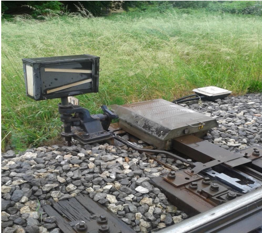
Slika 11. Postavna sprava skretnice u kolodvoru Podsused Tvornica