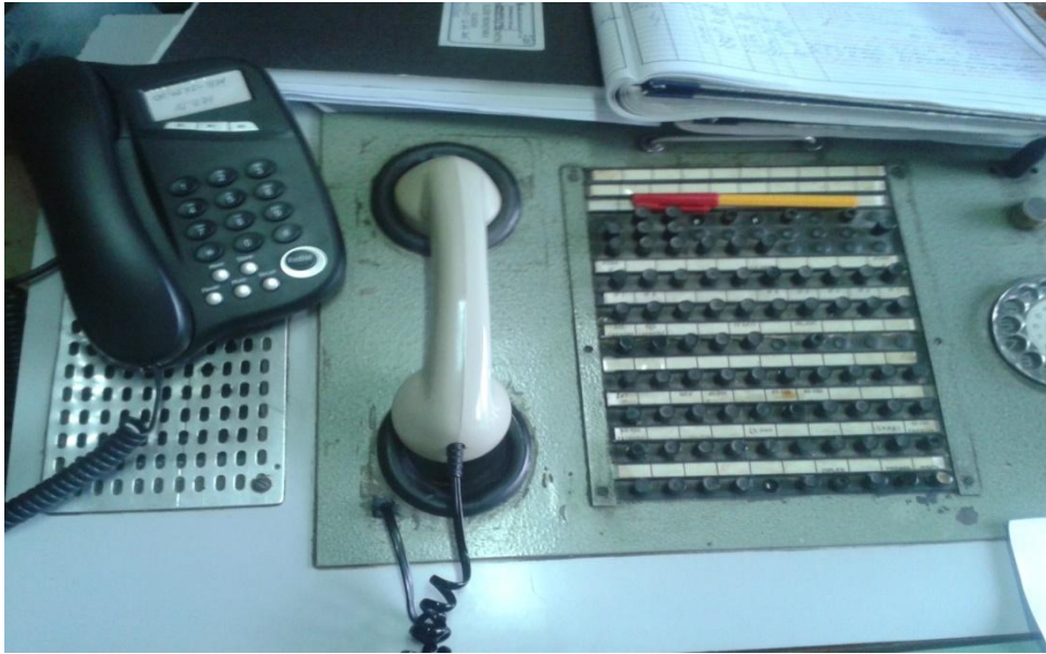
Slika 5. Telekomunikacijski pult u kolodvoru Podsused Tvornica

Kolodvor Podsused Tvornica raspolaže sljedećim telefonskim vodovima: