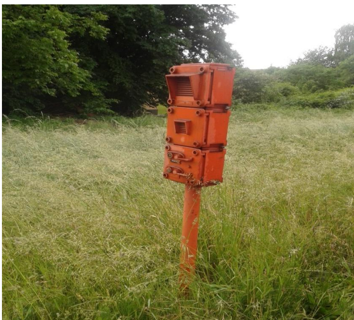
Slika 7. Interfon u kolodvoruPodsused Tvornica

U kolodvoru se obavlja primitak i otprema brzojavki. Sve brzojavke u prispijeću zaprimaju se od rajonskog kolodvora putem brzojavne pošte ili prometnika vlakova kolodvora Podsused Tvornica i iste se zavode u knjigu brzojavki „Pe-28“. Primljene brzojavke dalje se putem knjige pošte dostavljaju prema potrebi osoblju kolodvora. Brzojavke koje treba otpremiti zaprima prometnik vlakova od osoblja kolodvora, te dalje šalje putem rajonskog kolodvora (telegrafskog ureda Zagreb Zapadnog kolodvora) naslovljenim kolodvorima preko njihovih rajonskih kolodvora. 9