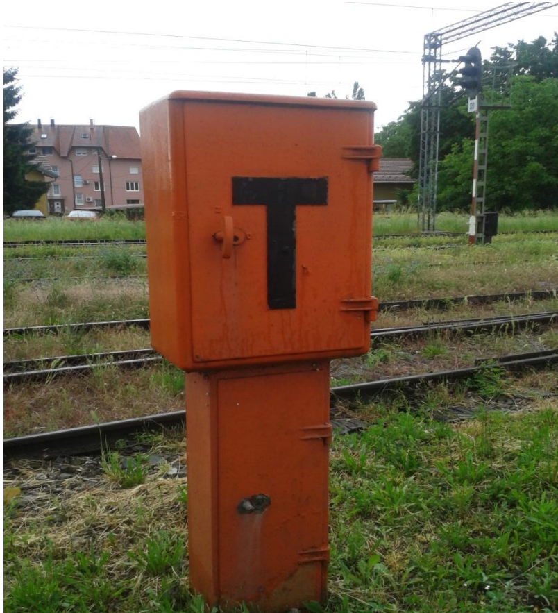
Slika 6. Telefonski ormarić izlaznog signala TORIS

U kolodvoru se nalaze dva razglasna uređaja koji su postavljeni takoda pokrivaju blok I i blok II, te služe da se preko njih daju naređenja ili obavijesti kolodvorskom i strojnom osoblju.