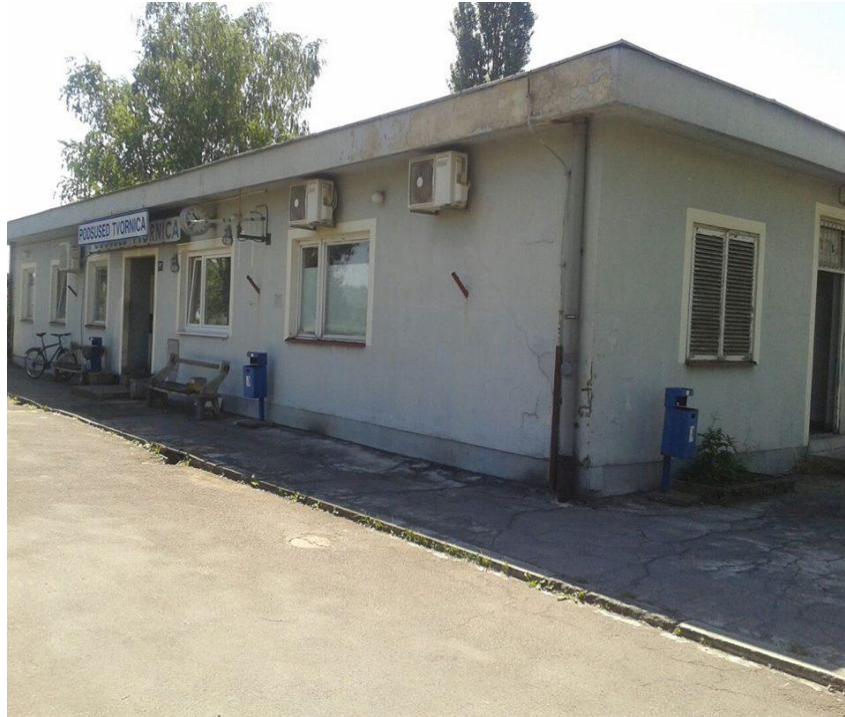
Slika 8. Kolodvorska zgrada Podsused Tvornica