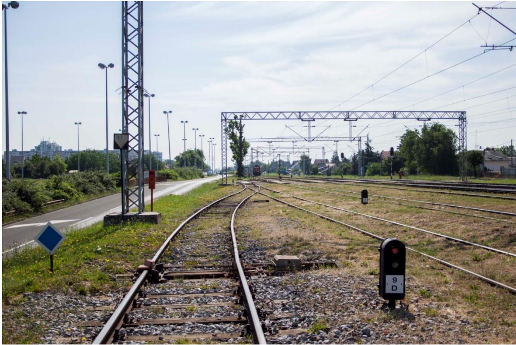
Slika 10. Kolosiječni manevarski signal 9D

Na ulazu u kolodvor od strane Zagreb Zapadnog kolodvora nalazi se ulazni signal A u km 433+093, a na ulazu od strane Zaprešića nalazi se ulazni signal B u km 434+690.