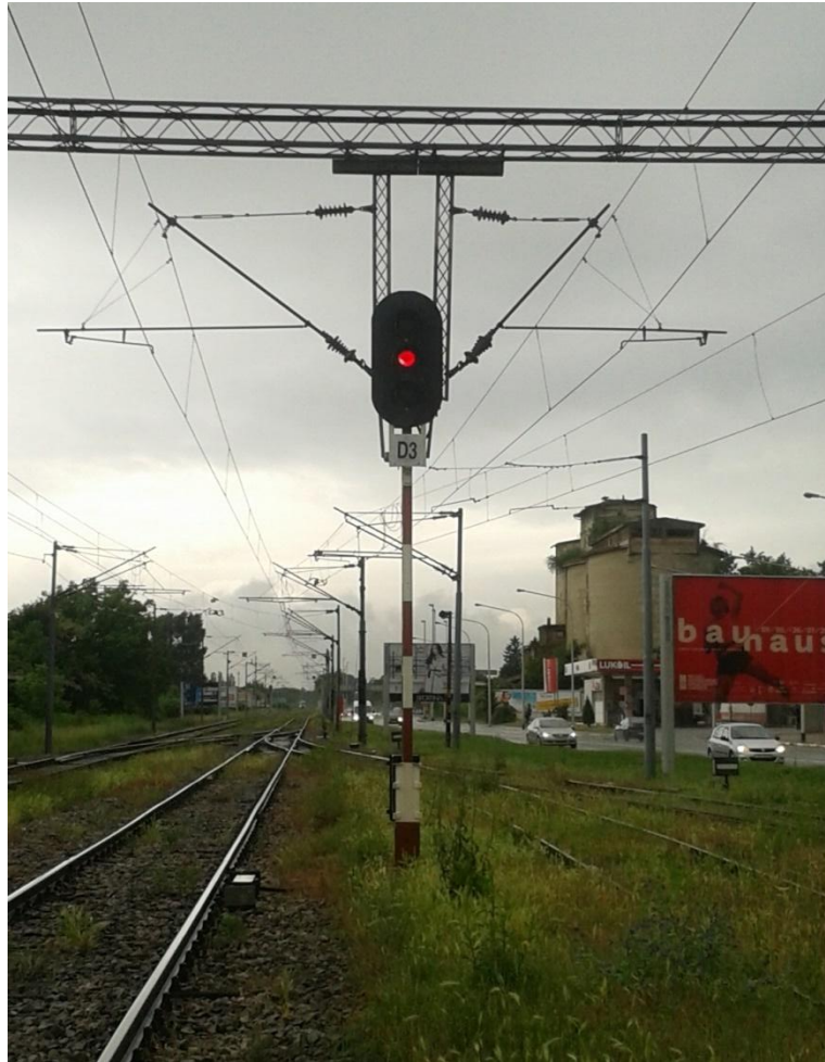
Slika 9 .Izlazni kolosiječni signal D3

Na kolodvoru su ugrađeni i manevarski signali ispred ili iza skretnica, to su 4L, 6L, 7L, 9L i 9D. Njima se osiguravaju manevarski vozni putovi, a kada je neki od njih u ulaznom, izlaznom ili prolaznom voznom putu, onda signalno- sigurnosni uređaj i njih postavlja u položaj „Manevriranje slobodno“.