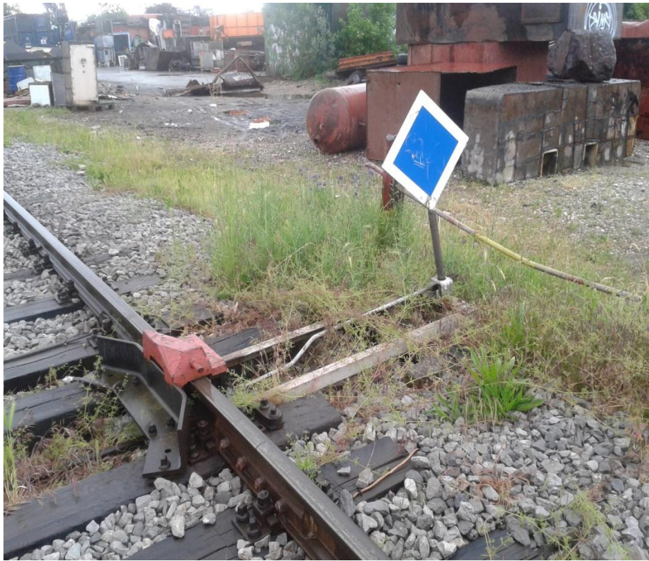
Slika 4. Iskliznica na manipulativnom kolosijeku u kolodvoru Podsused Tvornica

U kolodvorskom području nalaze se tri iskliznice. One se koriste kako se pri slučajnom pomicanju vagona ili kretanja lokomotive nebi ugrozili putovi vožnje.