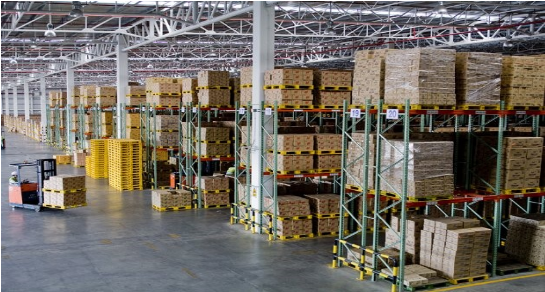
Slika 1. Alternativno skladište

potvrde dokumentacije ovisno o internom dogovoru tvrtke i zakona koji to dozvoljava). 16