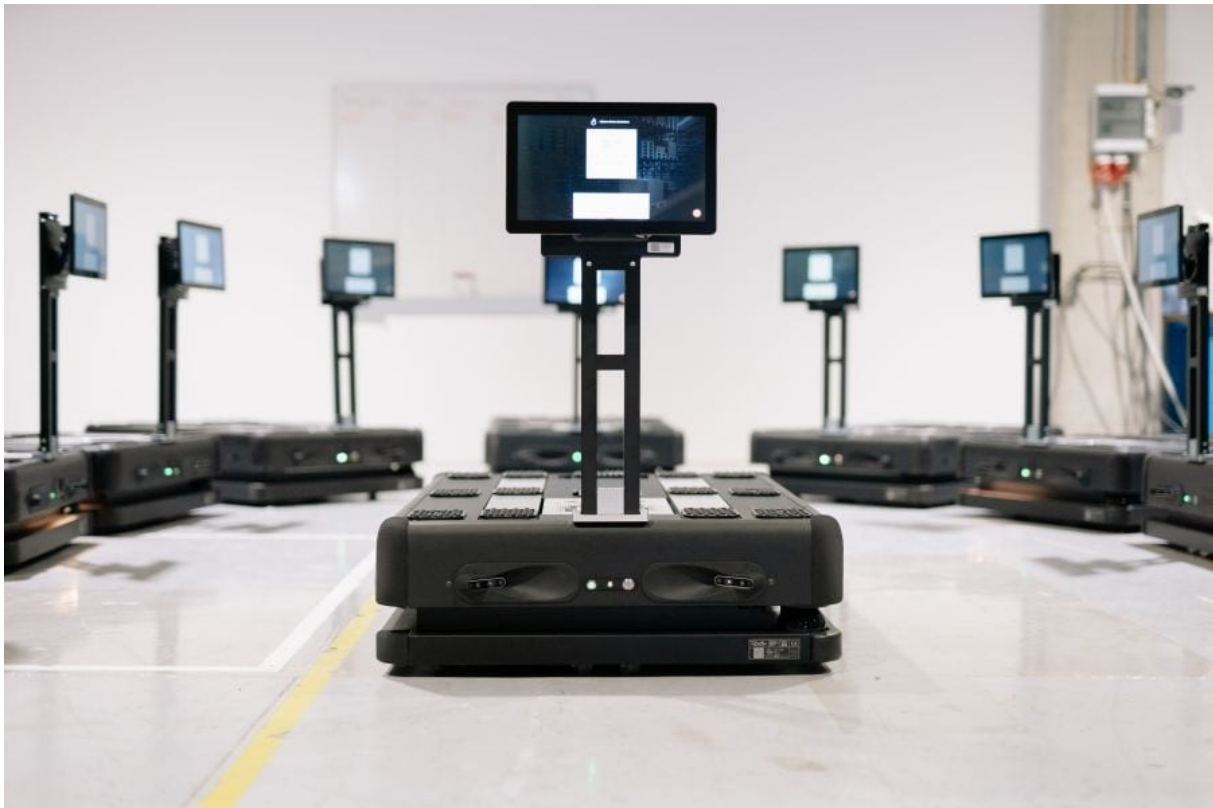
Slika 4. Automatizirano robotsko vozilo tvrtke Gideon Brothers d.o.o.