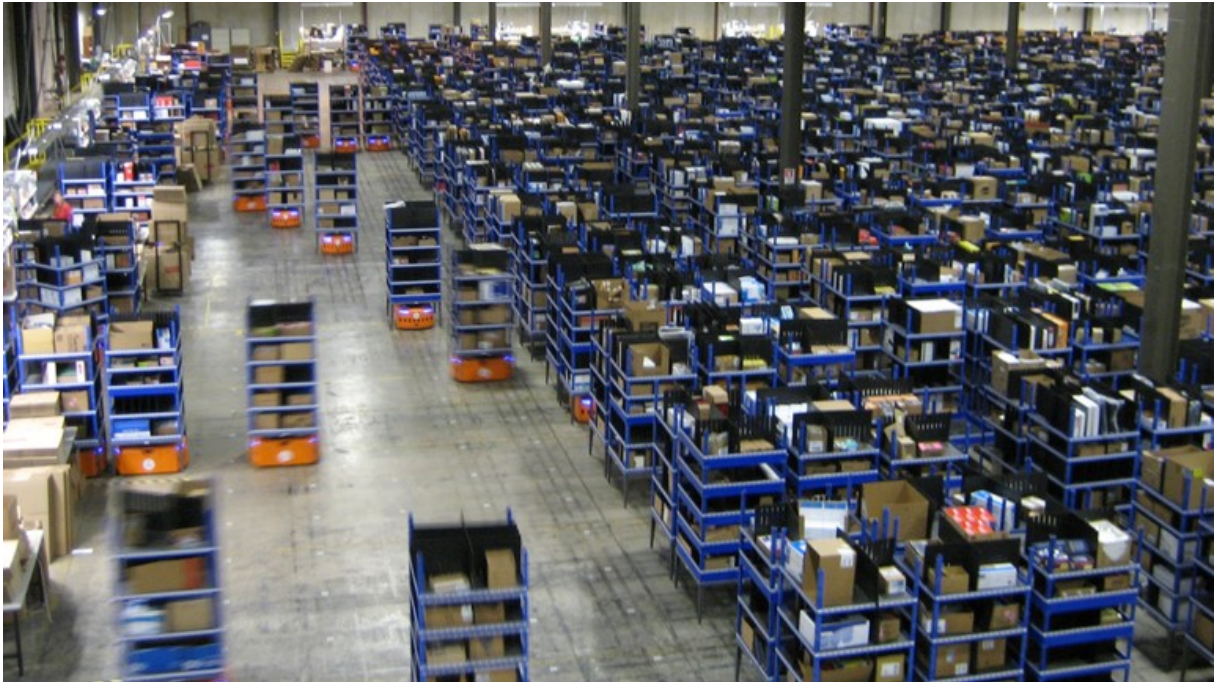
Slika 5. Potpuno automatizirano skladište Amazon.com, Inc. tvrtke

Postoje i druge naredbe poput javljanja robotu da je potrebno posjetiti punjač, a nakon završetka punjenja baterije, šalje naredbu za povratak u rad. 47