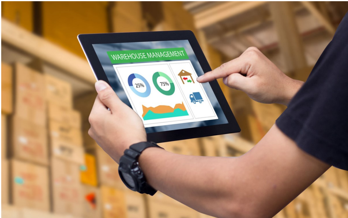
Slika 3. Upravljanje skladištem u svakom trenutku