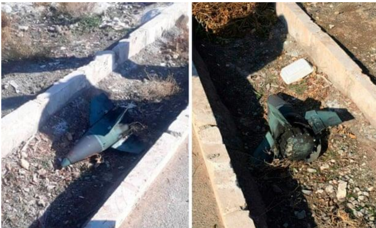
Slika 12. Glava projektila fotografirana u blizini mjesta nesreće, [31]

Prema video snimkama istražni tim je zaključio da drugi projektil nije utjecao na zrakoplov. Mjesto gdje je nađen drugi projektil udaljeno je 900 metara od traga pada zrakoplova, stoga je, prema tome, zaključeno da nije utjecala na zrakoplov.