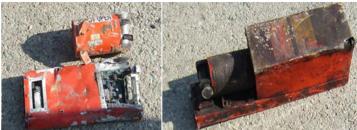
Slika 11. Izgled FDR i CVR nakon nesreće, [29]

Takozvana „crna kutija“ i snimač pilotske kabine također su pronađeni na mjestu nesreće. Na slici 11. prikazan je fizički izgled kako su izgledali nakon nesreće. S lijeve strane je prikazan CVR 8 snimač, a s desne strane je FDR 9 snimač.