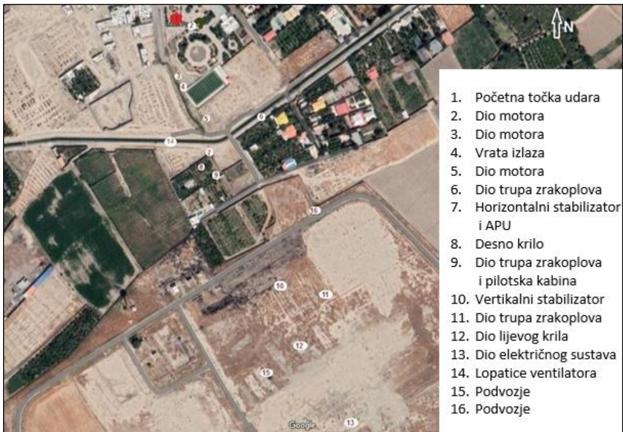
Slika 9. Pregled dijelova zrakoplova na mjestu nesreće, [29]

Dokazi vidljivi na slici 9. i dijelovi prikupljeni od zrakoplova na glavnom mjestu nesreće pokazali su da je zrakoplov još uvijek održavao svoju kompaktnost prije nego što je udario u tlo.