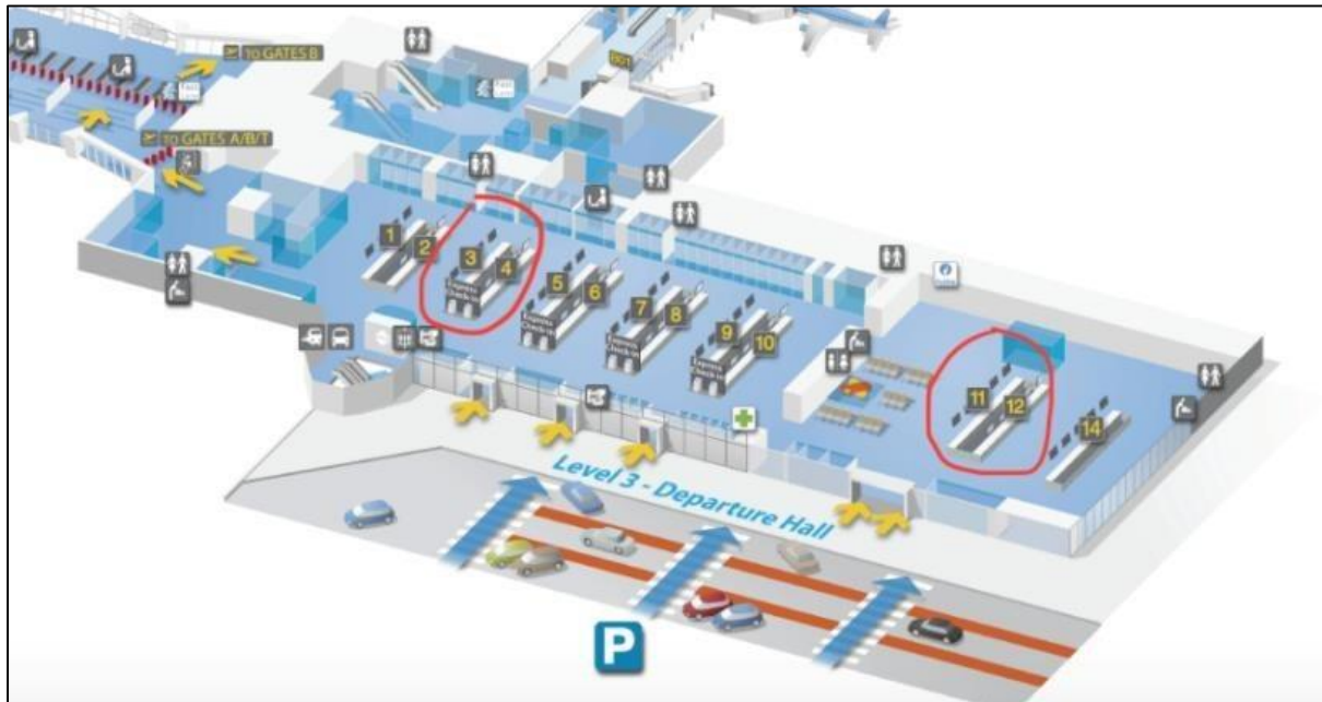
Slika 6. Nacrt prostora za registraciju putnika unutar putničkog terminala 3 zračne luke Zaventem, [23]

Svjedoci koji su vidjeli napadače rekli su da su prije aktiviranja eksplozija, pucali i vikali na arapskom jeziku. Pored jednog poginulog napadača je pronađen kalašnjikov i neiskorišteni pojas eksploziva. Tužiteljstvo je izjavilo da je jedan od terorista ispustio treću torbu u kojoj je bila najveća bomba i pobjegao. Bomba se aktivirala tek kad je došao tim za detonaciju bombi.