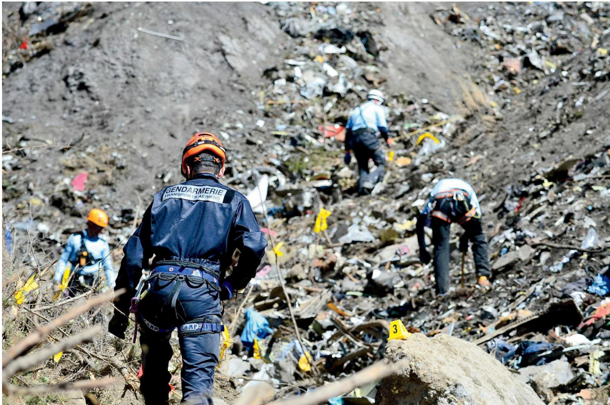
Slika 4. Prikaz označenog mjesta nesreće, [18]

Neophodno je određivanje mjesto prvog udara u zemlju. Prema tome, ali i po raspadanju dijelova, može se odrediti koji dio zrakoplova je prvi udario u zemlju. Također, stazu kretanja ili klizanja zrakoplova pri padu može se odrediti po tragovima u okolini ili oštećenjima na objektima. Po veličini rupe na zemlji se također može zaključiti je li zrakoplov pao vertikalno te je li vozio većom ili manjom brzinom. Na slici 5. iz tragova je vrlo jasno vidljivo da je zrakoplov pao horizontalno pri padu, odnosno da je u pokušaju slijetanja izletio s uzletno sletne staze. Vrlo je važno da se dijelovi zrakoplova ne miču dok se njihove lokacije ne evidentiraju i ucrtaju te dok se na njih ne stave identifikacijske oznake.