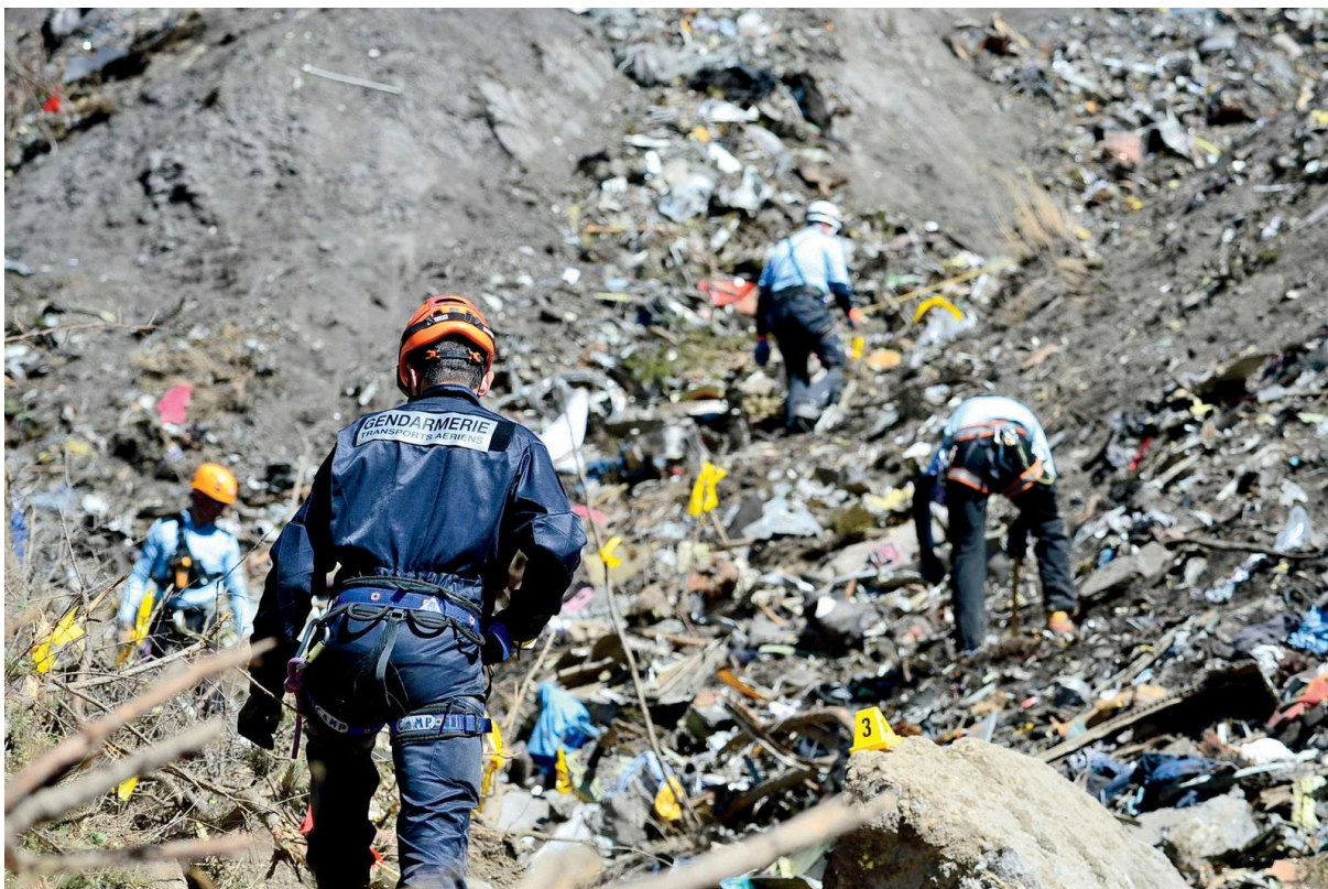
Slika 4. Prikaz označenog mjesta nesreće, [18]

Neophodno je određivanje mjesto prvog udara u zemlju. Prema tome, ali i po raspadanju dijelova, može se odrediti koji dio zrakoplova je prvi udario u zemlju. Također, stazu kretanja ili klizanja zrakoplova pri padu može se odrediti po tragovima u okolini ili oštećenjima na objektima. Po veličini rupe na zemlji se također može zaključiti je li zrakoplov pao vertikalno te je li vozio većom ili manjom brzinom. Na slici 5. iz tragova je vrlo jasno vidljivo da je zrakoplov pao horizontalno pri padu, odnosno da je u pokušaju slijetanja izletio s uzletno sletne staze. Vrlo je važno da se dijelovi zrakoplova ne miču dok se njihove lokacije ne evidentiraju i ucrtaju te dok se na njih ne stave identifikacijske oznake.