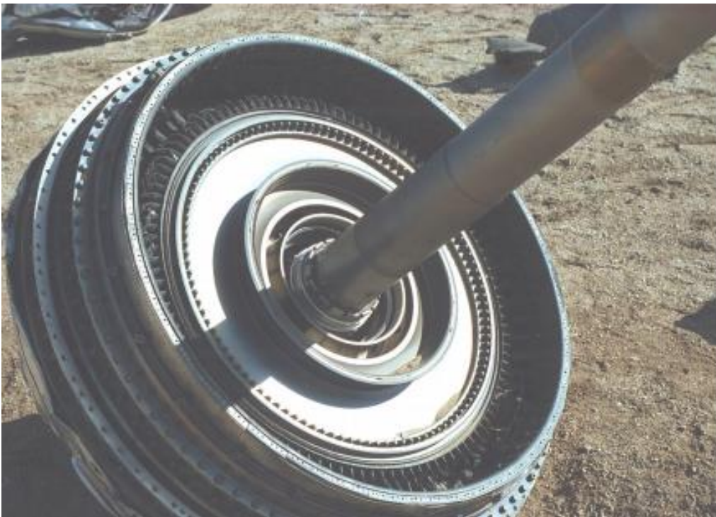
Slika 2. Prikaz fotografiranja bez bljeskalice, [11]

istražni tim dođe na mjesto nesreće, a u tijeku je gašenje i spašavanje, preporučuje se, ako je moguće, da se postavi kamera ili više njih na više točaka kako bi snimale cijeli tijek. Ovakve snimke se koriste kako bi utvrdile štetu i dokaze a mogu se koristiti i za obuku vatrogasnih i spasilačkih službi. Preporuka je ,osim fotografiranja svih dokaza, fotografiranje mjesta nesreće iz zraka, meteorološke uvjete, snimke s radara i podatke kontrole zračne plovidbe. Kako su fotografije bitni materijali za istragu nesreća, bitna je i kvaliteta dobro snimljene fotografije. Na primjer, problem može biti kao na slici 2. koja je fotografirana na jakom sunčevom svjetlu koje je poslužilo kao jedina rasvjeta dok je na slici 3. fotografiran dio zrakoplova pomoću bljeskalice koja je bila dovoljno snažna da osvijetli osjenčana područja s fotografije.