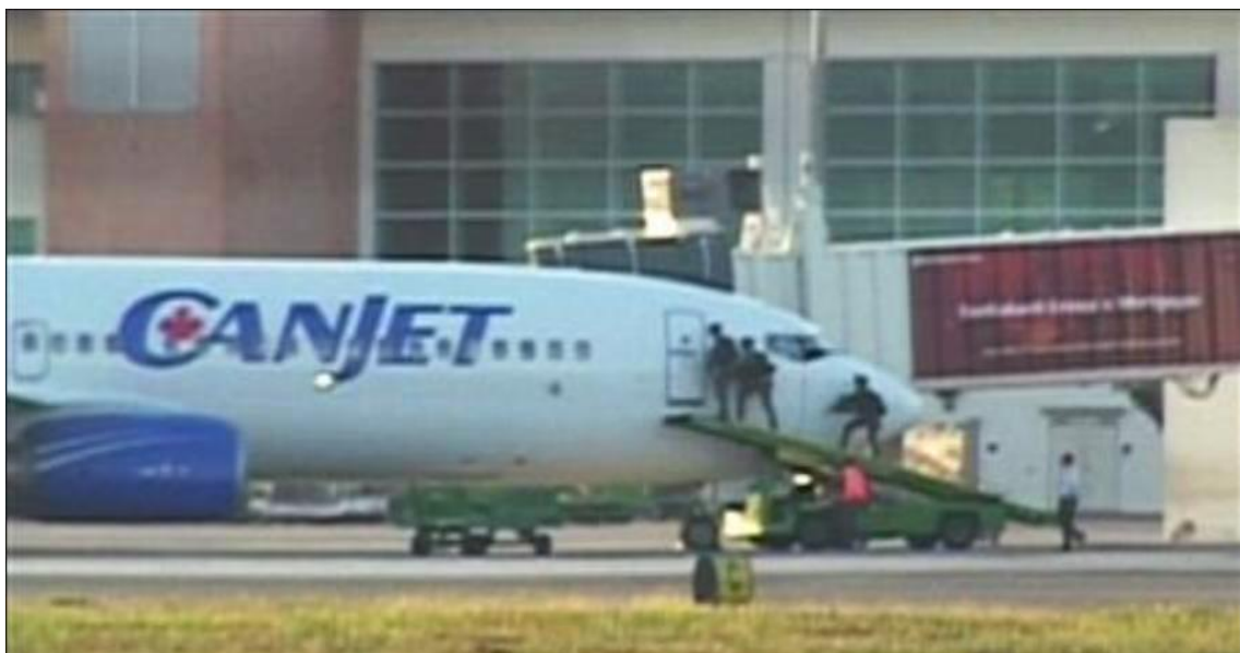
Slika 1. Vojna intervencija u zrakoplov, [6]

Kubu. Na letu je već bilo ukrcano 159 putnika i osam članova posade (dva pilota, pet stjuardesa i službenik osiguranja) te nedugo nakon što su zatvorili vrata zrakoplova, napadač je ušao u zrakoplov. U međuvremenu je napadač iz vatrenog oružja pucao prema zadnjim izlaznim vratima, no nije bilo ozlijeđenih. Jedna od stjuardesa bez razmišljanja je ponudila sav novac, nakit i putovnice napadaču u zamjenu da oslobodi putnike. Vlada tijekom pregovaranja okupila vojnu postrojbu koja je, nakon neuspješnog pregovaranja, ušla u zrakoplov i prisilila napadača da se preda bez ikakvih posljedica (Slika 1.) Ovakav način napada, odnosno djela nezakonitog ometanja, zabrinuo je javnost jer se i pored snažnog osiguranja i sigurnosnih mjera na zračnoj luci dogodio incident.