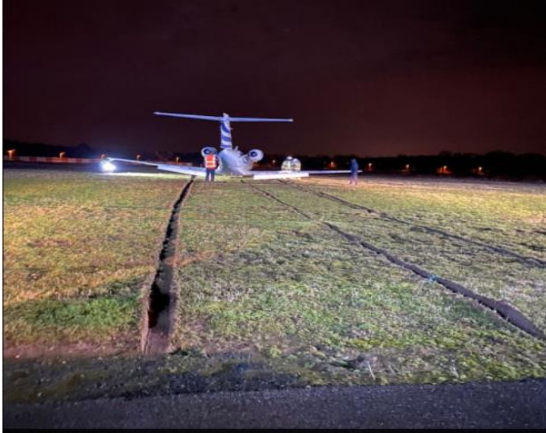
Slika 5. Trag klizanja zrakoplova po zemlji, [19]

Operativna se istraga bavi istraživanjem i izvještavanjem o činjenicama koje se odnose na let, aktivnosti letačke posade prije, tijekom i nakon leta u kojem se dogodila nesreća ili nezgoda. Područja koja se uključuju u operativne istrage su: