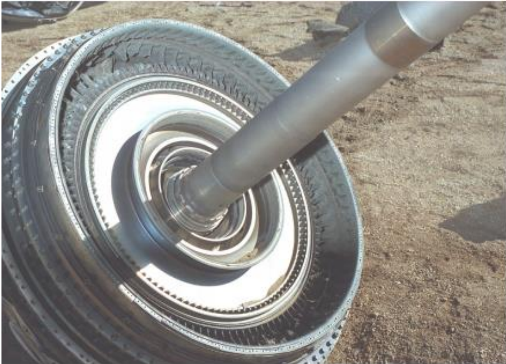
Slika 3. Prikaz fotografiranja s bljeskalicom, [11]

Prilikom dolaska na mjesto nesreće potrebno je pronaći sve glavne dijelove zrakoplova (krila, vertikalni i horizontalni stabilizatori, motori,...). Provjerava se je li moguće odrediti jesu li svi dijelovi zrakoplova bili na njemu kada se dogodila nesreća. Na lici 4. prikazan je primjer označavanja područja gdje se pronađu dijelovi zrakoplova postavljanjem štapova sa zastavom koji se numeriraju. Oznake moraju biti vodootporne i vremenski prihvatljive kako se ne bi obrisale pa se preporučuje korištenje trajnog vodootpornog markera [17].