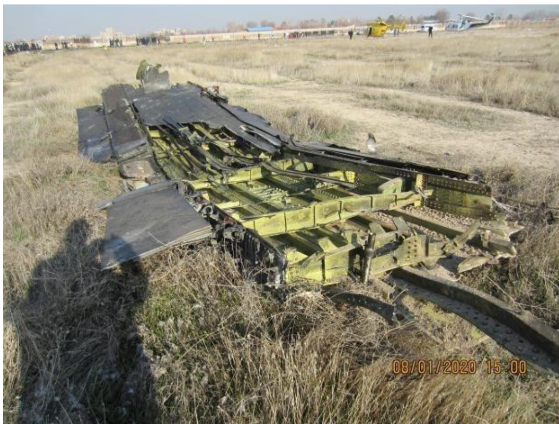
Slika 10. Lijevo krilo na mjestu nesreće, [29]

Dokazi pokazuju ozbiljna oštećenja donjeg dijela nosa zrakoplova, posebno donje polovice pilotske kabine. Gornja polovica pilotske kabine pronađena je na tom mjestu, bez obzira na to što su čak i prozori pilotske kabine i dalje bili na svom mjestu u odgovarajućem okviru (pet od šest ukupno), iz njih se proširilo puno topline. Putnička kabina bila je u potpunosti razbijena. Stražnji dio zrakoplova je bio u cijelosti pri padu na tlo. Veći znakovi požara vide se na prednjoj lijevoj strani zrakoplova i na spoju lijevog krila s trupom te je na gornjoj površini krila bilo više znakova požara nego u donjem dijelu.