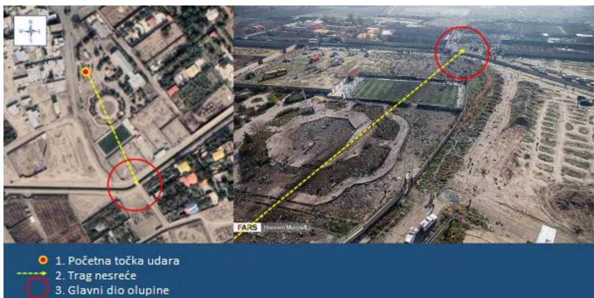
Slika 8. Prikaz početne točke pada na zemlju i klizanje, [29]

Prema snimljenim podacima prikazuje se da je zrakoplov dosegao visinu oko 2.469 metara nakon čega je oznaka pozivnog znaka i nadmorske visine zrakoplova nestala s radara, ali od pilota nije dobivena ni jedna informacija da nešto prikazuje neobične uvjete. Zrakoplov je vodio let prema pravilima leta s instrumentima (IFR 7 ), a nesreća se dogodila oko pola sata prije izlaska sunca. Zrakoplov je bio kompletno uništen pri padu. Osim štete na zrakoplovu, nesreća je prouzročila štetu na javnim dobrima, poput parka i igrališta te privatnih vrtova i imanja. Zrakoplov je pao u blizini naselja zvanog Khalajabad, a početna točka pada zrakoplova bila je u rekreacijskom parku. Trup zrakoplova, nakon što je udario u zemlju, potpuno se raspao nakon prolaska kroz nogometno igralište, što je oštetilo okolna poljoprivredna gospodarstva i vrtove. Nakon početnog udara, drugi su udarci primijećeni duž traga na mjestu nesreće, uništavajući trup i šireći se po cijelom tragu. Na slici 8. prikazan je put traga nakon pada zrakoplova. Vidljivo je kako je pao i klizio uništavajući oko sebe okolinu i posljednju lokaciju olupine nakon pada zrakoplova.