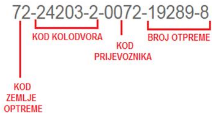
Slika 8 Pojašnjenje broja Vagonskog lista (CIM-a)