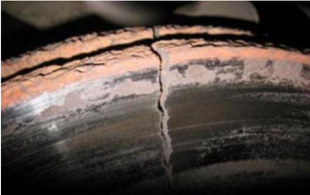
Slika 7. Ispucali kočni disk (Izvor: [8])

Kočne obloge (pakne) ne smiju biti prekomjerno istrošene jer to smanjuje efikasnost kočnja. Kočne poluge ne mogu biti korodirane i deformirane. Velika opasnost kod bubanj kočnica je pojava maziva i ulja jer na taj način se smanjuje trenje između tarnih površina. Kod disk kočnica gleda se izbrazdanost diskova, njihova ispucanost i potrošenost (slika 7). [8]