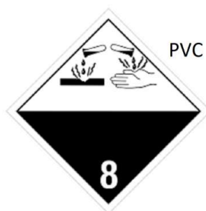
Slika 9 Listica opasnosti klase 8

Pripadajuće listice opasnosti prikazane su na slici 9.