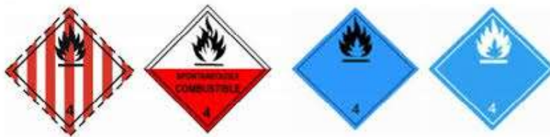
Slika 5 Listice opasnosti klase 4

Pripadajuće listice za ovu klasu prikazane su na slici 5.