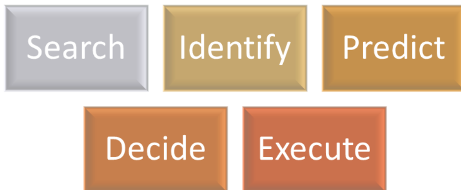
Slika 5. Sposobnosti za sigurnu vožnju

Postoje sposobnosti koje su potrebne za sigurnu vožnju (SIPDE), a to su: traži, identificiraj, predvidi, odluči, izvrši.