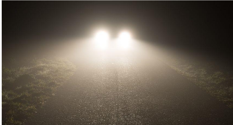
Slika 5. Bljesak automobila iz suprotnog smjera