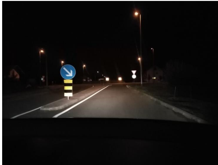
Slika 6. Vidljivost prometnih znakova noću

postavljanja. Ovisi o vrsti materijala, jačini svjetla kojim se osvjetljava, položaju znaka i sl. Poseban utjecaj ima refleksijska efikasnost koja se najviše odnosi na sjajnost simbola i osnove, odnosno njihovog odnosa, što je ponajviše važno za vidljivost i čitljivost znaka. [6]