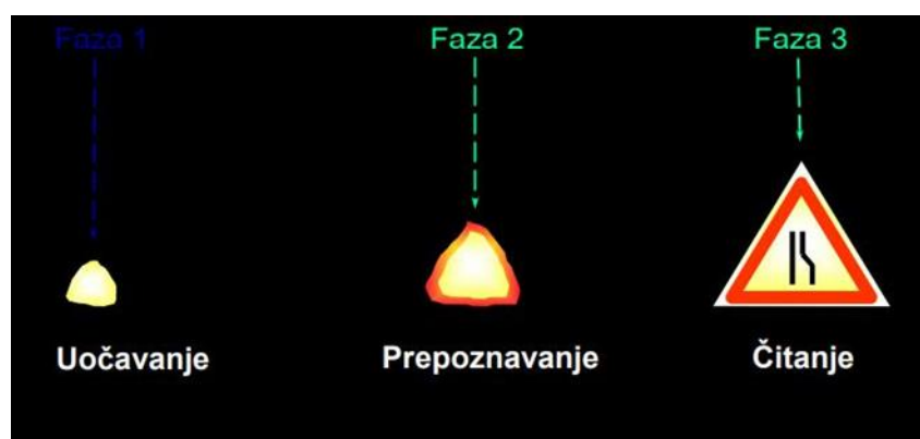
Slika 3. Faze percepcije prometnih znakova

Zahtjevi koje prometni znakovi moraju zadovoljiti: čitljivost, razumljivost, jednoobraznost, uniformiranost, jednostavnost, kontinuiranost, konstantnosti i uočljivost.