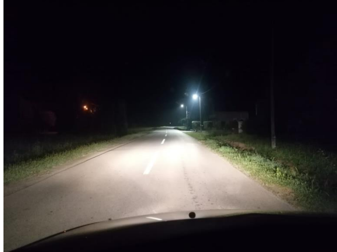
Slika 7. Cestovna rasvjeta

Cestovna rasvjeta mora omogućiti takve uvjete viđenja noću koji jamče vozačima motornih, zaprežnih i drugih vozila te biciklistima što sigurniju vožnju, a pješacima zapažanje potencijalne opasnosti i važnih detalja njihove vidne okoline te stjecanje dojma opće sigurnosti pri kretanju prometnicom (Slika 6.).