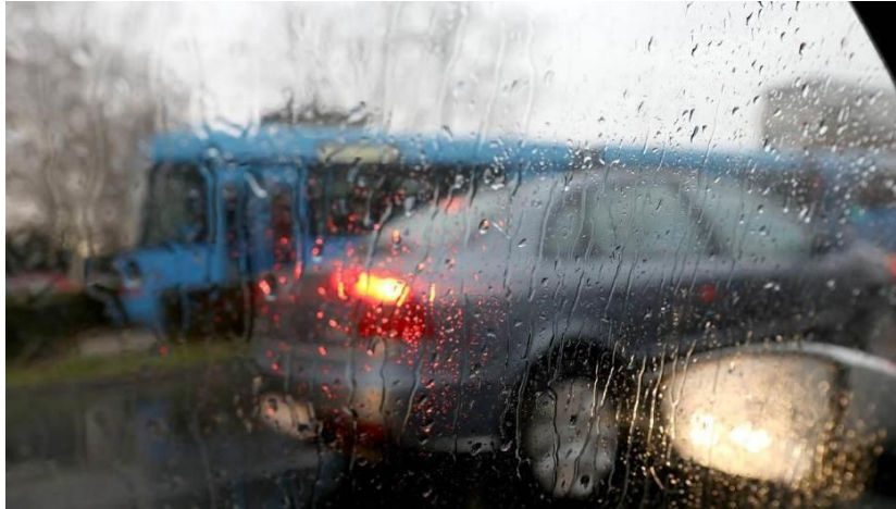
Slika 2. Percepcija u uvjetima otežane vidljivosti