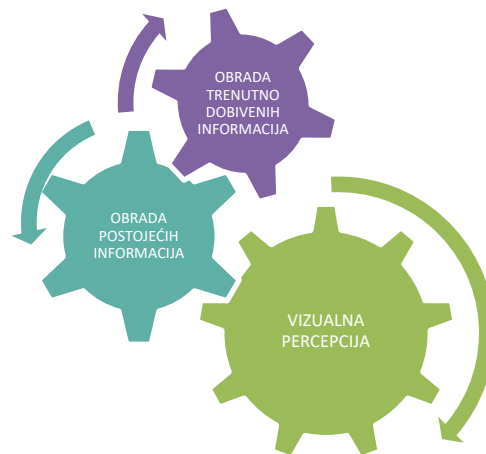
Slika 1. Vizualna percepcija

Proces vizualne percepcije je sposobnost tumačenja okruženja obradom podataka koji se nalaze u vidljivom svjetlu, a sastoji se od dva procesa obrade informacija: obrada trenutno dobivenih i postojećih informacija kao što je prikazano na slici 1. [3].