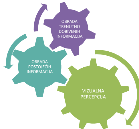
Slika 1. Vizualna percepcija

Proces vizualne percepcije je sposobnost tumačenja okruženja obradom podataka koji se nalaze u vidljivom svjetlu, a sastoji se od dva procesa obrade informacija: obrada trenutno dobivenih i postojećih informacija kao što je prikazano na slici 1. [3].