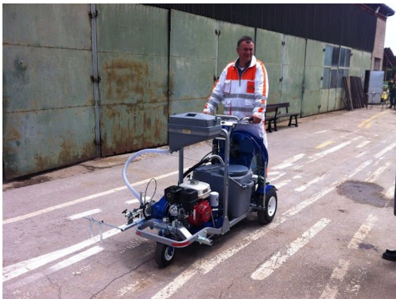
Slika 3. Stroj manjeg kapaciteta za izvođenje bojanih oznaka na kolniku Izvor: [12]