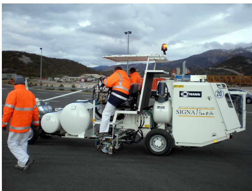
Slika 4. Stroj većeg kapaciteta za izvođenje bojanih oznaka na kolniku