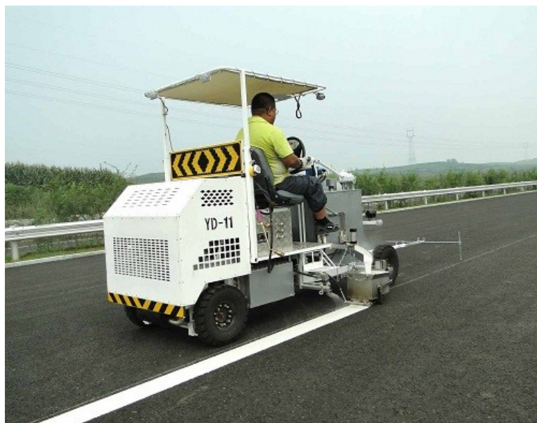
Slika 5. Proces nanošenja termoplastičnih oznaka ekstruzijom

Za razliku od termoplastike koja se na kolnik nanosi pri povišenim temperaturama, hladna se plastika, kako joj i samo ime govori, nanosi hladna. Njezina je priprema za nanošenje nešto jednostavnija, a sastoji se od miješanja dvije odvojene komponente, odnosno dva reaktanta. Te se komponente, ovisno o proizvođaču, mogu miješati u različitim omjerima, primjerice to mogu biti omjeri 50 : 50, 98 : 2 i slično [15]. Nakon što su komponente dobro izmiješane, hladna je plastika spremna za nanošenje. Kod hladne se plastike, kao i kod termoplastike, retroreflektirajući elementi nanose i prilikom proizvodnje i tijekom nanošenja na kolnik kako bi se osigurala što duža trajnost i učinkovitost oznaka. Prilikom nanošenja oznake na kolnik, kolnička podloga mora biti suha, a prednost je hladne plastike (u odnosu na termoplastiku) što u tolikoj mjeri nije osjetljiva na vanjske utjecaje te se može nanositi na kolnik pri različitim temperaturama. Time se osigurava duži vremenski period tijekom godine u kojem je omogućeno izvođenje takvih oznaka [16]. Dodatna joj je prednost i to što jednako dobro prianja i na asfaltne i na betonske površine [15].