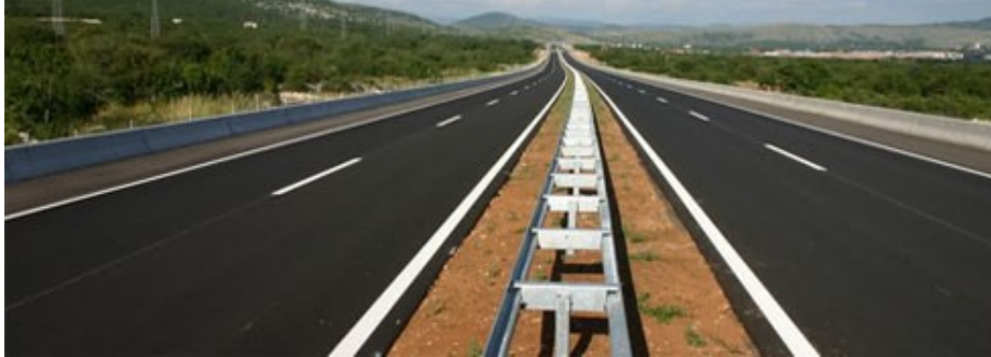
Slika 1. Prikaz uzdužnih oznaka na kolniku

prometne trakove i vožnja po njoj. Isprekidane crte označavaju prestanak zabrane prelaska vozila preko te crte i kao razdjelna se linija koriste na dijelovima ceste na kojima je dopušteno pretjecanje vozila. Dvostruka se crta može izvoditi kao dvostruka isprekidana, dvostruka puna i dvostruka kombinirana [1]. Na slici 4. su prikazane karakteristične uzdužne oznake na kolnicima autoceste.