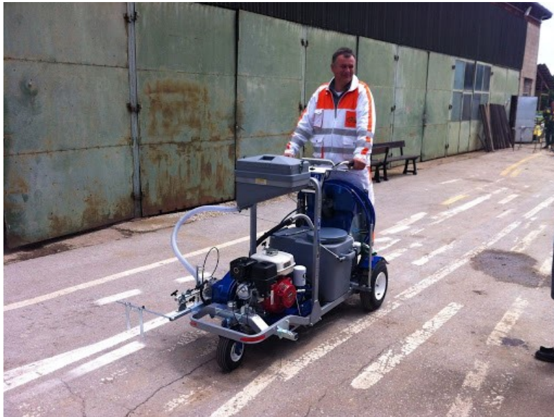
Slika 3. Stroj manjeg kapaciteta za izvođenje bojanih oznaka na kolniku