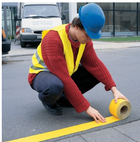
Slika 6. Pričvršćivanje trake na kolničku površinu

Trajnim se trakama smatraju sve one čiji je vijek trajanja duži od godinu dana i takve se trake najčešće postavljaju na nove asfaltne površine. Privremene se trake upotrebljavaju za izradu privremene regulacije prometa i najčešće se lijepe na površinu kolnika. Najveća je razlika, u odnosu na trajne trake, to što privremene trake u sebi imaju ugrađenu armaturnu mrežicu koja olakšava uklanjanje oznaka [11]. Postupak pričvršćivanja trake na kolničku površinu prikazan je na slici 9.