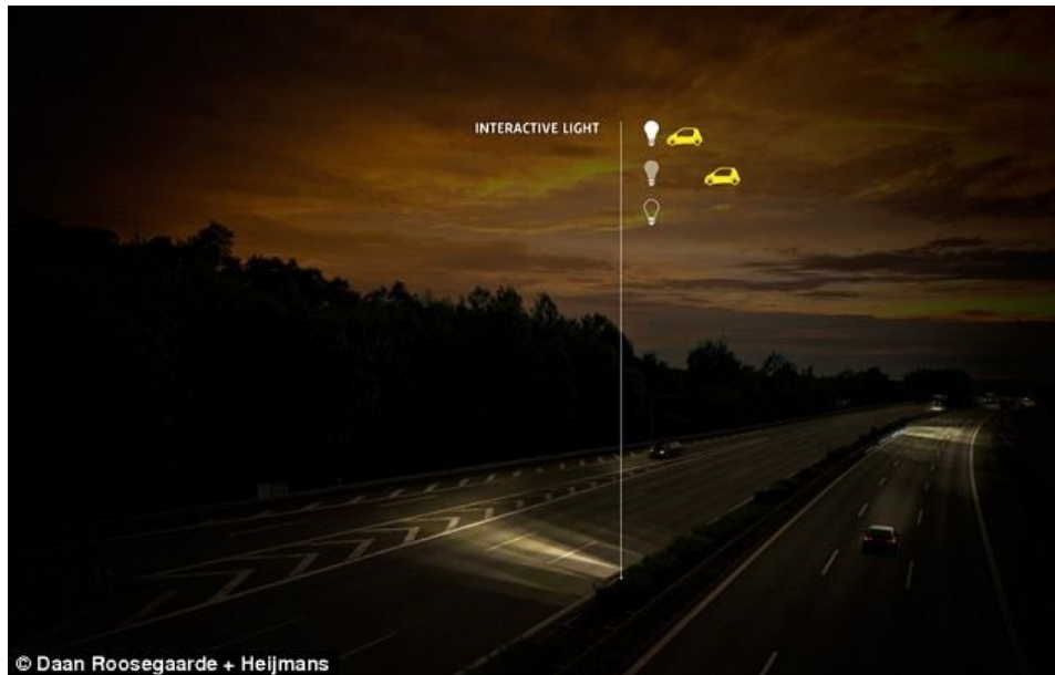
Slika 15. Posebna interaktivna rasvjeta prometnice

energije i snage vjetra, uključujući i vjetar kojeg stvaraju vozila. Tako je potpuno isključivanje svjetala na važnijim cestama britanskoj Agenciji za autoceste samo u 2011. godini uštedjelo oko 400 tisuća funti [25].