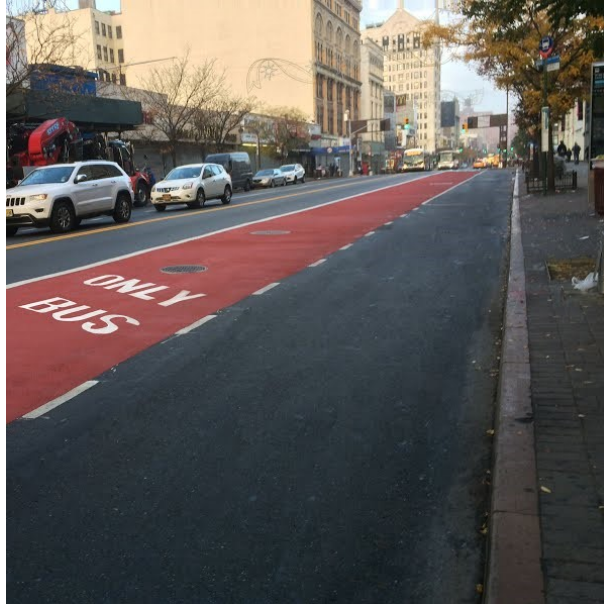
Slika 10. Crvene oznake za označavanje trakova kojima se kreću vozila javnog prijevoza

Crvena se boja obično koristi za upozorenja i zabrane te zbog toga privlači pažnju većeg broja ljudi. S obzirom na to da velik broj vozača ne poštuje zabranu kretanja trakovima namijenjenim javnom gradskom prijevozu, predlaže se obilježavanje istih crvenom bojom (Slika 10.). Takav način obilježavanja već se primjenjuje u nekim gradovima SAD-a [21].