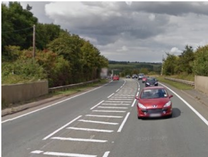
Slika 7. Oznake namijenjene optičkom sužavanju prometnih trakova na sredini kolnika

sužavanje kolnika, stručnjaci iz SAD-a osmislili su rješenje prema kojemu se područje raspoloživo za kretanje vozila optički može sužiti i „prisiliti“ vozače na smanjenje brzine. Osim što će utjecati na brzinu vožnje, iscrtavanje takvih oznaka stvorit će razdjelni pojas između dva smjera kretanja, ako se oznake izvode na sredini kolnika, te će se spriječiti pretjerano približavanje vozila tijekom mimoilaženja što je na poseban način povoljno tijekom vožnje u zavojima. Isto tako, smanjit će se i pretjerano približavanje rubu kolnika što će smanjiti rizik od izlijetanja vozila s ceste. Na području SAD-a je 2008. godine provedeno istraživanje na ruralnim dvotračnim cestama na kojima se promet odvija u dva smjera. Na tim su cestama, na lokacijama koje mogu biti potencijalno opasne, rubni ili središnji dio kolnika prekriveni oznakama na kolniku čime je cesta optički sužena. Ispitanici su se vozili istom dionicom prije i nakon postavljanja takvih oznaka, a rezultati pokazuju smanjenje brzine kretanja od 5,5 do 7,5 km/h za sva vozila, odnosno od 7 do 8 km/h za teretna vozila nakon postavljanja oznaka [18]. Način iscrtavanja oznaka na kolniku namijenjenih optičkom sužavanju prometnih trakovima prikazan je na slikama 7. i 8.