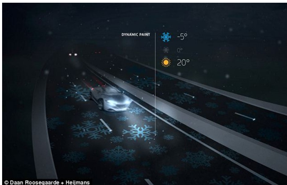
Slika 13. Prikaz upozorenja o mogućoj poledici na kolniku

Uz već ranije navedene mogućnosti koje pruža „pametna cesta“ nadograđene su i neke nove. Jedna od njih je vezana uz električne automobile kojima vožnja „pametnom cestom“ omogućuje punjenje pomoću posebnog magnetskog polja. Takva moderna autocesta koja prvih nekoliko stotina metara svijetli u mraku i odašilje upozorenja vozačima na svojoj površini izgrađena je u pokrajini Brabant sredinom 2013. godine [25].