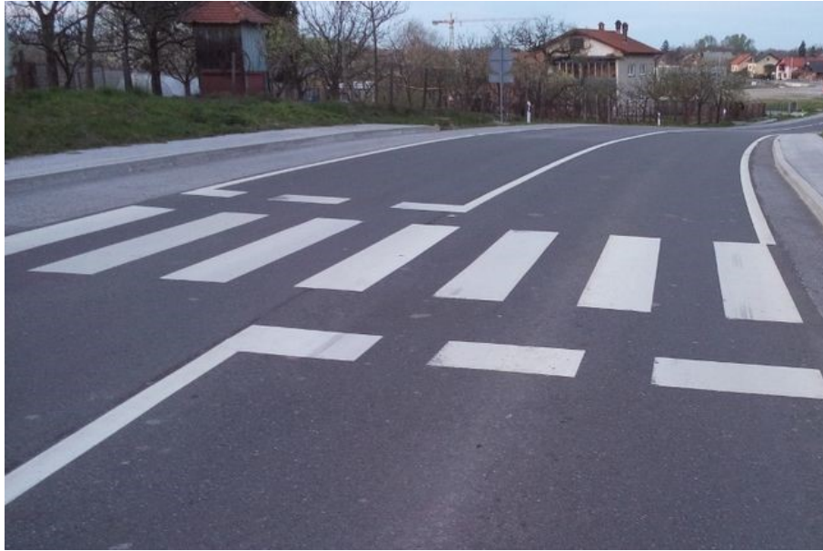
Slika 2. Primjer poprečnih oznaka na kolniku

U ostale se oznake na kolniku ubrajaju sve one oznake koje prema svojoj funkciji i izgledu ne pripadaju ni uzdužnim ni poprečnim oznakama, a to su [1]: