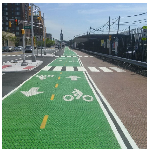
Slika 9. Zelene oznake za obilježavanje površina namijenjenih kretanju biciklista Izvor: [22]

Zelena bi se boja, tako, koristila za obilježavanje površina namijenjenih kretanju biciklista (Slika 9.). To bi omogućilo lakše razlikovanje površina za bicikliste od površina namijenjenih kretanju vozila i pješaka te bi se time povećala i njihova sigurnost [21].