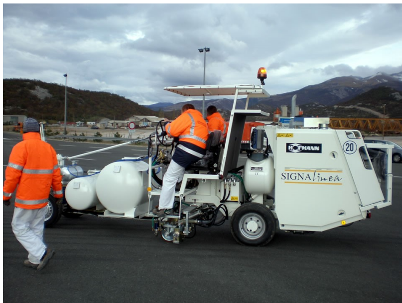
Slika 4. Stroj većeg kapaciteta za izvođenje bojanih oznaka na kolniku