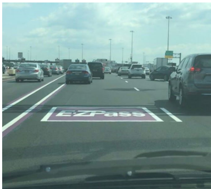
Slika 11. Ljubičaste oznake namijenjene obilježavanju trakova za vozila koja naknadu za korištenje ceste plaćaju elektronski