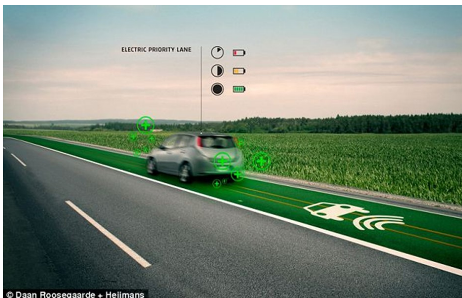
Slika 14. Prikaz prometne trake predviđene za punjenje električnih automobila

Uz već ranije navedene mogućnosti koje pruža „pametna cesta“ nadograđene su i neke nove. Jedna od njih je vezana uz električne automobile kojima vožnja „pametnom cestom“ omogućuje punjenje pomoću posebnog magnetskog polja. Takva moderna autocesta koja prvih nekoliko stotina metara svijetli u mraku i odašilje upozorenja vozačima na svojoj površini izgrađena je u pokrajini Brabant sredinom 2013. godine [25].