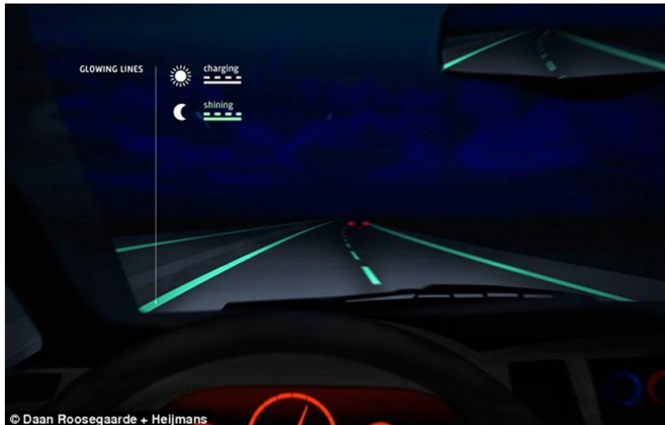
Slika 12. Prikaz „pametne“ ceste koja „svijetli u mraku“

zamjenjuje tradicionalnu boju kojom se izvode oznake na kolniku. Taj prah akumulira sunčevu svjetlost, a ona mu omogućava i do deset sati „rada“ tijekom noći [25].