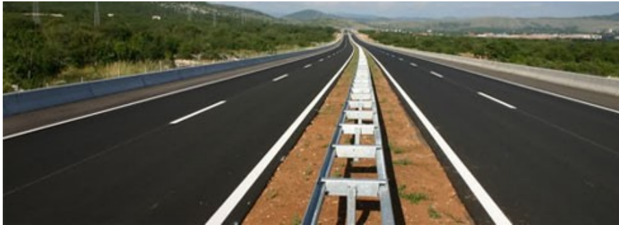
Slika 1. Prikaz uzdužnih oznaka na kolniku

prometne trakove i vožnja po njoj. Isprekidane crte označavaju prestanak zabrane prelaska vozila preko te crte i kao razdjelna se linija koriste na dijelovima ceste na kojima je dopušteno pretjecanje vozila. Dvostruka se crta može izvoditi kao dvostruka isprekidana, dvostruka puna i dvostruka kombinirana [1]. Na slici 4. su prikazane karakteristične uzdužne oznake na kolnicima autoceste.