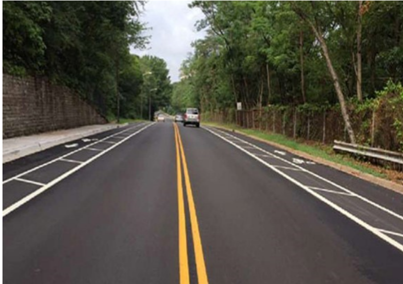
Slika 8. Oznake namijenjene optičkom sužavanju prometnih trakova uz rub kolnika

Tvrtka SEH sa sjedištem u St. Paulu, Minnesota, SAD kao inovativno rješenje za stvaranje sigurnijeg prometa predlaže uvođenje netipičnih boja u oznake na kolniku. Smatraju da bi se takvim označavanjem cesta omogućilo lakše snalaženje sudionika i jednostavnije upravljanje prometom u gradu. Uz standardne bijele i žute oznake koje su najraširenije u svijetu, oni predlažu uvođenje zelene, crvene i ljubičaste boje za posebne namjene [21].