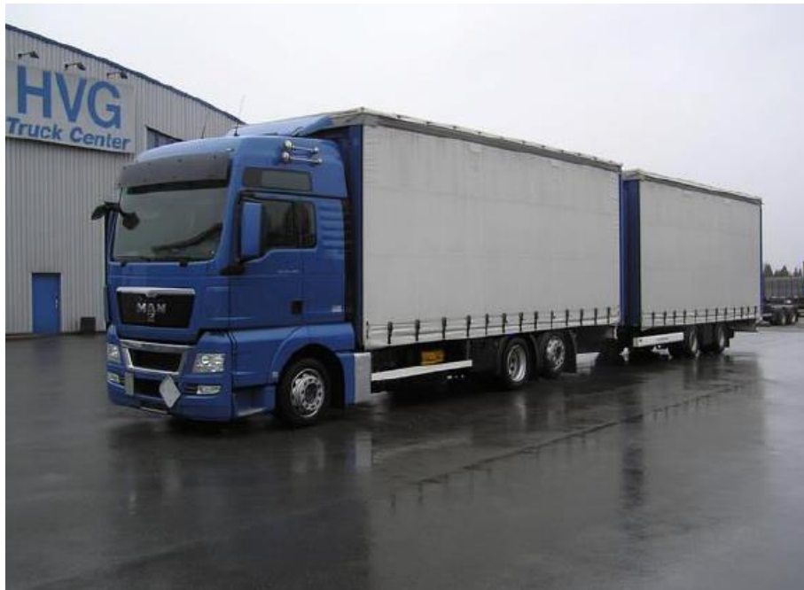
Slika 20. Kamion s tri osovine i prikolica s dvije osovine

Na slici 20. je prikazan kamion s tri osovine i prikolica s dvije osovine.