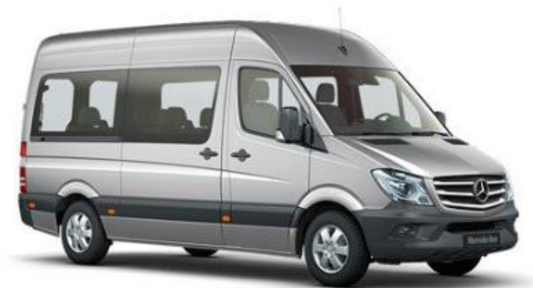
Slika 17. Kombi vozilo