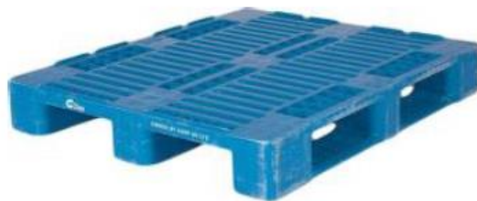
Slika 4. Aluminijska paleta 1200mmx800mm

Na slici 4. je prikazana aluminijska paleta.