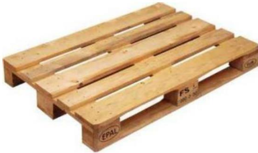
Slika 2. Ravna paleta (EUR - EPAL)