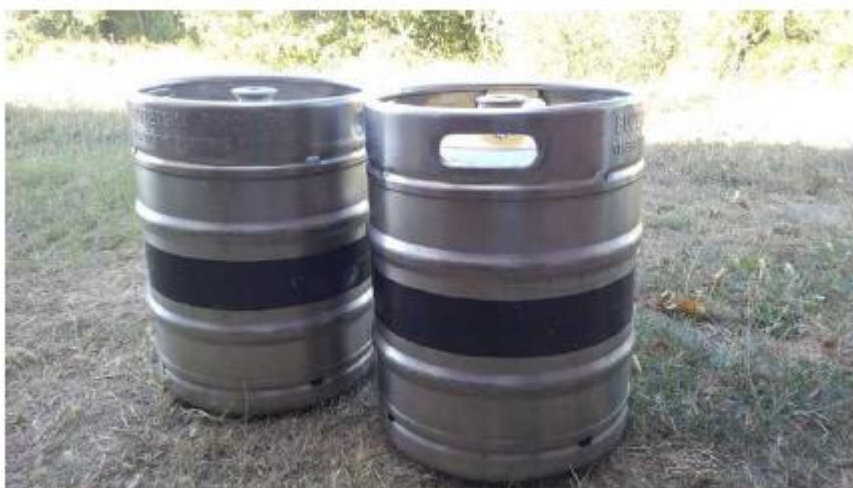
Slika 9. Bačve za prijevoz piva

Kontejneri su teretno – manipulativne jedinice u kojima se može prevoziti druge transportno manipulativne jedinice sa svojim teretom. Teret se smješta u njihov zatvoreni prostor. Kod kontejnera valja spomenuti i višenamjenske bačve. Bačve se također razlikuju po svojim dimenzijama i po materijalu od kojih su napravljene. Na slici 9. su prikazane bačve za prijevoz piva [2].