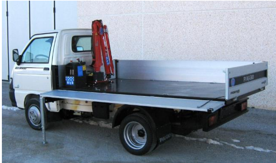
Slika 12. Vozilo sa hidrauličnom dizalicom