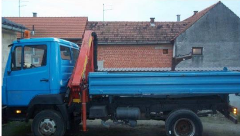
Slika 15. Mercedes 814 sa kranom