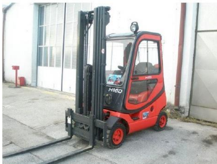
Slika 13. LINE HD16 viličar