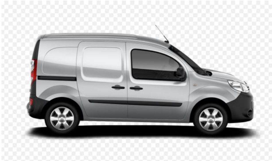
Slika 16. Malo dostavno vozilo