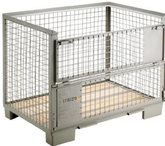
Slika 3. Boks paleta