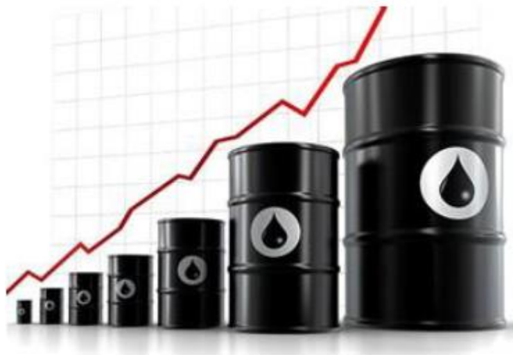
Slika 10. Primjer bačvi za prijevoz naftnih derivata