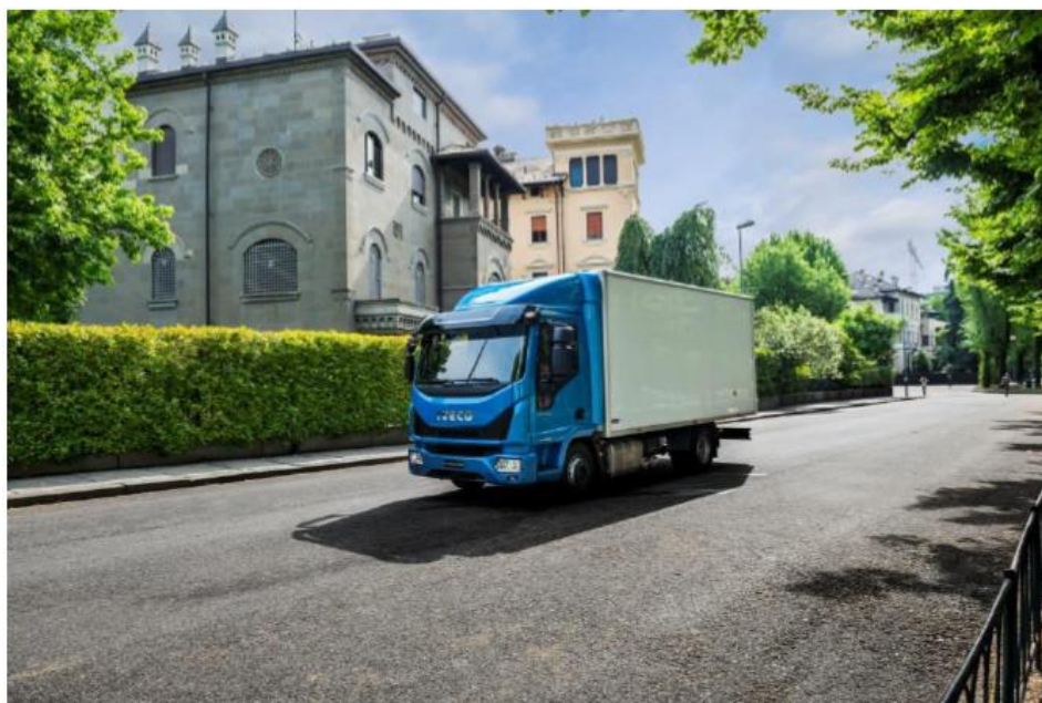
Slika 19. kamion s dvije osovine bez prikolice