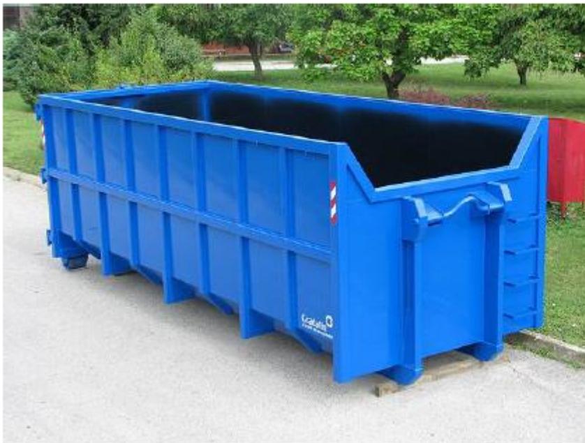
Slika 8. Otvoreni tip kontejnera