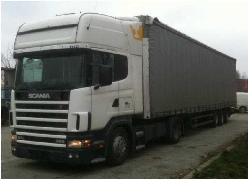
Slika 21. Tegljač s dvije osovine i poluprikolica s tri osovine