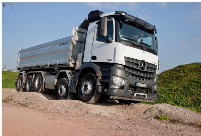
Slika 18. „Kiper“ kamion

Na slici 18. je prikazan „kiper“ kamion.