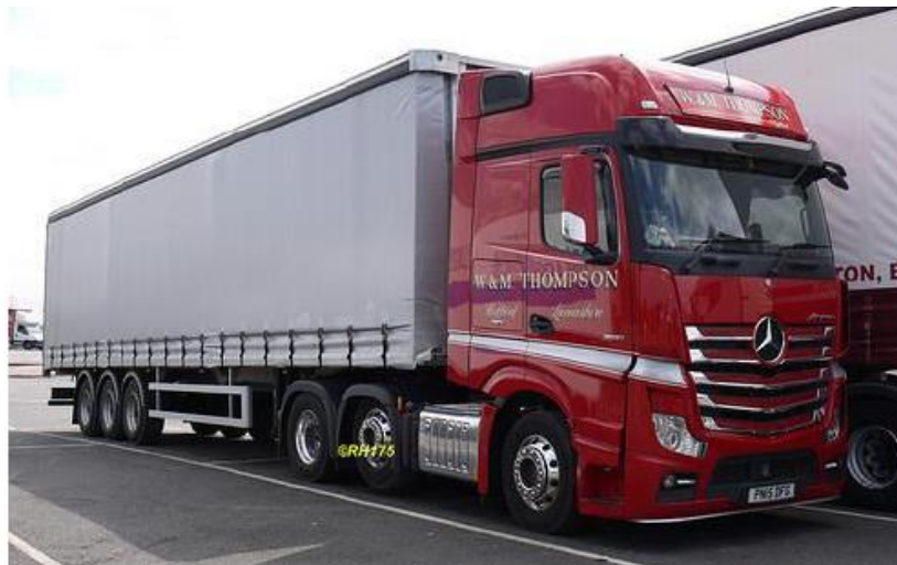
Slika 22. Tegljač s tri osovine i poluprikolica s tri osovine

Na slici 22. je prikazan tegljač s tri osovine i poluprikolica s tri osovine.