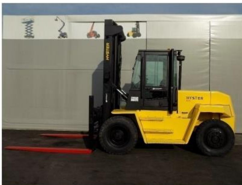
Slika 14. Hyster viličar