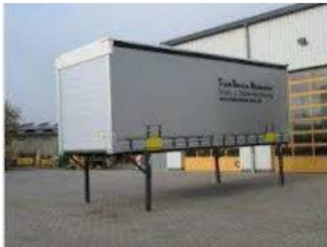
Slika 11. Izmjenjivi transportni sanduk

Izmjenjivi transportni sanduci odvojene su nadgradnje od cestovnih tovarnih vozila, odnosno priključnih vozila. Radi se o sanduku cestovnog tovarnog vozila, prikolice ili poluprikolice, koji se zahvaljujući posebnoj konstrukcijskoj izvedbi može odvojiti od podvoza samog vozila. Na slici 11. je prikazana izmjenjivi transportni sanduk [2].