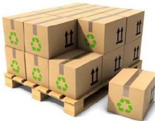
Slika 5. Paketi

Glavno obilježje paketa i paketizacije je u tome što ambalaža kao osnovni element paketizacije poslije odrađenog procesa postaje suvišna. Paketiranje omogućuje optimalno iskorištavanje transportnih sredstava s obzirom na njihove gabaritne dimenzije. Na slici 5. su prikazani paketi [7].