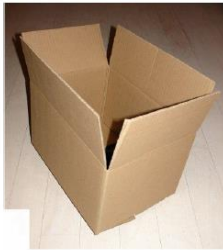
Slika 6. Kartonska kutija

Kartonske kutije imaju široku primjenu, ali u većini slučajeva se one nakon obavljanja transporta odlažu i uništavaju zbog svoje slabe tvrdoće i loše otpornosti materijala od kojih su proizvedene na vlažnost i masu tereta koji se prevozi. Kartonske kutije su dostupne u više dimenzija ovisno o potrebama i namjeni. Ukoliko su kutije uništene fizičkim djelovanjem materijal se naknadno može iskoristiti za reciklažu i proizvodnju novih. Na slici 6. je prikazana kartonska kutija, a na slici 7. je prikazana plastična gajba [7].