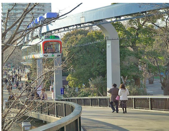
Slika 9. Model visećeg monoraila Ueno Zoo, Tokio, Japan, [9]