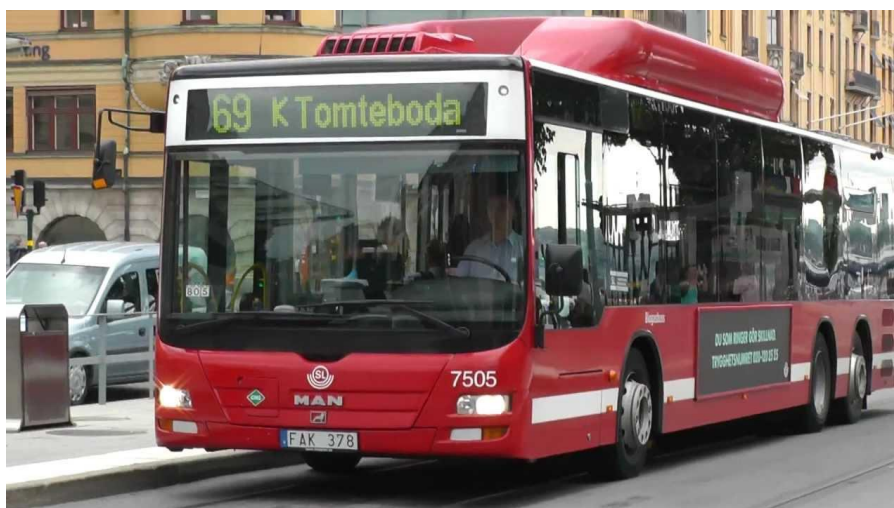
Slika 2. Model autobusa MAN NL, [2]

Kreće se po određenim rutama unutar postojeće gradske cestovne mreže uz mogućnost izmjena ruta uslijed promjene prometne regulacije uzrokovane raznim okolnostima, primjerice prometne nezgode, radova na cesti, političkih, sportskih ili kulturnih događanja.