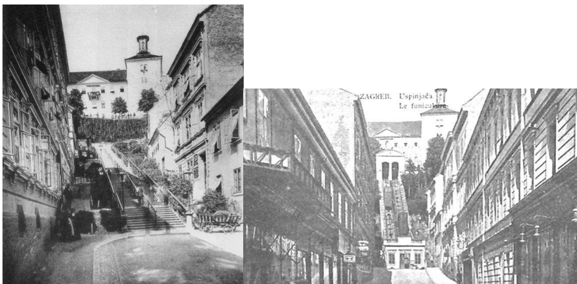
Slika 11. Tomičeva ulica, lokacija zagrebačke Uspinjače prije i nakon izgradnje, Zagreb, [11]

Uspinjača je sagrađena kao kosi vijadukt od osam polukružnih otvora duljine 2,5 metra, od opeke s vapnenim mortom. Usprkos kontinuiranom mehaničkom opterećenju, ta prastara konstrukcija do današnjih dana nije pokazala znakove bilo kakvih tehničkih deformacija, a u nekima od onih polukružnih otvora danas su umjetničke galerije i prodavaonice suvenira. Na betonskoj površini vijadukta nalaze se dva kolosjeka (na svakom se nalazi jedan vagon) s tračnicama duljine 66 metara i širine 1200 mm. Vučno užje je promjera 22 mm. [1]