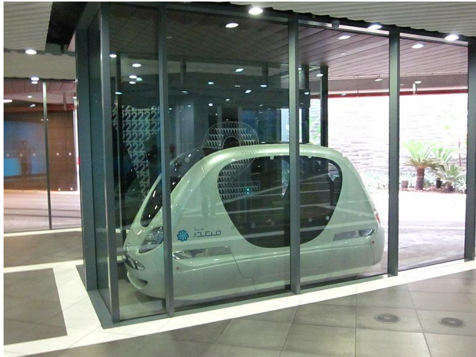
Slika 15. PRT PodCar, Masdar City, Ujed. Arap. Emirati, [15]