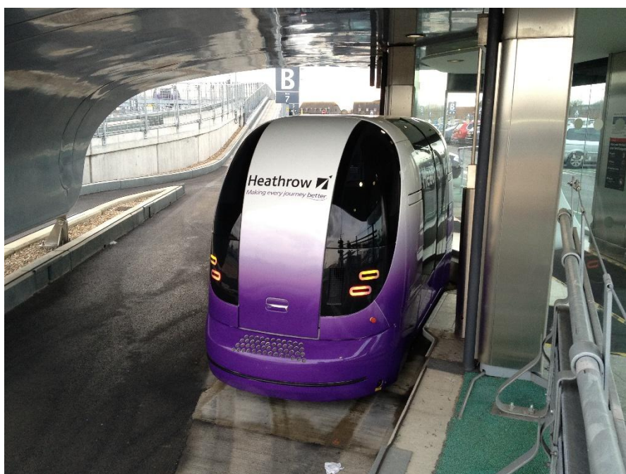
Slika 14. PRT UltraPod, Aerodrom Heathrow, London, Velika Britanija, [14]