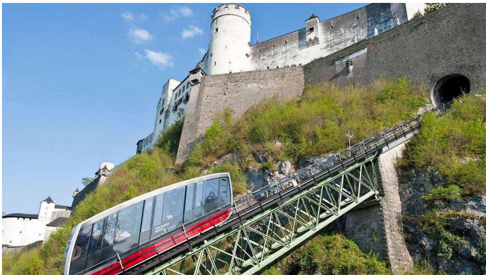
Slika 10. Model uspinjače, Salzburg, Austrija, [10]

Uspinjača je vrsta žičare kod koje se vozila vuku pomoću jednog ili više užeta po uzbrdici na posebno uređenoj trasi, a vozila se kreću na kotačima različitih izvedbi koji se oslanjaju na površinu po kojoj se kreću i koja su prilagođena trasi. To su posebno prilagođena šinska vozila.