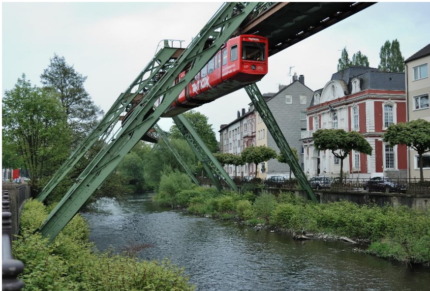
Slika 8. Model visećeg monoraila, Wuppertal, Njemačkoj [8]

Osim prekrasnih šuma i parkova koji prekrivaju dvije trećine grada i udaljeni su najviše deset minuta iz bilo koje četvrti, poznat je i po jedinstvenoj visećoj električnoj željeznici.[6]