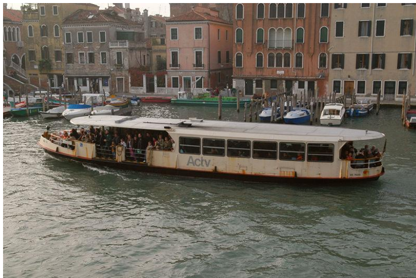
Slika 4. Vodeni autobus Vaporetto, Venecija, Italija, [4]