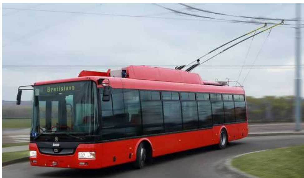
Slika 5. Model trolejbusa Škoda 25Tr, Bratislava, Slovačka, [5]