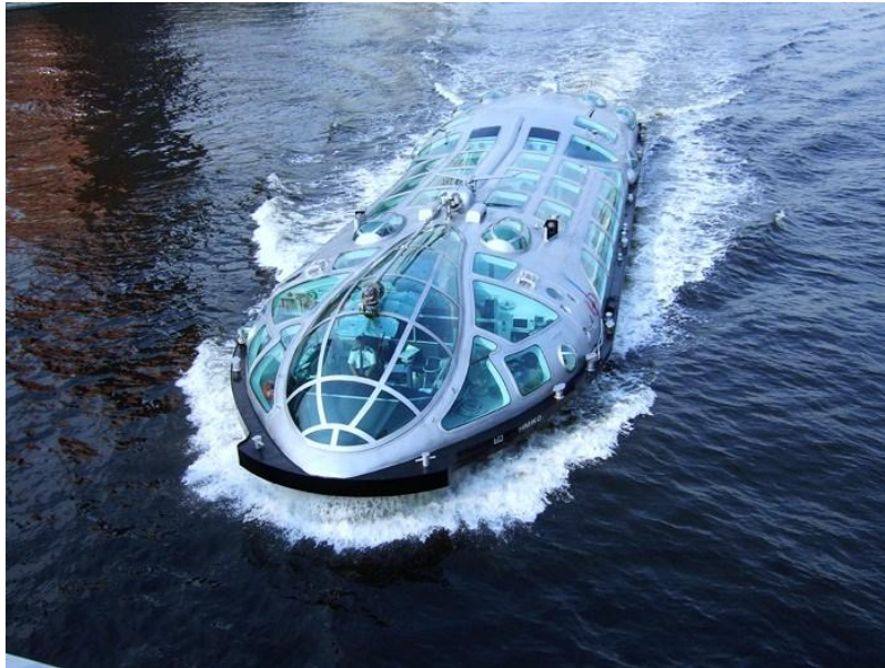
Slika 3. Vodeni autobus Himiko, Tokio, Japan, [3]