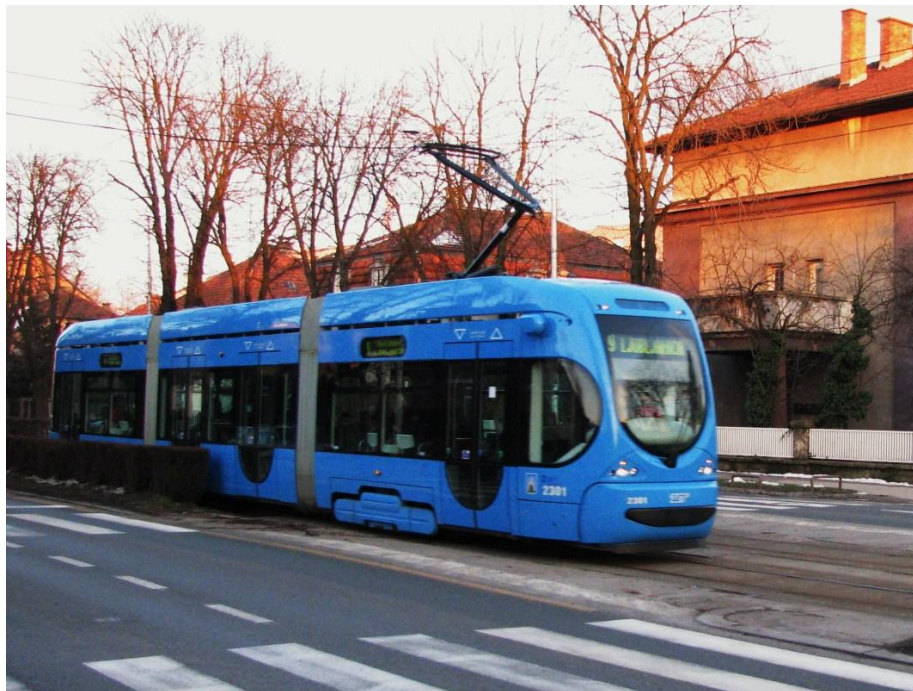
Slika 27. Model tramvaja TMK 2200-K, Zagreb, Hrvatska, [27]

Kraća inačica TMK 2200-K, puštena je u promet krajem 2009. To je niskopodni tramvaj voznog parka grada Zagreba. Tramvaj je zglobne izvedbe, sastavljen od tri modula, zavarene čelične konstrukcije s dva pogonska postolja.