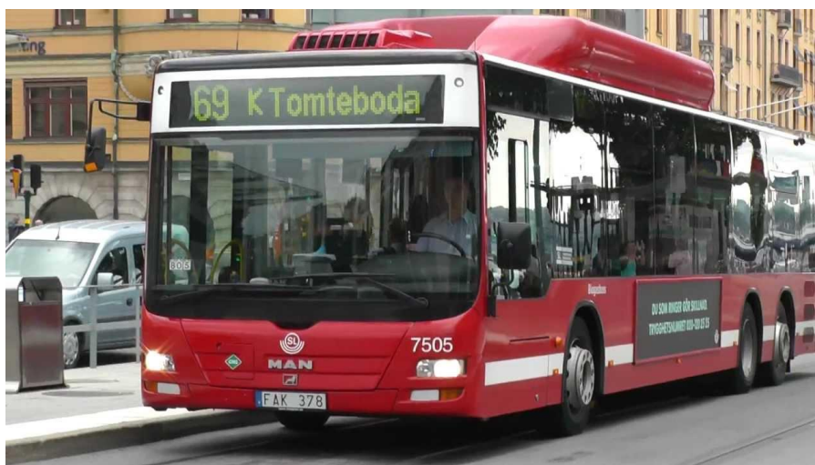
Slika 2. Model autobusa MAN NL, [2]

Kreće se po određenim rutama unutar postojeće gradske cestovne mreže uz mogućnost izmjena ruta uslijed promjene prometne regulacije uzrokovane raznim okolnostima, primjerice prometne nezgode, radova na cesti, političkih, sportskih ili kulturnih događanja.