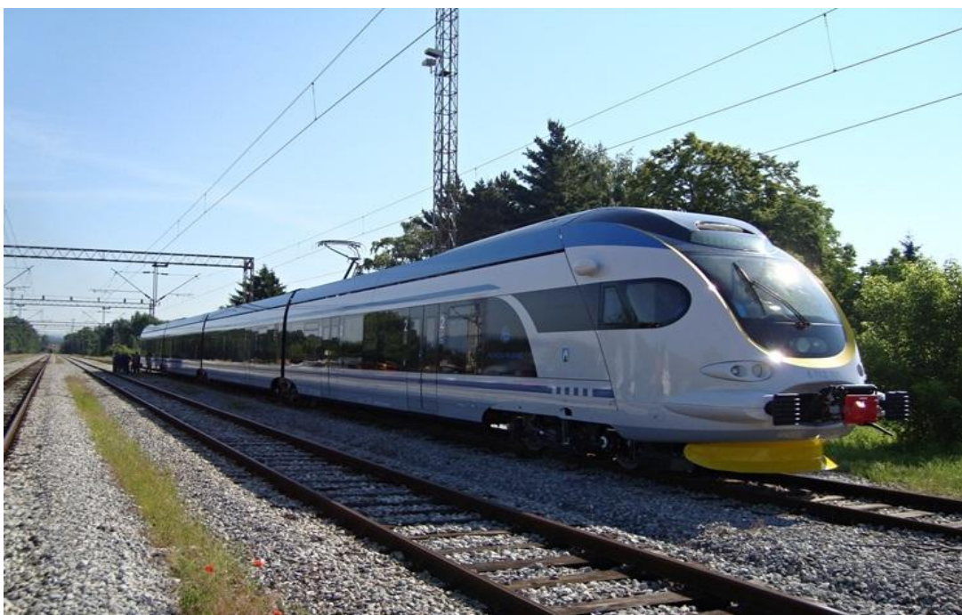
Slika 21. Model prigradskog vlaka Končar HŽ 6112, Zagreb, Hrvatska, [21]

ZET je u suradnji sa HŽ-om uveo zajedničku mjesečnu i godišnju kartu ("pokaz"), koja vrijedi i u prigradskom željezničkom prometu, kao i na tramvajskim i autobusnim linijama ZET-a.