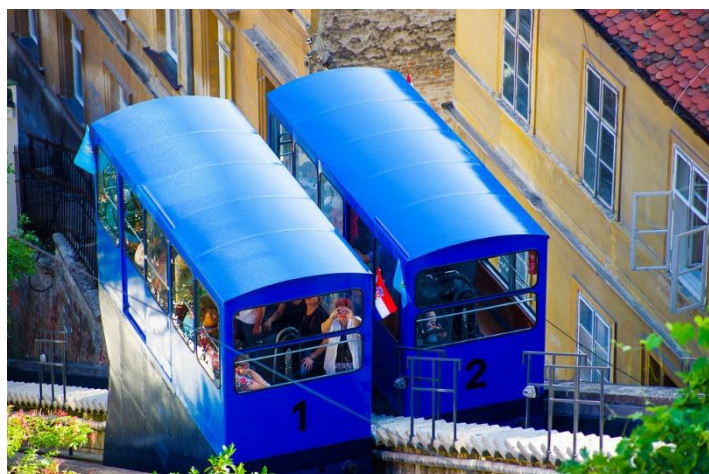
Slika 19. Uspinjača, Zagreb, Hrvatska, [19]

Isprva je bila na parni pogon koji je 1934. godine zamjenjen električnim. Budući da je do danas u cijelosti zadržala prvobitni vanjski izgled i građevnu konstrukciju, a i većinu tehničkih svojstava koja su joj dali graditelji, zagrebačka je uspinjača zakonski zaštićena kao spomenik kulture. Zagrebačka uspinjača je jedna od turističkih atrakcija u Zagrebu.[12]