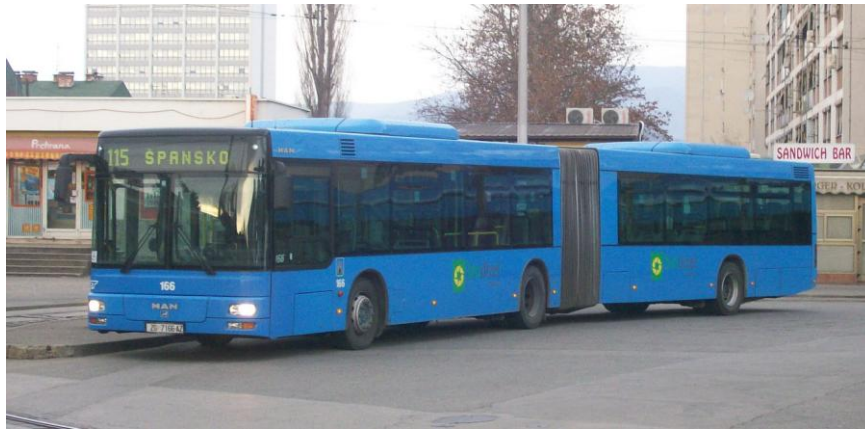
Slika 18. ZET autobus MAN, Zagreb, [18]

141 dnevna i četiri noćne linije prometno povezuju područja Grada Zagreba, Velike Gorice i Zaprešića, a prijevoz putnika organiziran je i u općinama Bistra, Luka, Stupnik i Klinča Sela. [11]