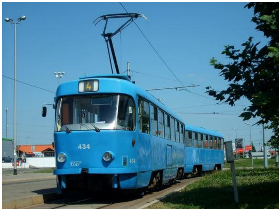
Slika 23. Model tramvaja Tatra T4, Zagreb, Hrvatska, [23]

Tramvaji ovoga tipa su puštani u promet u razdoblju od 1976. - 1982.