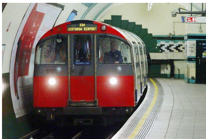
Slika 6. Metro, London, Velika Britanija, [6]

Optimalan je oblik za prijevoz velikog broja putnika. Odvija se na posebno odvojenim kolosiječnim trasama koje se ne sijeku u razini niti se međusobno dodiruju s drugim vidovima prometa, odnosno prometnicama. Zahvaljujući takvoj prometnoj odvojenosti u vođenju metroa moguće je ostvariti velike prosječne brzine vožnje te sve preduvjete za siguran, točan i pouzdan prijevoz putnika. [5]