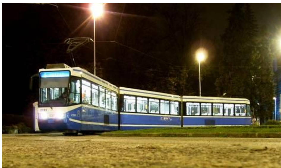
Slika 25. Model tramvaja TMK 2100, Zagreb, Hrvatska, [25]