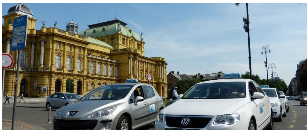
Slika 20. Taksi vozila, Zagreb, Hrvatska, [20]

Tako je 22. travnja 2011. godine započelo prometovati Taxi Cammeo Zagreb, s preko 70 novih taksi vozila. Također u gradu taksi prijevoz obavlja i Eko taxi. Dne 22. listopada 2015. godine u Zagrebu se pojavio Uber koji je službeno uspostavio servis uberX koji koristi ovlaštene taksi vozače dok je servis u stvari započeo u rujnu 2015. godine.