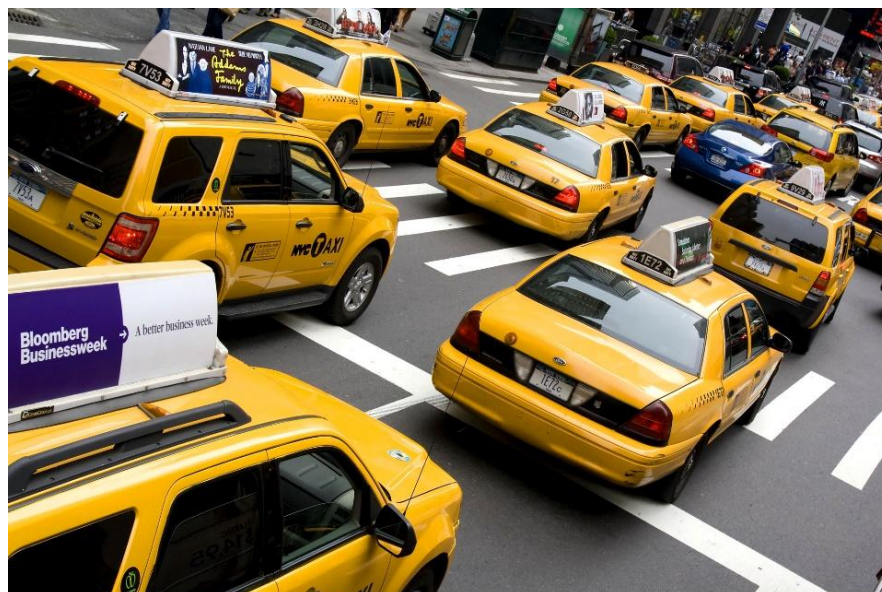
Slika 12. Taksi vozila, New York, SAD, [12]