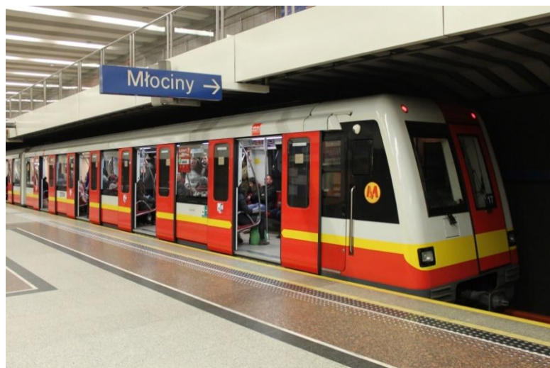
Slika 7. Metro, Varšava, Poljska, [7]