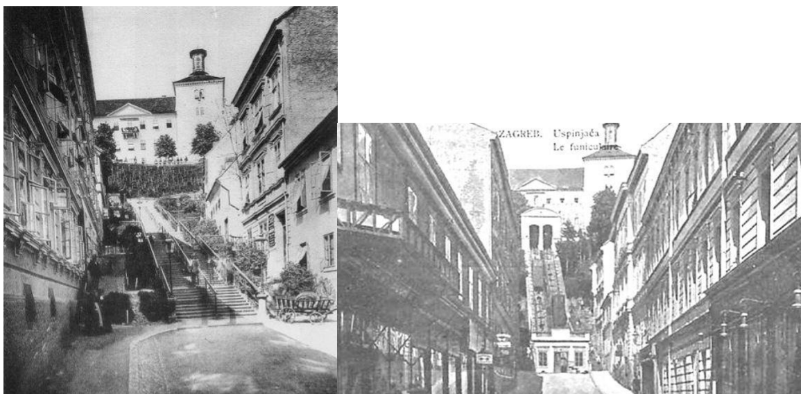
Slika 11. Tomičeva ulica, lokacija zagrebačke Uspinjače prije i nakon izgradnje, Zagreb, [11]

Uspinjača je sagrađena kao kosi vijadukt od osam polukružnih otvora duljine 2,5 metra, od opeke s vapnenim mortom. Usprkos kontinuiranom mehaničkom opterećenju, ta prastara konstrukcija do današnjih dana nije pokazala znakove bilo kakvih tehničkih deformacija, a u nekima od onih polukružnih otvora danas su umjetničke galerije i prodavaonice suvenira. Na betonskoj površini vijadukta nalaze se dva kolosjeka (na svakom se nalazi jedan vagon) s tračnicama duljine 66 metara i širine 1200 mm. Vučno užje je promjera 22 mm. [1]