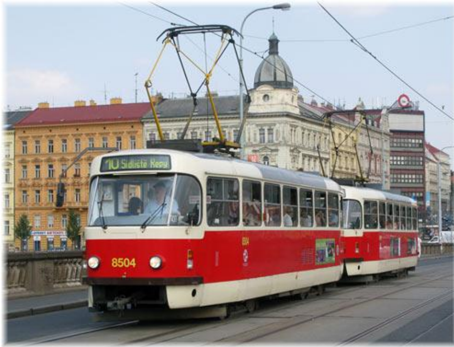
Slika 1. Model tramvaja ČKD Tatra T4, [1]

Tramvaj je javno električno vozilo koje služi putničkom prijevozu u gradskom prometu. Kretanje mu je vezano uz tračnice, napaja se putem kontaktne mreže preko krovnog oduzimača struje te preko tračnica, koje služe kao povratni vod, zatvara strujni krug.