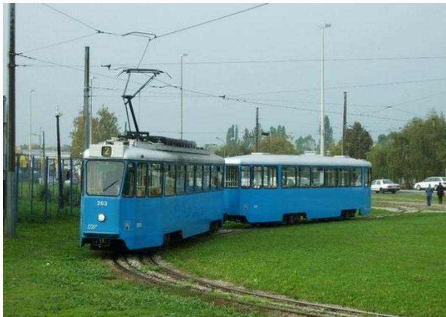
Slika 22. Model tramvaja TMK 201, Zagreb, Hrvatska, [22]

Radi se o četveroosovinskim tramvajima koje je proizvodio Đuro Đaković. Tramvaji su proizvedeni tijekom 1973. i 1974. godine. Vrlo su blizu povlačenju iz prometa. Iako stari, još uvijek se nalaze u prometu.[15]