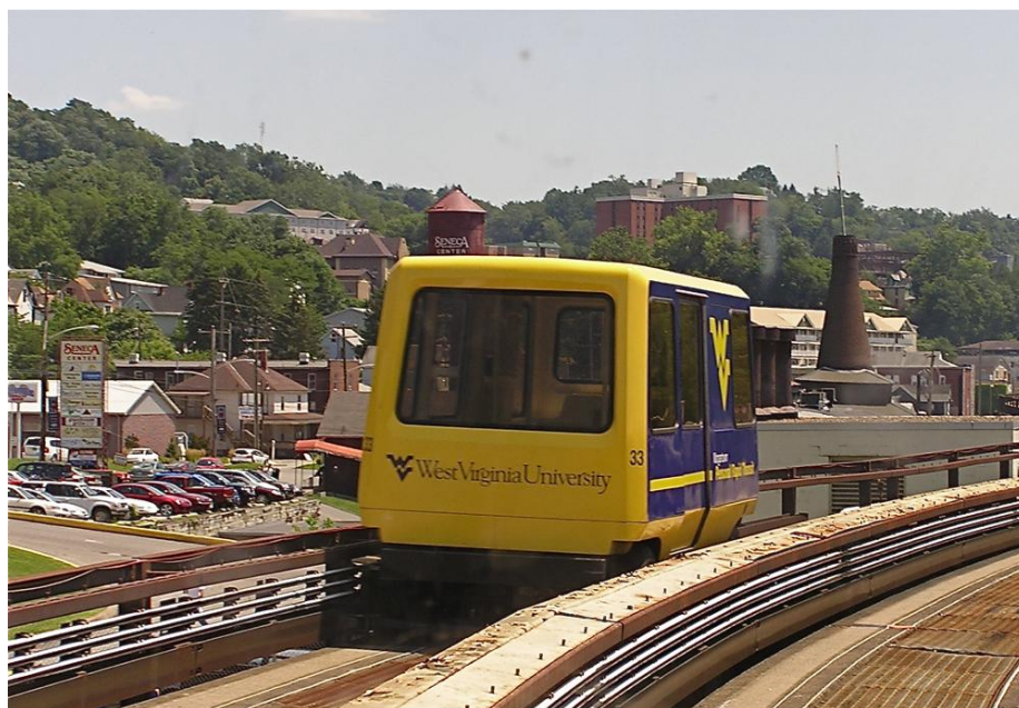
Slika 13. PRT Morgantown, West Virginia, SAD, [13]