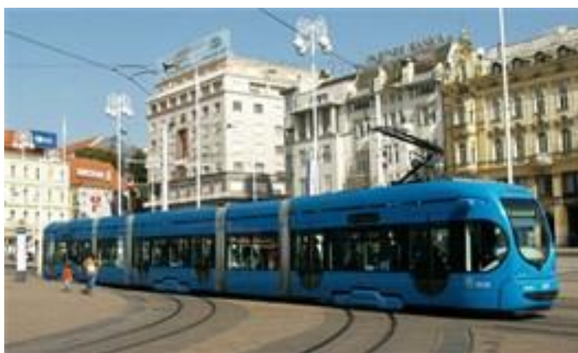
Slika 17. ZET tramvaj, model TMK 2200, Zagreb, [17]

Prijevoz putnika u Zagrebu je danas nezamisliv bez tramvaja koji više od stoljeća, kroz prošlost pa sve do danas, sigurno voze zagrebačkim ulicama na gotovo 120 kilometara pruge.