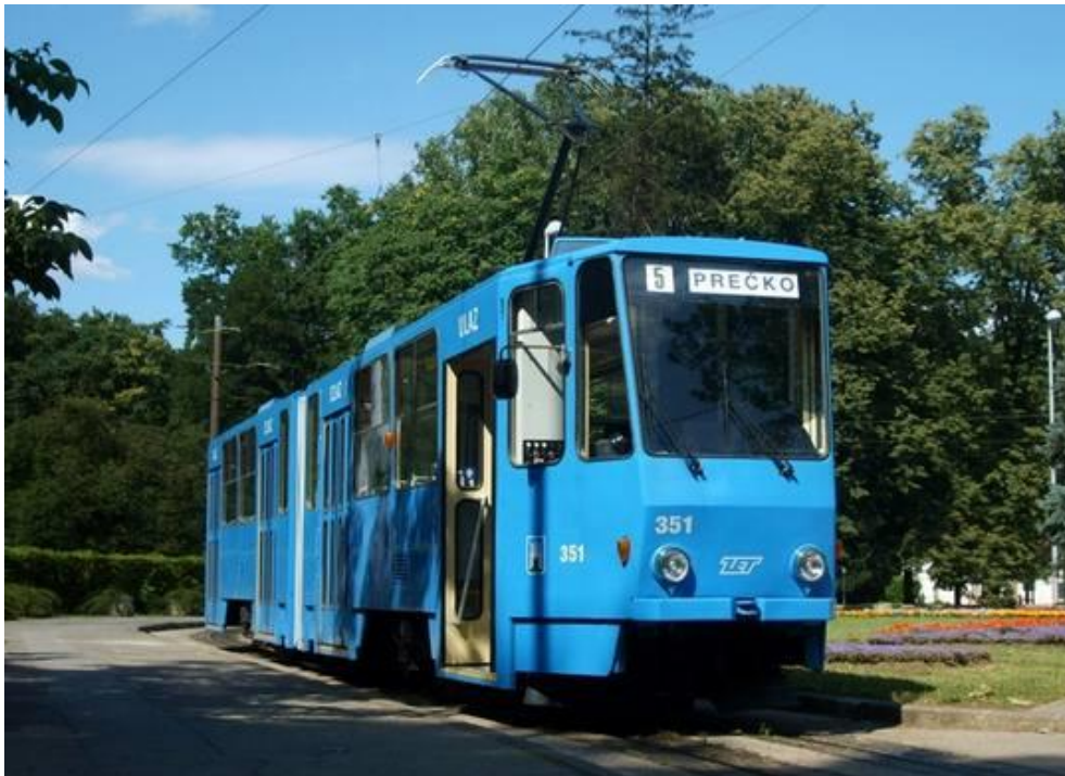
Slika 24. Model tramvaja Tatra KT4, Zagreb, Hrvatska, [24]

Tramvaj s dvodjelnom karoserijom. Zglobni tramvaji puštani se u promet u razdoblju od 1985. - 1986. Iako stari, još uvijek se nalaze u prometu. [16]