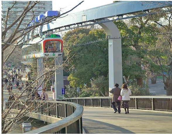
Slika 9. Model visećeg monoraila Ueno Zoo, Tokio, Japan, [9]