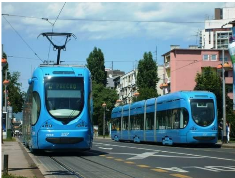
Slika 26. Model tramvaja NT 2200, Zagreb, Hrvatska, [26]

Niskopodni tramvaj konzorcija Crotram. Proizvedeno ih je ukupno 70 u periodu od 2005. do 2007. godine. 2007. godine potpisan je ugovor za još 70 tramvaja ovog tipa. Isporuka druge serije pokrenuta je početkom 2008.