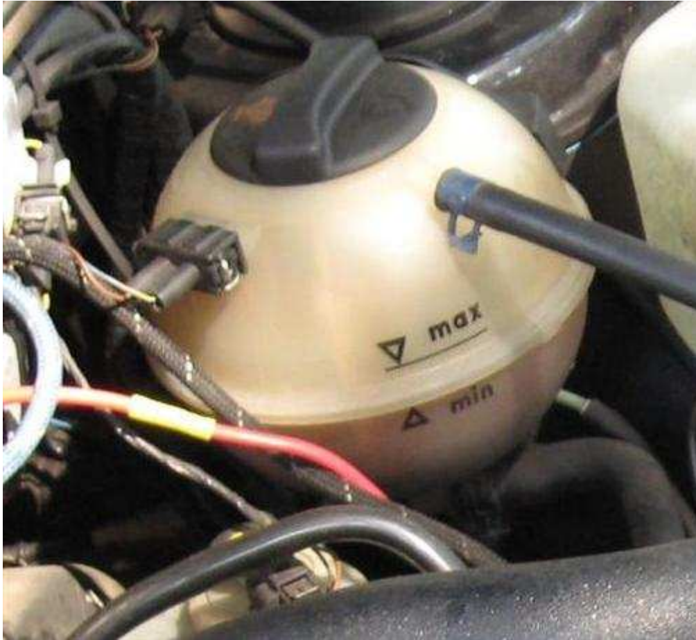
Slika 18. Posuda rashladne tekućine, [32]

Kako bi se povećala učinkovitost rashladnog sustava motora, potrebno je omogućiti bolju provodljivost topline od mjesta gdje dolazi do povišenih temperatura do hladnjaka rashladne tekućine. Time se smanjuje stupanj zagrijanosti pri čemu dolazi do boljeg rada motora. Također je potrebno omogućiti jednako dobru provodljivost topline kroz rashladnu tekućinu u uvjetima vrlo niskih temperatura kao i u uvjetima optimalnih temperatura rada motora.