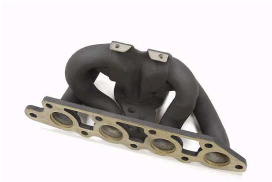
Slika 2. Izgled ispušne grane za četverocilindrične motore, [10]

Na slici 2. predočen je izgled ispušne grane za četverocilindrične motore.