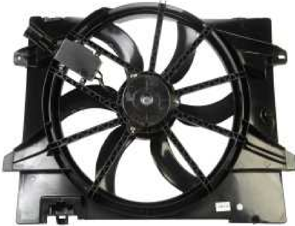
Slika 14. Rashladni ventilator, [28]

Za poboljšanje učinkovitosti ventilatora moguće je povećati lopatice ventilatora, ubrzati vrtnju ventilatora, omogućiti pravodobno uključivanje ventilatora pri zagrijavanju motora, itd.