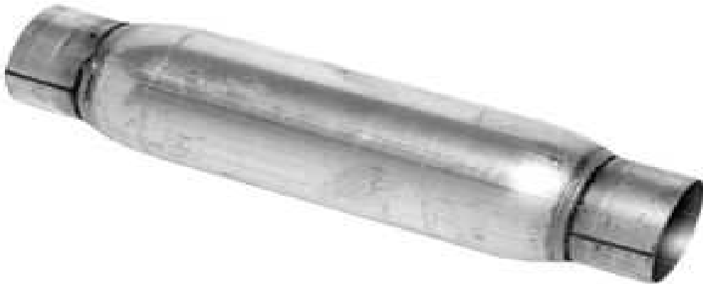
Slika 5. Rezonator, [13]

Na slici 5. prikazan je izgled rezonatora.