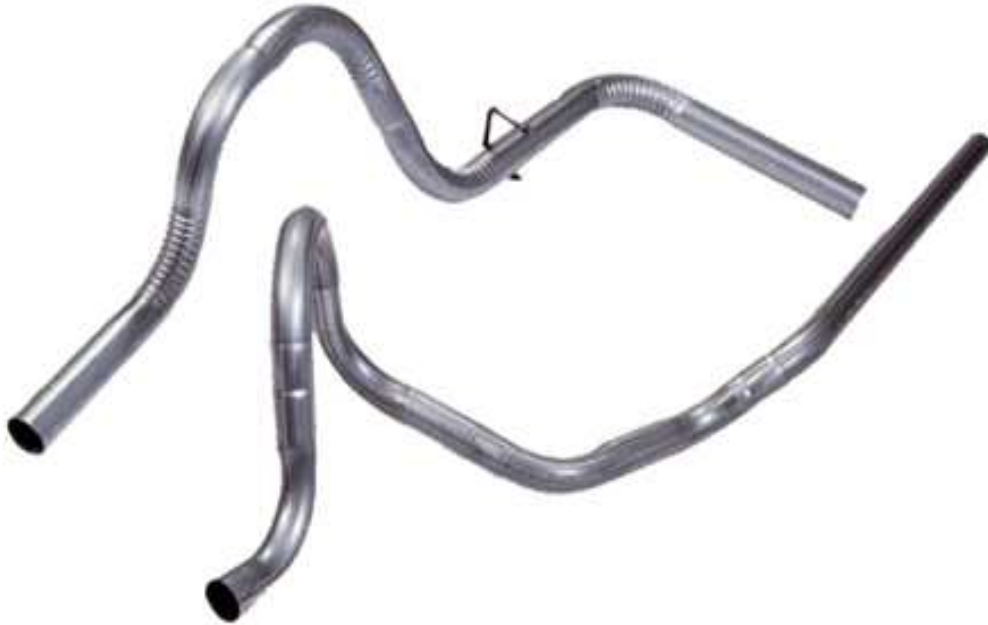
Slika 3. Ispušne cijevi, [11]

Na slici 3. je predložen izgled ispušnih cijevi.