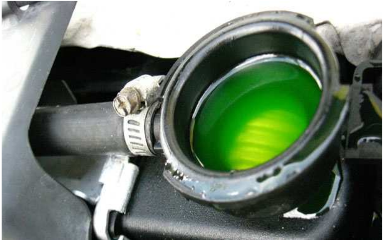
Slika 17. Rashladna tekućina, [31]

Na slici 17. prikazan je izgled rashladne tekućine koja se nalazi u hladnjaku motora.