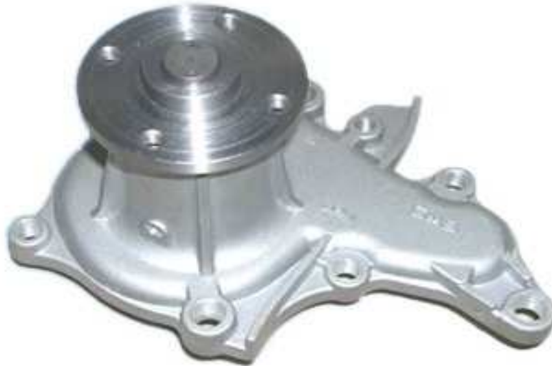
Slika 16. Vodena pumpa, [30]

tekućine. To znači da bi vodena pumpa trebala imati vlastiti pogon 10 kako bi po potrebi povećavala ili smanjivala brzinu vrtnje i tako ubrzala ili usporila protok rashladne tekućine kroz motor, [27].