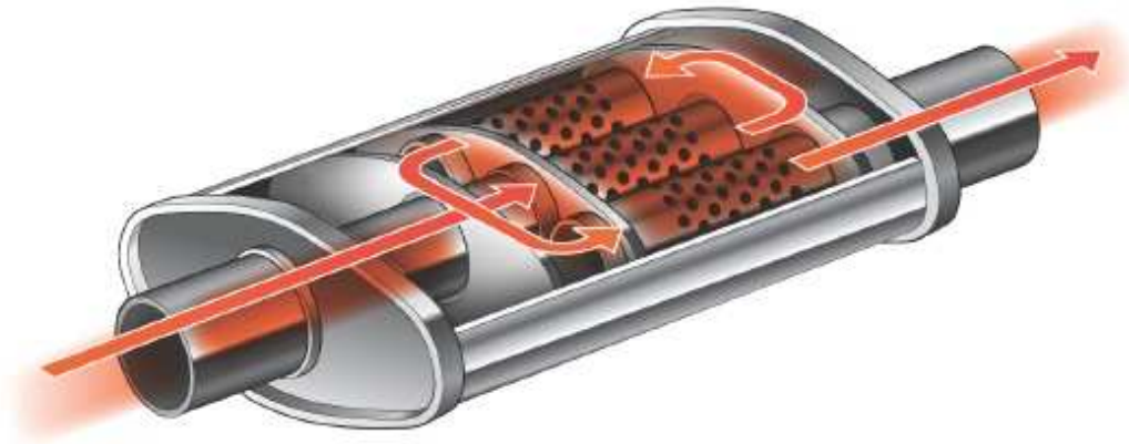
Slika 6. Prigušivač zvuka, [14]

zvučnog signala kroz cijevi i prostore u prigušivaču zvuka dolazi do raspršivanja zvuka pri čemu se umanjuje njegova jačina na izlazu iz ispušnog lonca, [9].