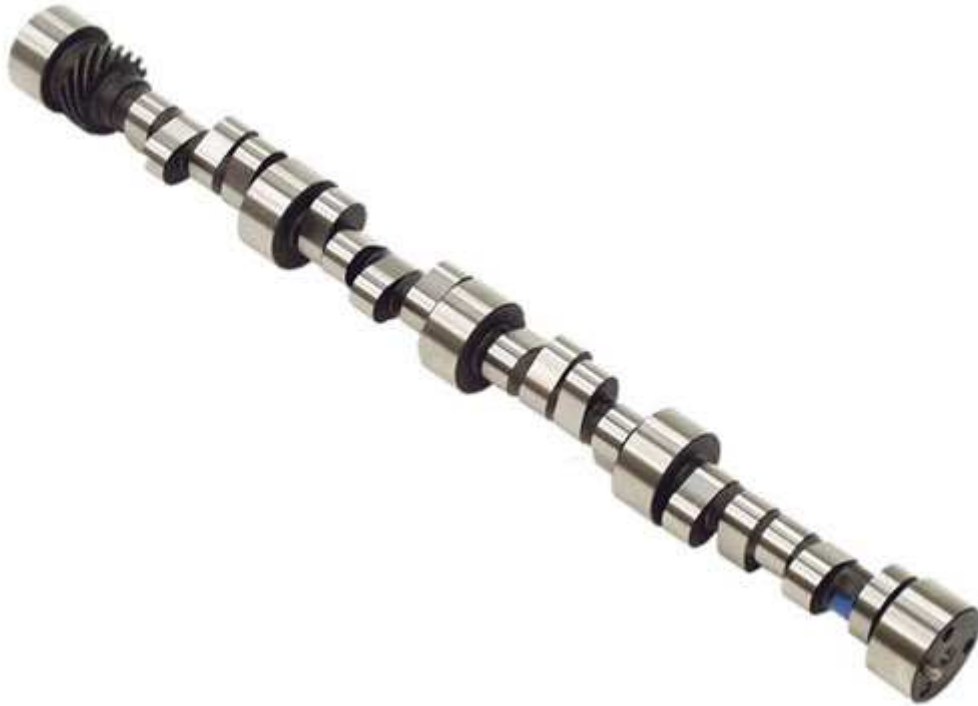
Slika 13. Bregasto vratilo, [25]

Postoji više načina izvedbe bregastog vratila za otvaranje ventila, a to su jedna bregasta osovina, dvostruka bregasta osovina i otvaranje ventila bregastom osovinom na principu poluge. Glavna razlika između nabrojana tri načina izvedbe je da se pri jednostrukoj i dvostrukoj izvedbi bregastog vratila koriste remeni ili lanci za njihovo pokretanje dok se bregasto vratilo sa polugom pokreće pomoću zupčanika. U načelu, jednostruko bregasto vratilo koristi se za manji broj cilindara dok se dvostruko bregasto vratilo koristi za veći broj cilindara, [26].