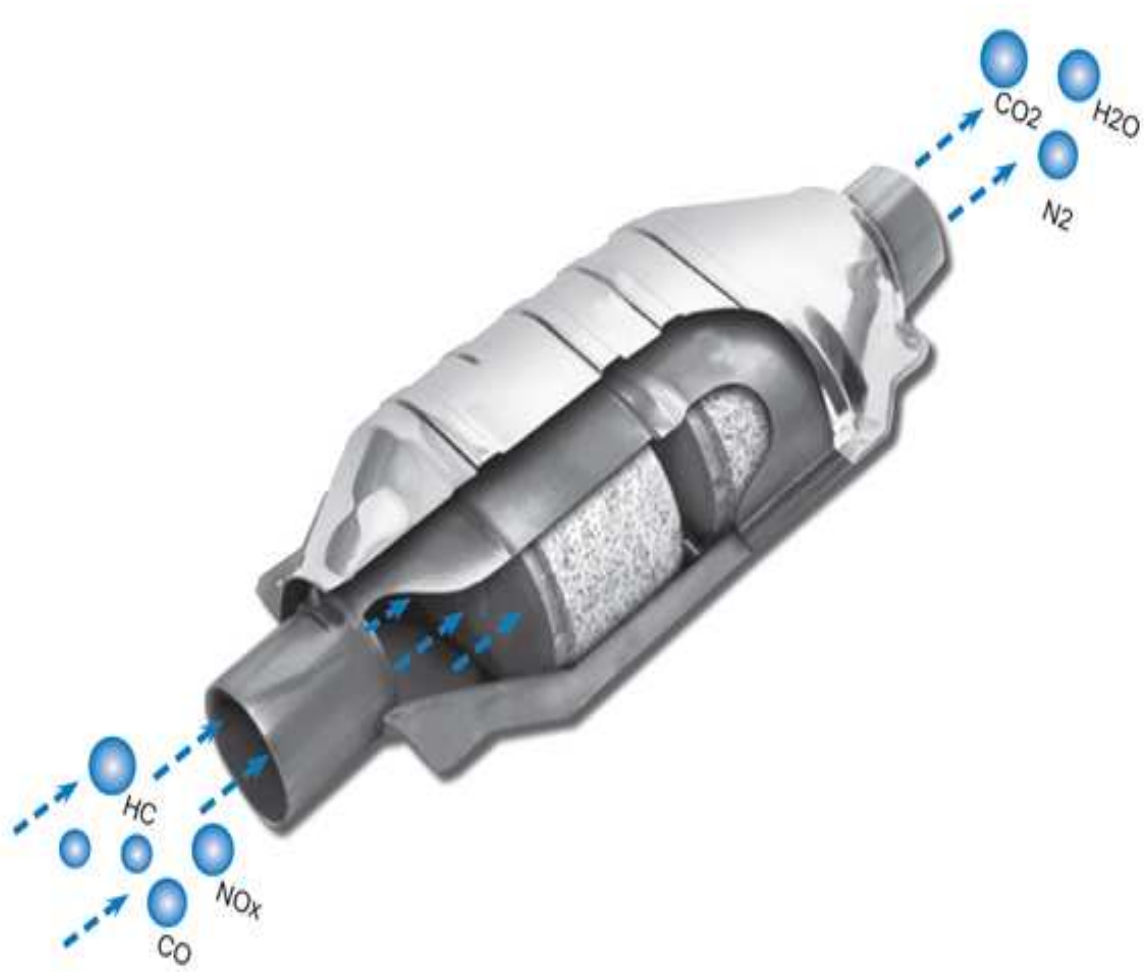
Slika 4. Katalizator, [12]

ugljkovodici dospjeti u ispuh. Iz tog razloga postoje katalizatori kako bi se zaustavio prodor štetnih tvari poput ugljikovodika u okolinu, [9].