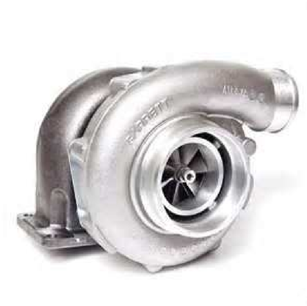
Slika 11. Turbo punjač, [22]

Na slici 11. prikazan je izgled turbo punjača.