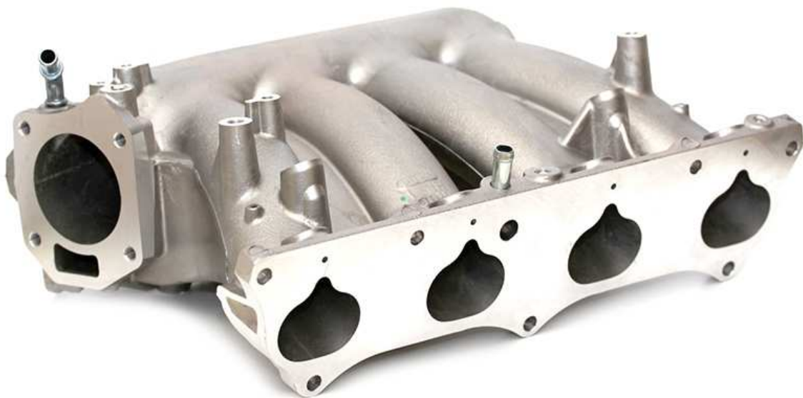
Slika 9. Usisna grana, [18]

Glavna zadaća usisne grane je dovod svježeg zraka u cilindre motora. U usisnoj grani se, pomoću karburatora, odvija proces miješanja smjese goriva i zraka. Smjesa kroz cijevi u usisnoj grani, koje se vide na slici 9., dolazi do cilindara i ondje se odvija proces paljenja, odnosno izgaranja, [17].