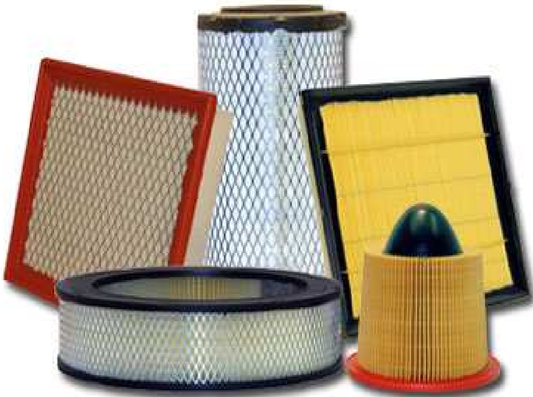
Slika 8. Različiti oblici pročištača zraka, [16]

Kako ne bi došlo do prodora stranih čestica poput prašine u motor, na početak usisnog sustava se postavlja pročištač zraka koji onemogućuje ulaz tih čestica. Pročištač zraka tijekom vremena sakuplja nečistoću te gubi svoja svojstva i iz tog razloga je i više nego važna izmjena nakon određenog vremena.