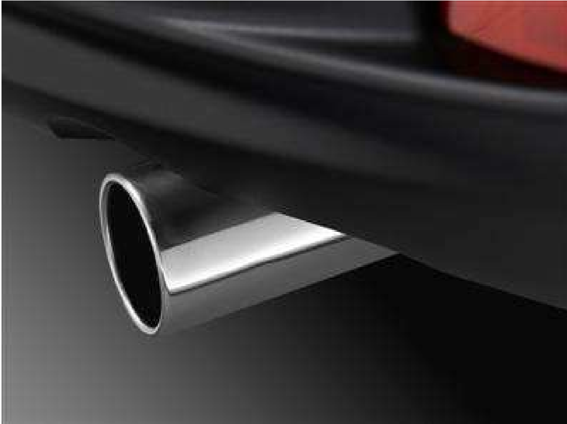
Slika 7. Ispušni lonac, [15]

Prilikom postavljanja ispušnog lonca na kraj ispušnog sustava treba posvetiti pozornost na smjer u kojem se ispušni plinovi vode iz ispušnog lonca. Ispušni lonac bi trebao biti usmjeren prema dolje kako ispušni plinovi ne bi dospjeli do laka vozila jer se pod konstantnim prolaskom plinova lak oštećuje.