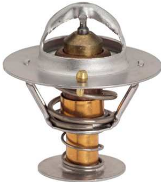
Slika 15. Termostat rashladne tekućine, [29]

Takav postupak provođenja rashladne tekućine je moguć zbog postojanja voska u termostatu. Pri nižim temperaturama rashladne tekućine, a i za vrijeme zagrijavanja motora na radnu temperaturu, vosak je u krutom stanju. Prilikom porasta temperature rashladne tekućine iznad dozvoljenih granica, vosak se topi i tako se termostat otvara i omogućuje prolazak tekućine. Pri tome tekućina manje temperature iz hladnjaka dolazi u motor, a ona sa većom temperaturom odlazi u hladnjak i rashlađuje se. Pri normaliziranju temperature u motoru, vosak se polagano zgrušnjava te nakon nekog vremena postaje krut, zatvara se otvor na termostatu, i ponovo dolazi do zaustavljanja protoka rashladne tekućine, [27].