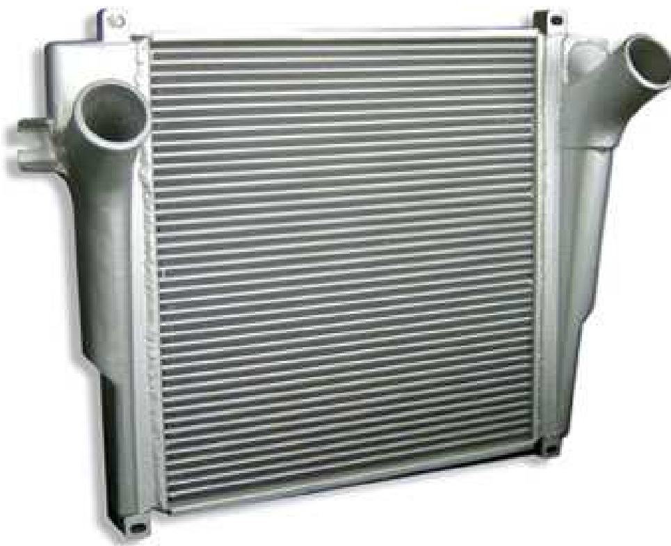
Slika 10. Hladnjak, [20]

Što je usisani zrak hladniji, to je veća učinkovitost motora jer je pri manjim temperaturama veći udio kisika u zraku i tako dolazi do kvalitetnijeg izgaranja smjese. Što je hladnjak veći, to je veća količina zraka koja može proći kroz njega, rashladiti se, i tako poboljšati proces izgaranja čime se dobije veća iskoristivost energije, [19].