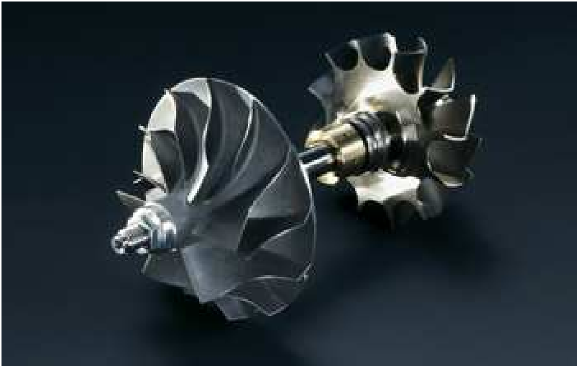
Slika 12. Osovina i lopaticice turbo punjača, [23]

Lopaticice i osovina turbo punjača prikazane su na slici 12.