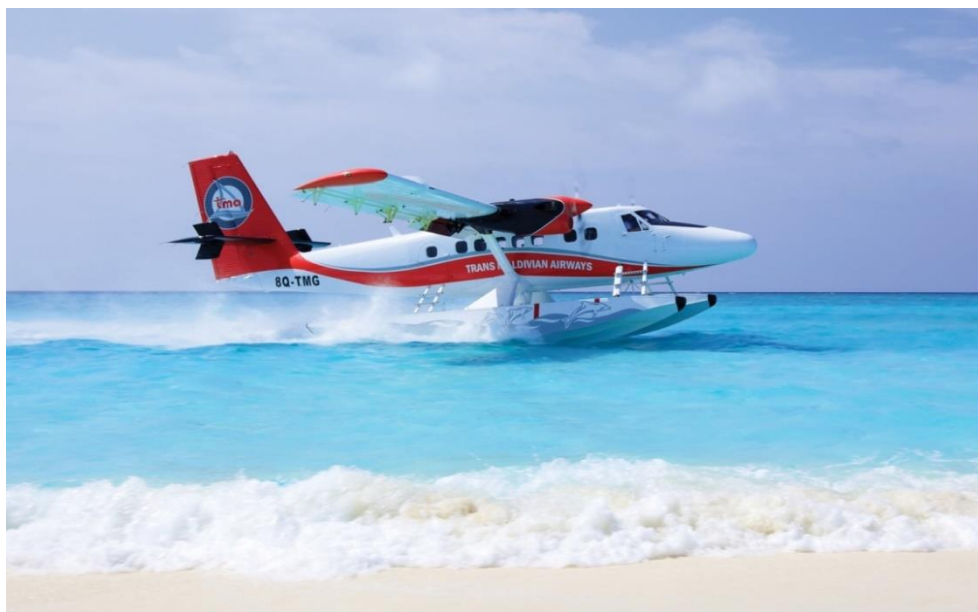
Slika 4. De Havilland Canada DHC-6 Twin Otter

Trans Maldivian Airways sa svojom flotom od 52 De Havilland Canada DHC-6 Twin Ottera (slika 3) te 79 razne destinacije je najrazvijenija hidroavionska kompanija na svijetu.[5]