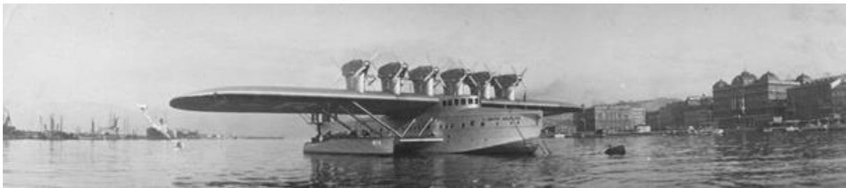
Slika 1. Dornier Do X u Rijeci 1931. godine

U povijesnim albumima mogu se naći povijesne fotografije hidroaviona na hrvatskoj obali. Na slici 1. prikazan je jedan od svega tri proizvedena primjerka tipa hidroaviona Dornier Do X , konstruktora Claudiusa Dorniera iz Njemačke. Zrakoplov pokreću 12 zračno hlađenih klipnih motora Siemens Jupiter snage 525 HP. Slika je iz rujna 1931. godine kada je bio na propagandnom proputovanju po Italiji, pa je sletio u Rijeku, Zadar i Pulu. [2]