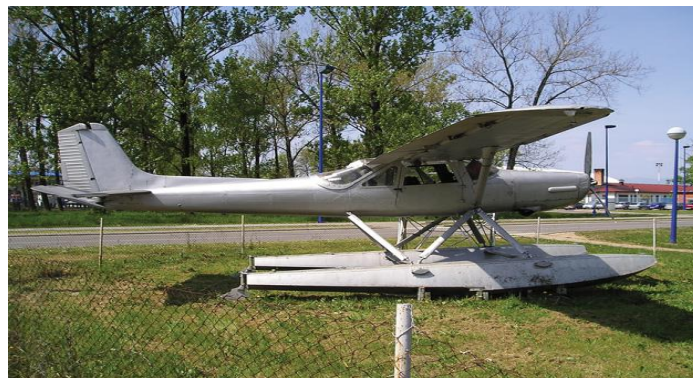
Slika 3. Hidroavion Utva 66H, ispred Zrakoplovne tehničke škole Rudolfa Perešina u Velikoj Gorici

Nakon Drugog svjetskog rata počeo je razvoj Jugoslavenskoga ratnog zrakoplovstva, stacioniranoga u Divuljama kao 122. hidrozrakoplovna postrojba. Nabavljeno je nekoliko hidroaviona s plovcima Aero-2H zemunske tvornice Ikarus, dva britanska Short SA.6 Sealand dvomotorna amfibijska hidroaviona, dva De Havilland Canada DHC-2 Beaver hidroaviona s plovcima, a od sredine 1960-ih nabavljeni su jednomotorni hidroavioni s plovcima Utva 60H , koji su 1972. zamijenjeni novijim tipom Utva 66H (Slika 3). Od 1955. u Divuljama su bili stacionirani i helikopteri s ugrađenim plovcima Westland S-51 , od 1969. suvremeniji S-55 proizvedeni po licenci u mostarskoj tvornici Soko, a početkom 1980-ih i sovjetski protupodmornički helikopteri Mi-14PL s plovnim trupom. [2]