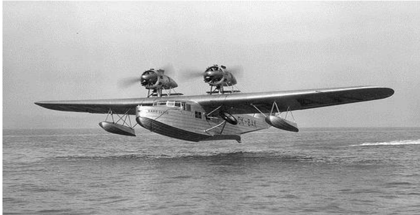
Slika 2. Saro Cloud amfibija

Linija se nije pokazala isplativom zbog premale popunjenosti putnicima te je vrlo brzo ukinuta. Već nekoliko godina nakon, kada se povećala zainteresiranost za zračnim prometom, nove linije za Split su išle preko sinjskog aerodroma.