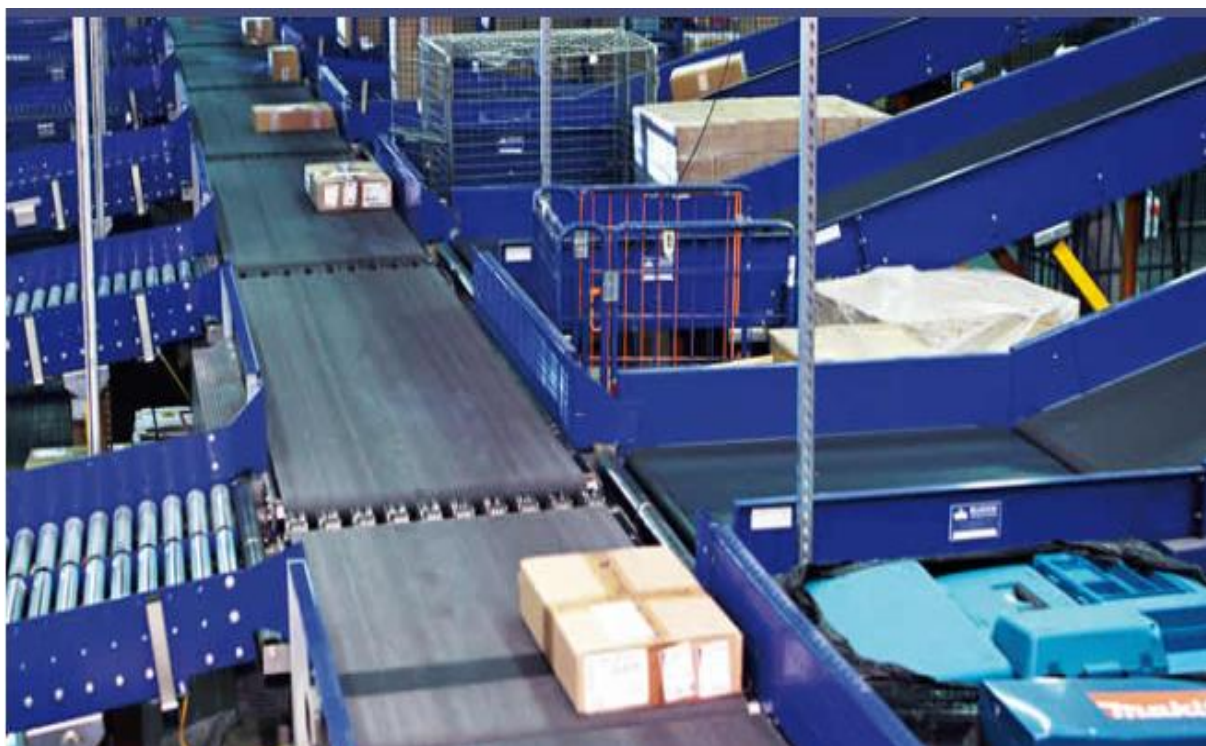
Slika 5. Manipulacija paketa na sortirnoj traci u skladištu

primatelj također dobiva obavijest o broju paketa, iznosu pouzeća 51 koje je potrebno pripremiti kako bi preuzeo paket i direktan broj od kurira. General Logistics Systems d.o.o. je jedini pružatelj usluge na tržištu paketne distribucije koji omogućuje svojim klijentima da stupe u direktan kontakt s kurirom ukoliko nisu u mogućnosti preuzeti paket kako je dogovoreno. Ova je usluga omogućena primateljima paketa kako bi se izbjeglo višestruko zvanje primatelja ako dođe do problema sa isporukom. Taj dio logističke usluge osmišljen je kako bi se smanjio pritisak na centralu korisničke službe koja također zaprima upite o statusu paketa klijenata i kako bi se podigla kvaliteta usluge prema krajnjem primatelju koji u današnjem ubrzanom načinu života nemaju veliko razumijevanje za redove čekanja i prespajanja da bi došli do osobe koja im je u danom trenutku potrebna za njihov upit, a to je u ovom slučaju kurir koji im doprema proizvod.