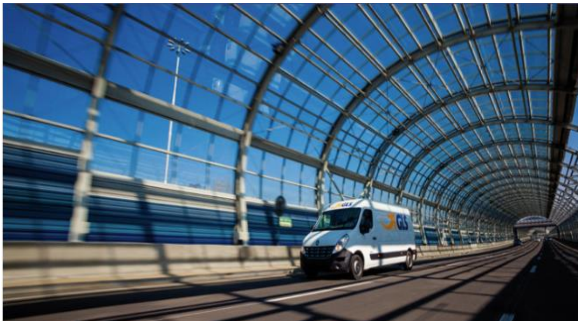
Slika 6. Prikaz kombi vozila za dostavu paketa