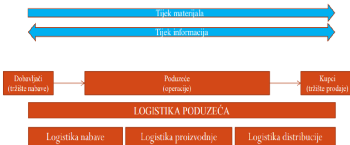
Slika 3. Prikaz dijelova logistike poduzeća

Logistika poduzeća definira se kao integrirano planiranje, izvršavanje, kontrola i upravljanje svim internim i eksternim tokovima robe i informacija pod odgovornošću poduzeća. Ukoliko promatramo osnovni tijek materijala vidljivo je da oni prolaze tri funkcionalne logistike : logistika nabave, logistika proizvodnje i logistika distribucije. 31