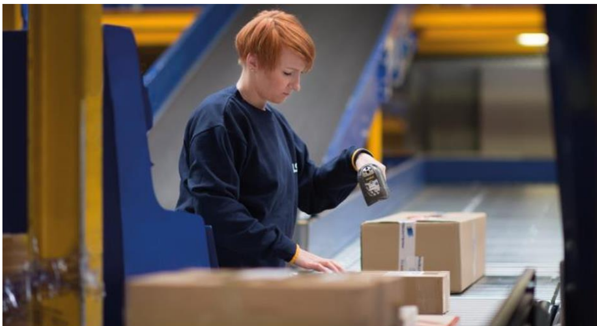
Slika 4. Skeniranje paketa u sortirnom centru

Nakon što je kurir preuzeo paket, on se transportira u glavni sortirni centar tvrtke koji se nalazi u Popovcu gdje prolazi manipulaciju u skladištu. Dolaskom u sortirni centar paket se sa ostalim paketima iz kombi vozila sortira na manipulacijsku traku gdje se vrši skeniranje. Skeniranje paketa predstavlja radnju koja omogućuje praćenje paketa tijekom transportnog lanca. Paket se skenira prilikom svake točke tranzita od pošiljatelja, u ovom slučaju OPG-a Kuprešak pa do krajnjeg primatelja, tj. kupca njihova proizvoda. Nakon skeniranja paketa prilikom dolaska u skladište, on prolazi skeniranje i slijedeći radni dan kada ide na isporuku primatelju prilikom utovara u kombi vozilo.