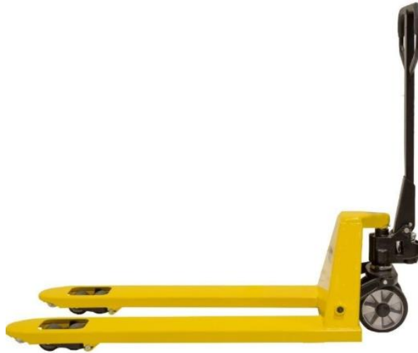
Slika 2. Ručni viličar za manipulaciju teretom

Karakter i vrsta manipulativnih sredstava za prihvat i otpremu ovisit će o karakteru pošiljke (kategorija tereta, vrsta pakiranja, dimenzije, težina), te će varirati od jednostavnih sredstava manipulacije (ručni viličar), koji se nalazi na slici 2., do složenih manipulativnih sredstava, kao što je, primjerice, ukrcajno-iskrcajna platforma.