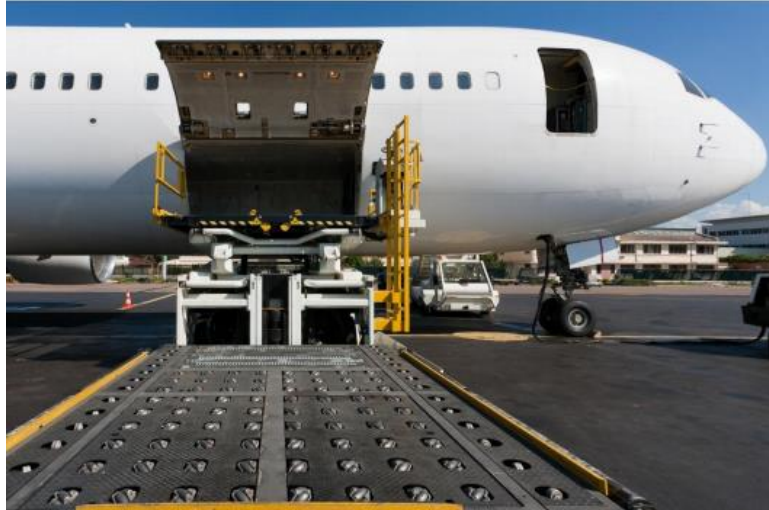
Slika 3. Ukrcajno-iskrcajna platforma (teretni utovarivač)