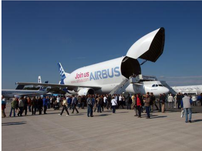
Slika 4. Nosni utovar tereta u zrakoplov