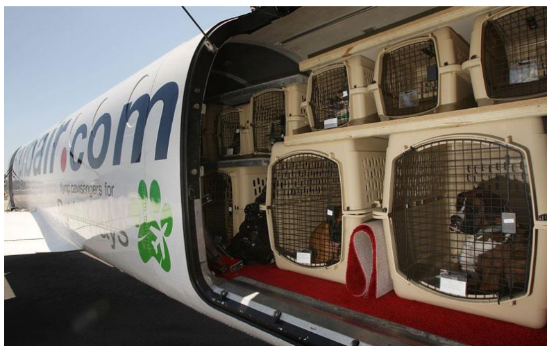
Slika 8. Prijevoz živih životinja