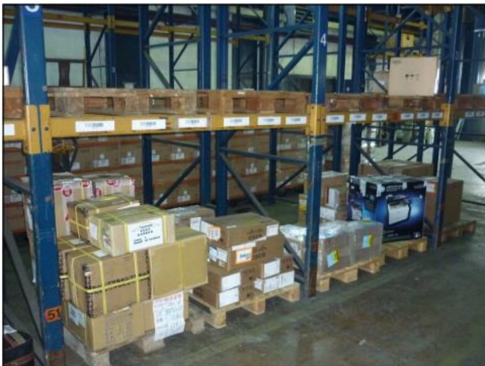
Slika 6. Pošiljke Cargo terminala zračne luke Zagreb