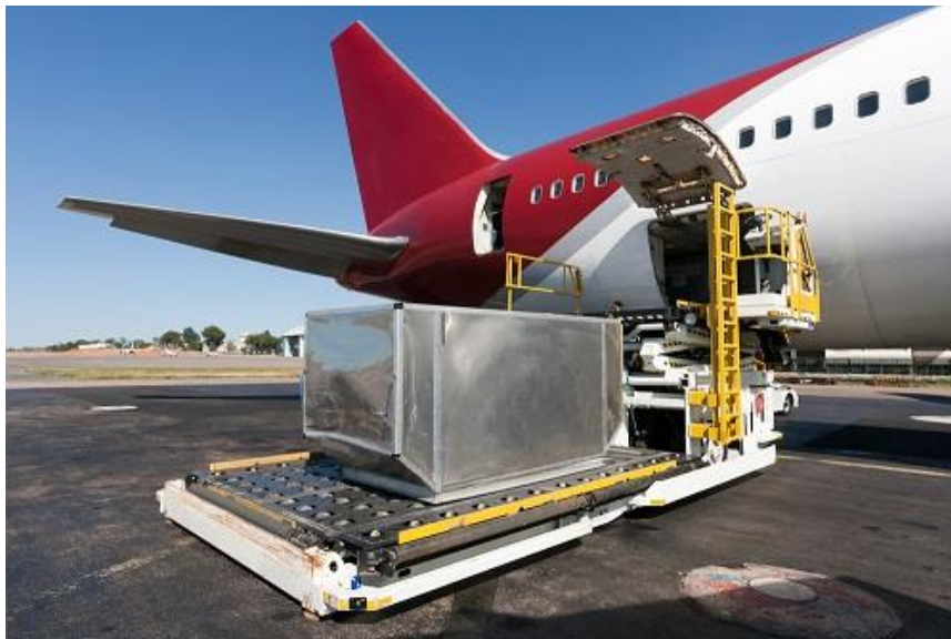
Slika 1. Predmet obrade (pošiljka) spremna za ukrcaj

U trenutku kada se provedu svi postupci obrade predmeta prijevoza, i kada predmet prijevoza preraste u višu razinu elementa koja se naziva pošiljka, sljedeći postupak unutar tehnološkog procesa prijevoza je ukrcaj pošiljke u zrakoplov kao što je prikazano na slici 1.