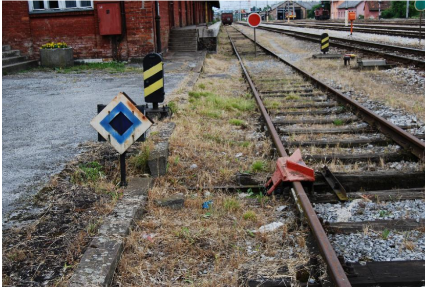
Slika 5. Iskliznica u kolodvoru Karlovac.

U kolodvoru Karlovac svim iskliznicama rukuje se centralno s kolodvorske postavnice. One se koriste kako se pri slučajnom pomicanju vagona ili kretanja lokomotive ne bi ugrozili putovi vožnje. Kolodvor Karlovac ima 7 iskliznica.