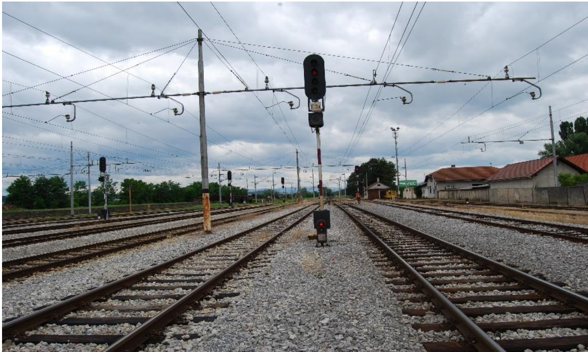
Slika 3. Izlazni signal E3a u smjeru Zagreb Glavni kolodvor u kolodvoru Karlovac.

Na ulaznim signalima A, B i C ugrađen je pokazivač brzine koji signalizira signalni znak „Voziti ograničenom brzinom 30 km/h“, koji se uključuje kad se vlak prima u kolodvor na prvi dio podijeljenog kolosijeka 1 i 2 za koji je osiguran put proklizavanja od najmanje 50 m. U tom slučaju navedeni ulazni signali pokazuju signalni znak Ograničena brzina, očekuj Stoj“.