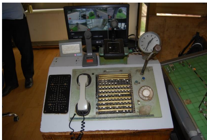
Slika 7. Telekomunikacijski pult u kolodvoru Karlovac