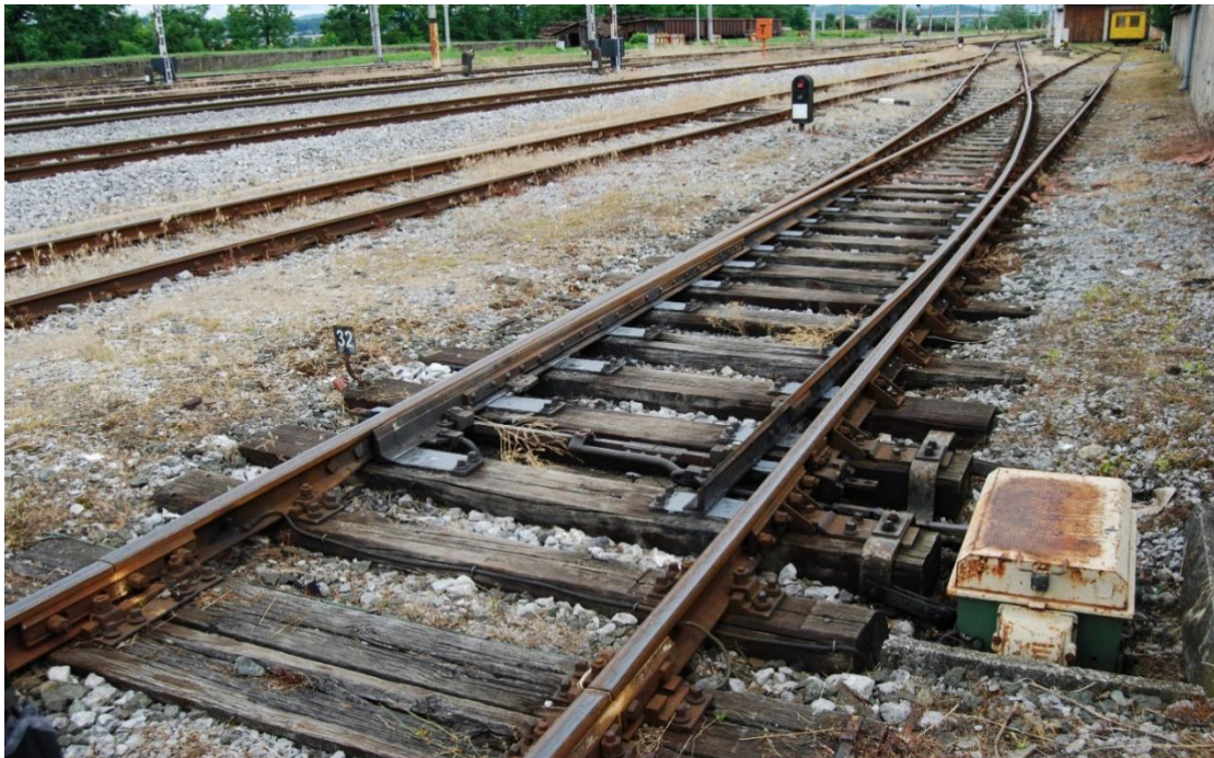
Slika 4. Skretnica nbr.32 u kolodvoru Karlovac

Namjena skretničke postavne sprave je postavljanje skretnice iz jednog krajnjeg položaja u drugi krajnji položaj. Skretnička postavna sprava se sastoji iz metalnog kućišta koje je pričvršćeno uz skretnicu. U metalnom kućištu je smješten elektromotor s mehanizmom za pretvaranje kružnog kretanja u pravolinijsko, mehanizam za podešavanje sile postavljanja i sile čvrstog držanja i mehanizam električnih kontakata pravilnog i ispravnog položaja. Pravilan položaj skretnice utvrđuje poseban mehanizam u postavnoj spravi na kojeg su vezani električni kontakti koji daju informaciju o stanju skretnice središnjem uređaju u relejnoj prostoriji i posredno na postavni stol.