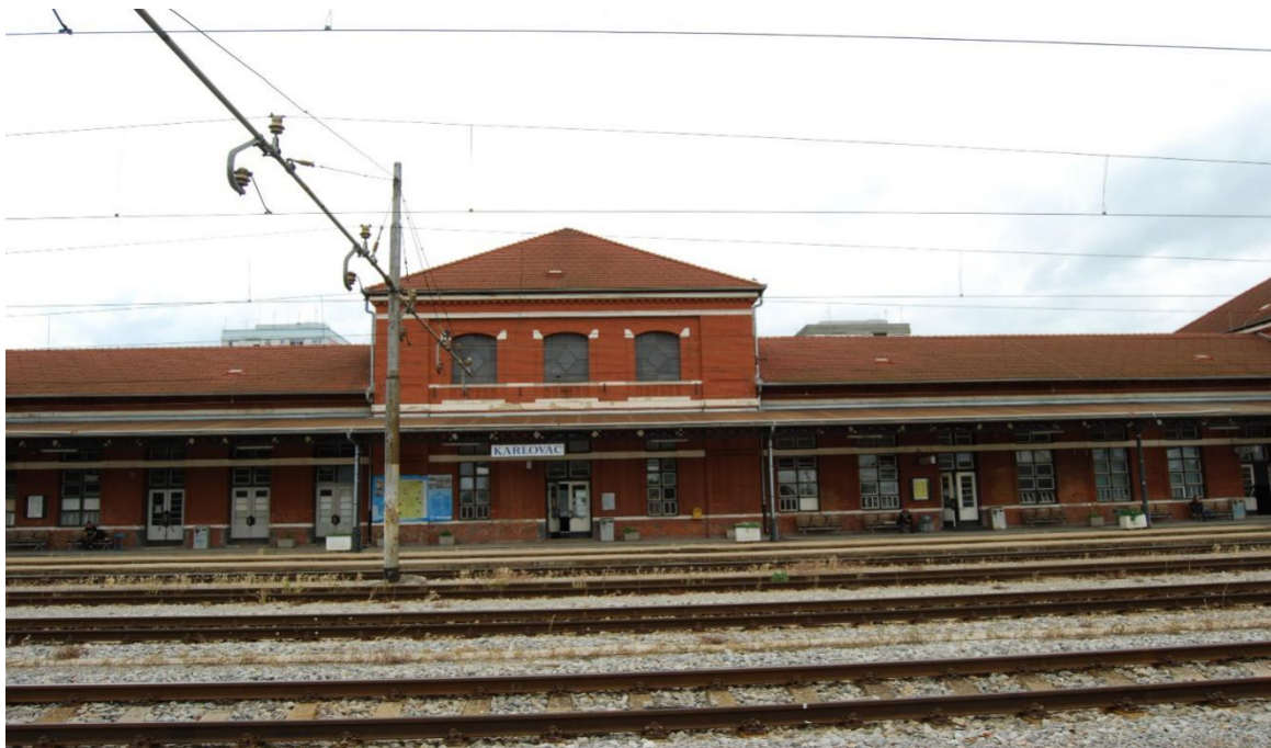
Slika 1. Kolodvorska zgrada u kolodvoru Karlovac

Kolodvorsko prihvatna zgrada izgrađena je od cigle, a njezine dimenzije su 120,8 x 11,8 metara.