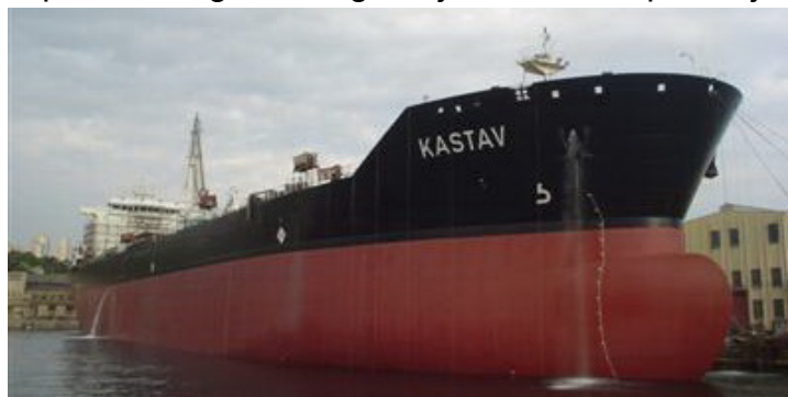
Slika 8. Tanker Kastav brodara Uljanik plovidba

Tablicom 9. prikazano je stanje flote brodara Uljanik plovidba d.d., Pula imena i tipovi brodova, njihova zapremina, godina izgradnje te zastava pod kojom plove.