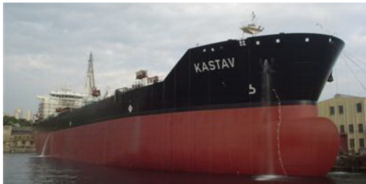
Slika 8. Tanker Kastav brodara Uljanik plovidba

Tablicom 9. prikazano je stanje flote brodara Uljanik plovidba d.d., Pula imena i tipovi brodova, njihova zapremnina, godina izgradnje te zastava pod kojom plove.